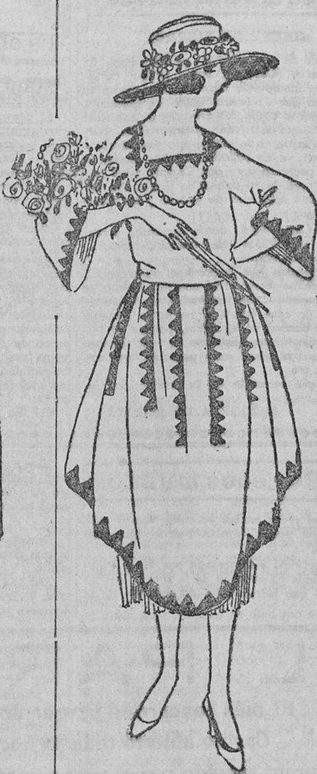
Sobre la ingenuidad de un organdi blanco, unas tiras lacustadas en color y blancas, si el organdi es de color.