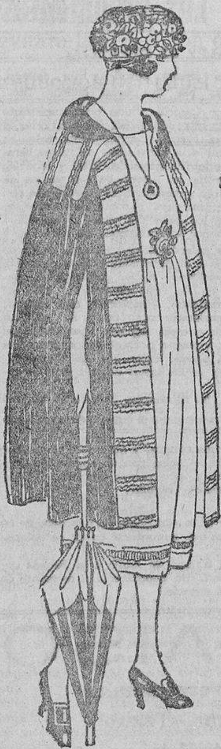
Una capa sencilla de «tricot» de seda negra adornada con «tricot» negro rayado en oro viejo.