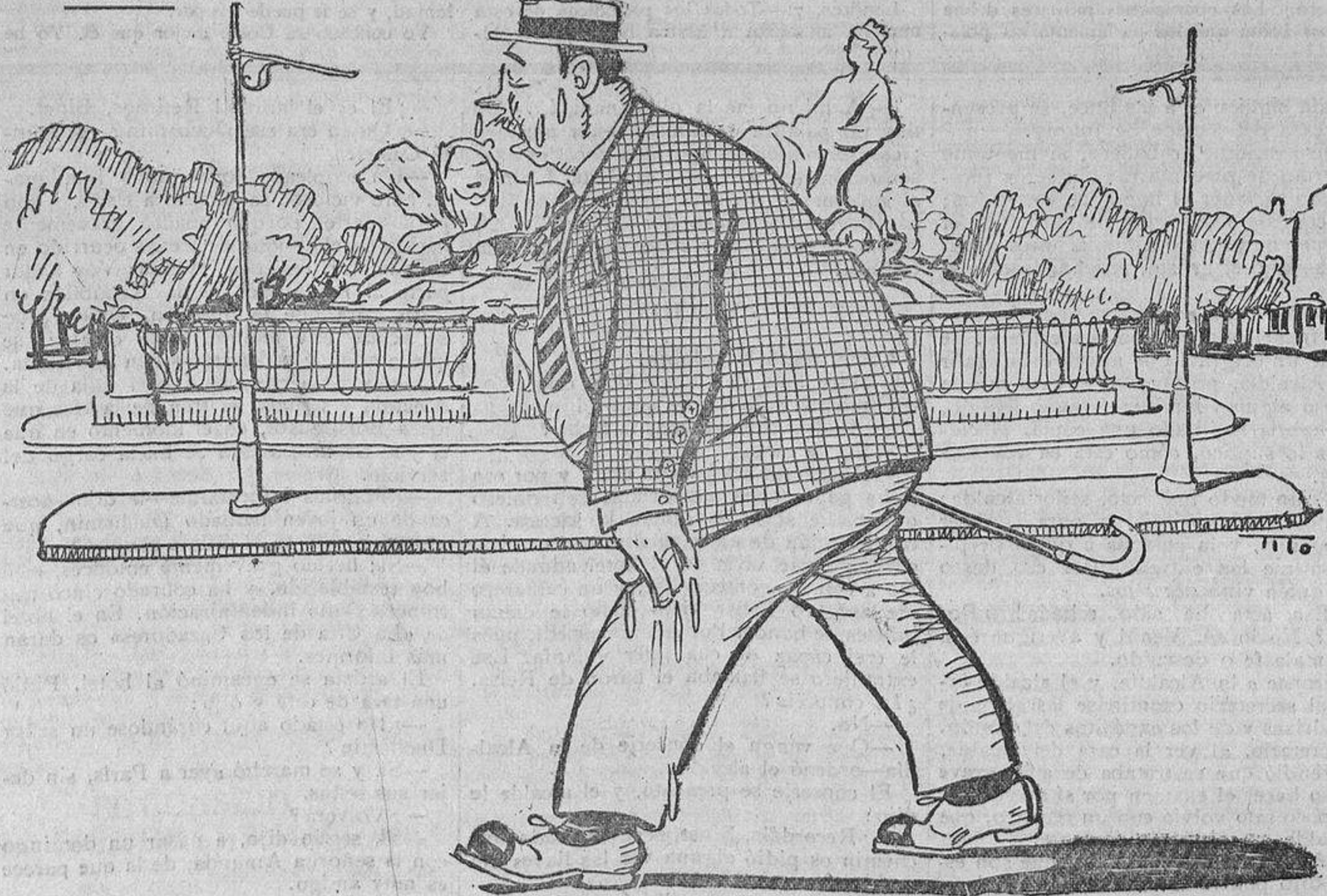
—Y aún dicen que tengo "buena sombra,"