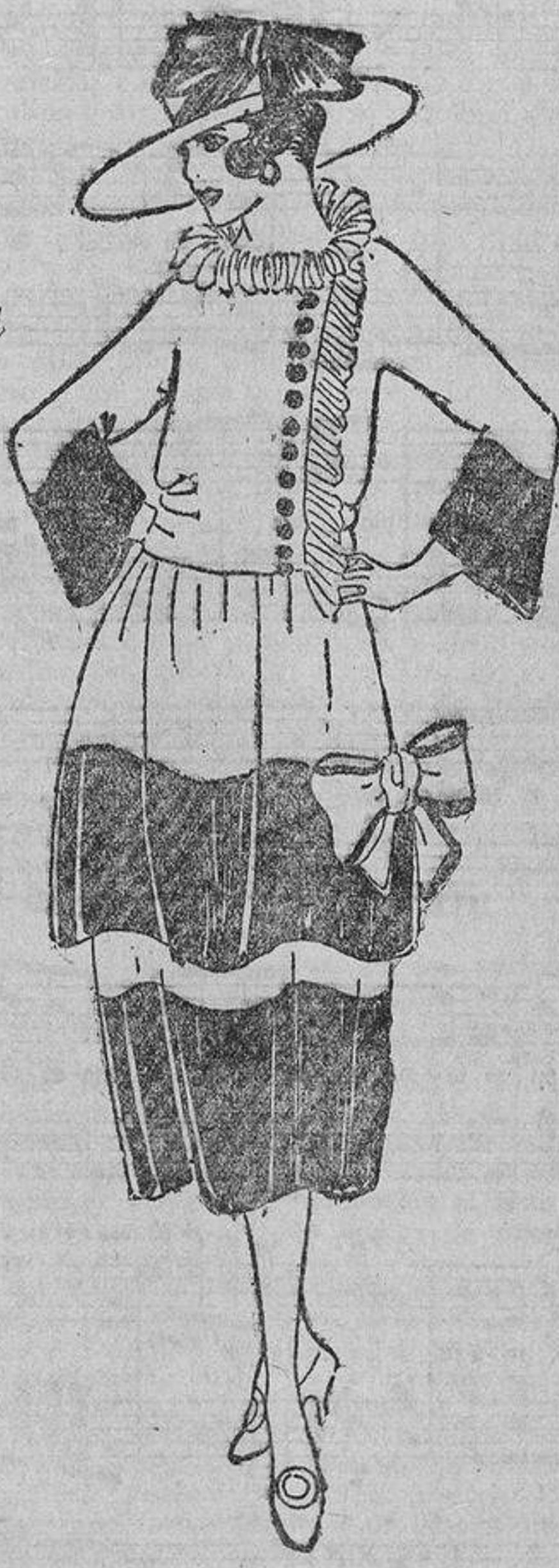
Armonía de unos zócalos de organdi azulina sobre un vestido de organdi blanco. Botones de nácar azul.