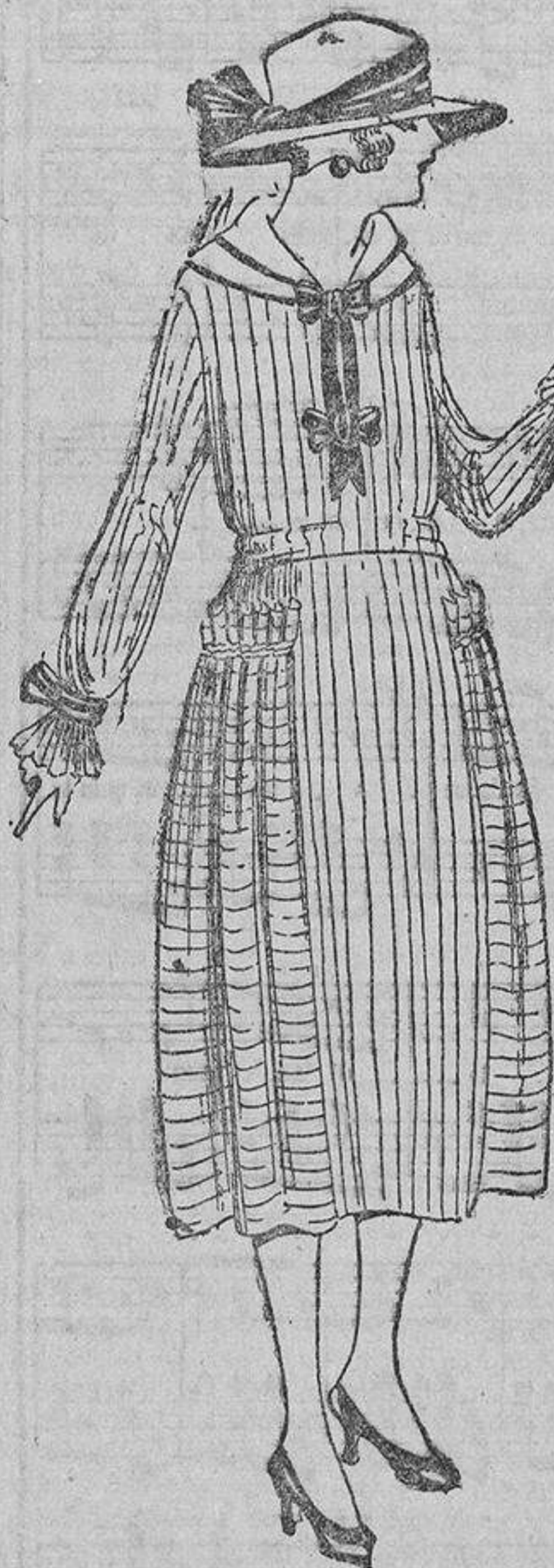
Una linda manera de interpretar un vestido con un tejido rayado, disponiendo las rayas verticales y horizontalmente.