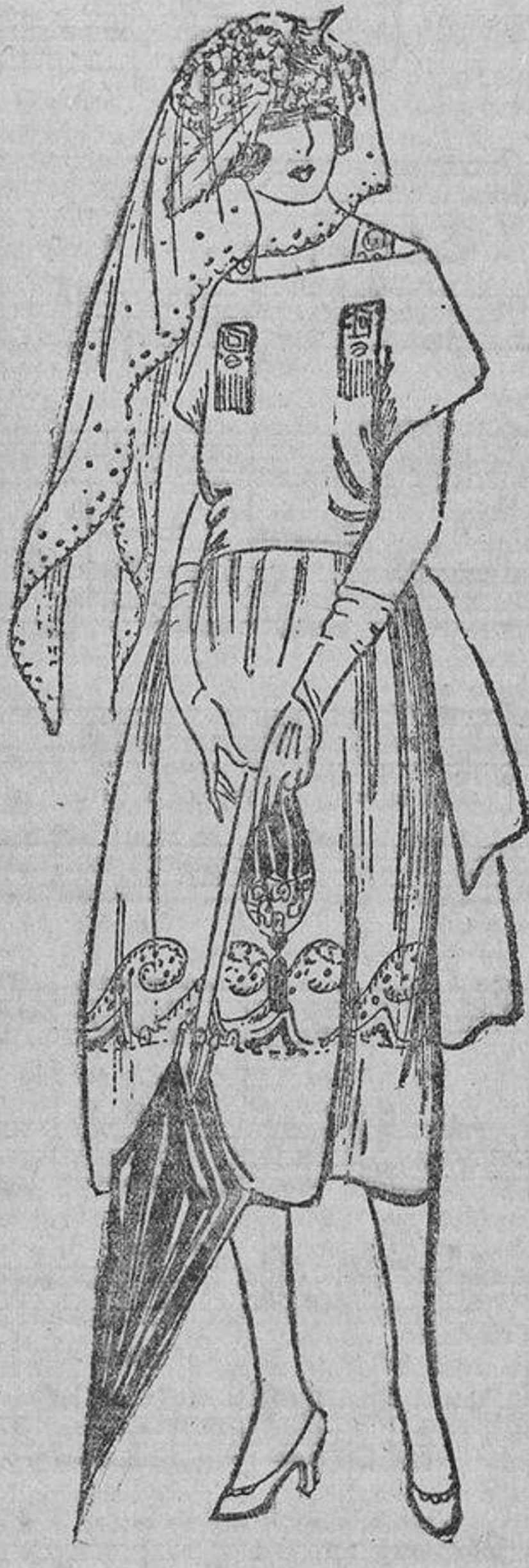
Si el presupuesto lo permite se elegirá, para coleccionar este vestido, un tejido de hilo, azul pálido, y si no de algodón, que se bordará con lana blanca y marino.

la causa de que los hijos de Adán vayan siempre peor vestidos que las hijas de Eva.