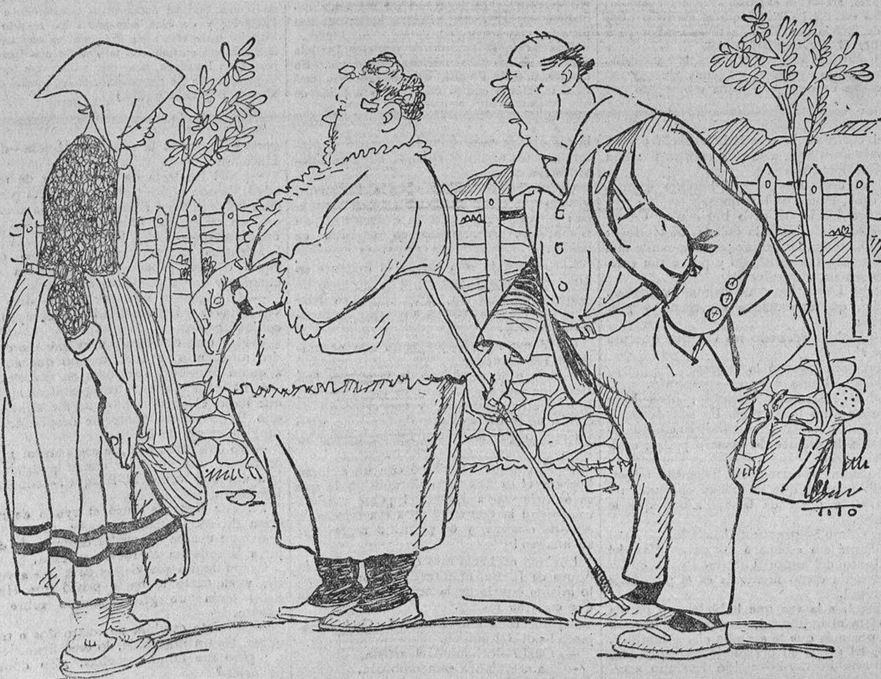
—Está esto tan aislado... La verdad, nos gustaría, sobre todo por la noche, tener un perro. —¡Me quedaré yo!