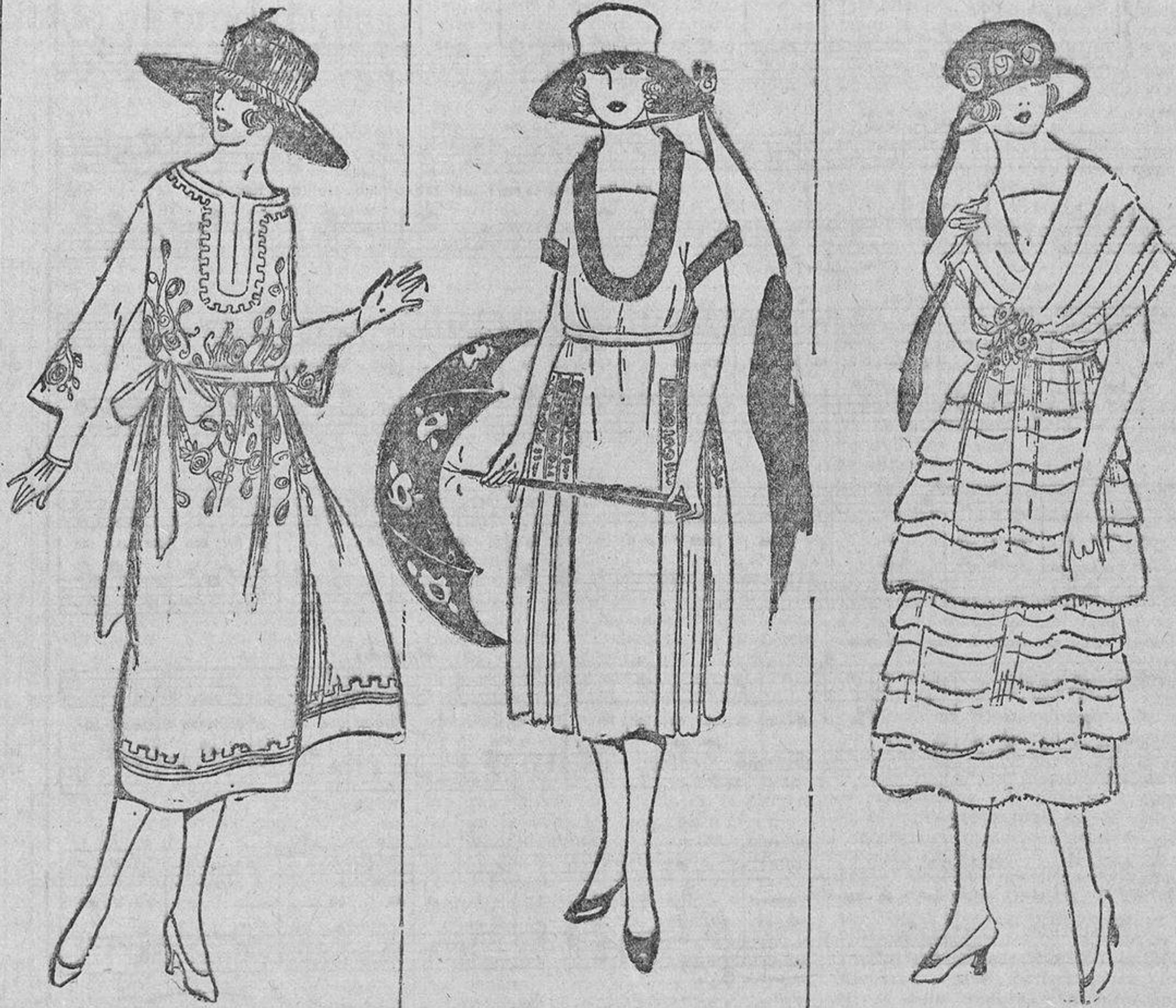
Del tono delicado del miosotis, bordado con sou-tache blanco lavable.

¿Y la emoción del contrabando? Hay señoras sensibles y tranquilas, incapaces de tomarse una molestia por nadie ni por nada, y que se envuelven el cuerpo en unos metros de cinta y se atan un frasco de perfume a la cintura nada más que por gustar de unos momentos de tensión nerviosa al pasar la aduana.