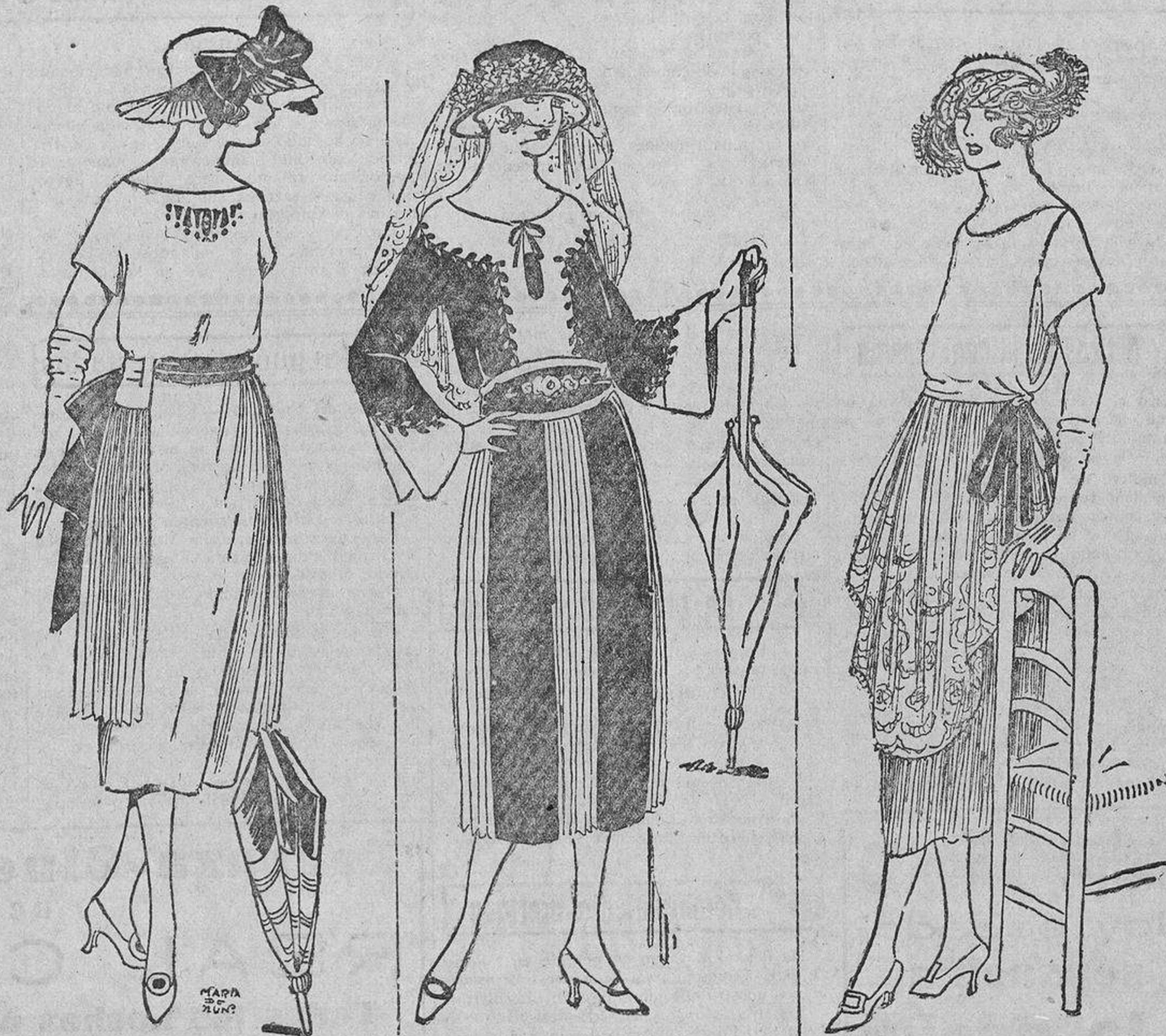
El sombrero sencillo «Carlotá Corday», tan amado por las «girls» inglesas, irá muy bien con el vestido ese, de crepón de China rosa pálido con bordados azul porcelana.