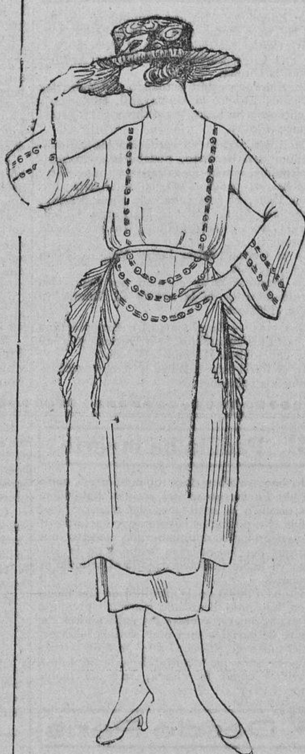
Sobre un vestido de crepón de algodón, unas guirnaldis bordadas con algodones lavables, y a los lados tres volantes de organdi, pliseado.

Este es un caso; pero refleja la conducta de todos los hombres en general.