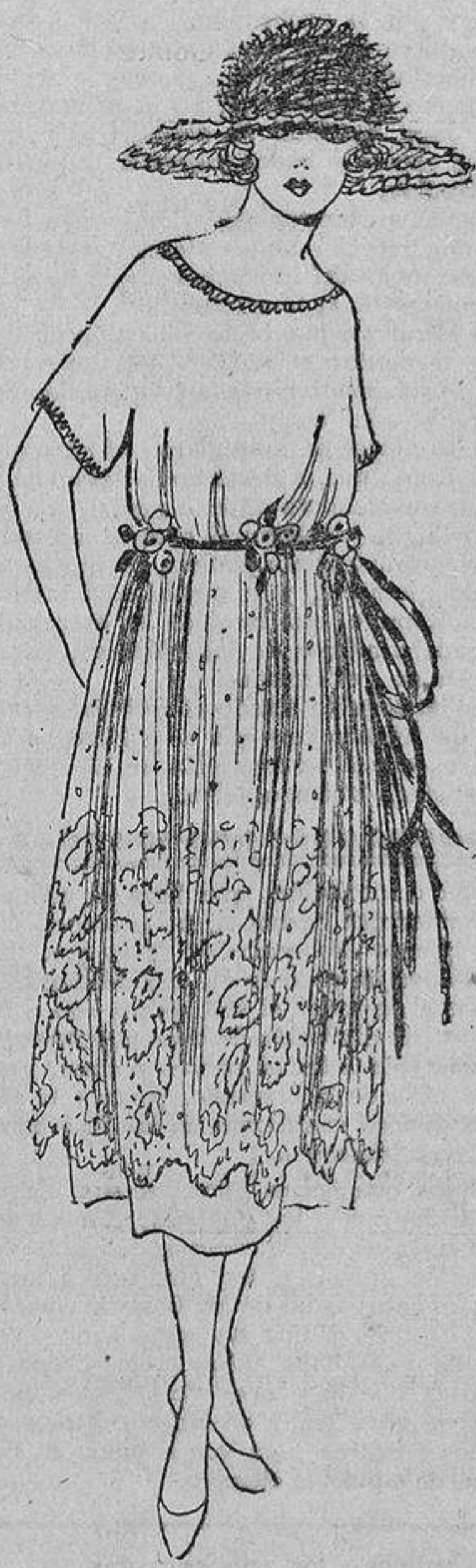
El cuerpo sencillísimo y la falda cubierta por un encaje, que puede llegar, si se desea, hasta el borde. Grupos de frutas de colores en la cintura.