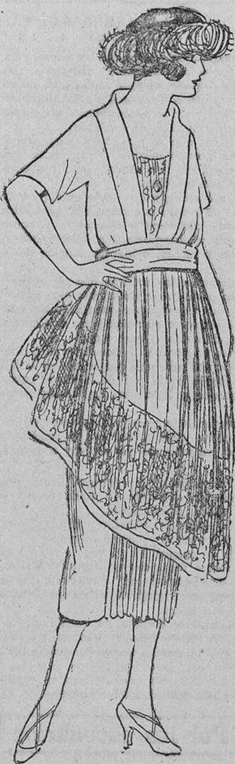
Ya que se llevan los encajes, ¿por qué no tiene un ancho entredós negro para colocarlo en la forma que indica el dibujo, sobre un vestido de tafetán negro?

—Sencillamente, que en días de carreras puedo considerarme viuda toda la tarde; no sé dónde anda; debe estar en las taquillas comprando papeluchos de colores. Estoy desesperada; las pocas veces que se acerca es para hablarme con gran entusiasmo de un caballo bautizado con un nombre extravagante... y aún no se ha fijado en que he estrenado esta tarde un modelo y no me ha dicho si me sienta bien este sombrero.