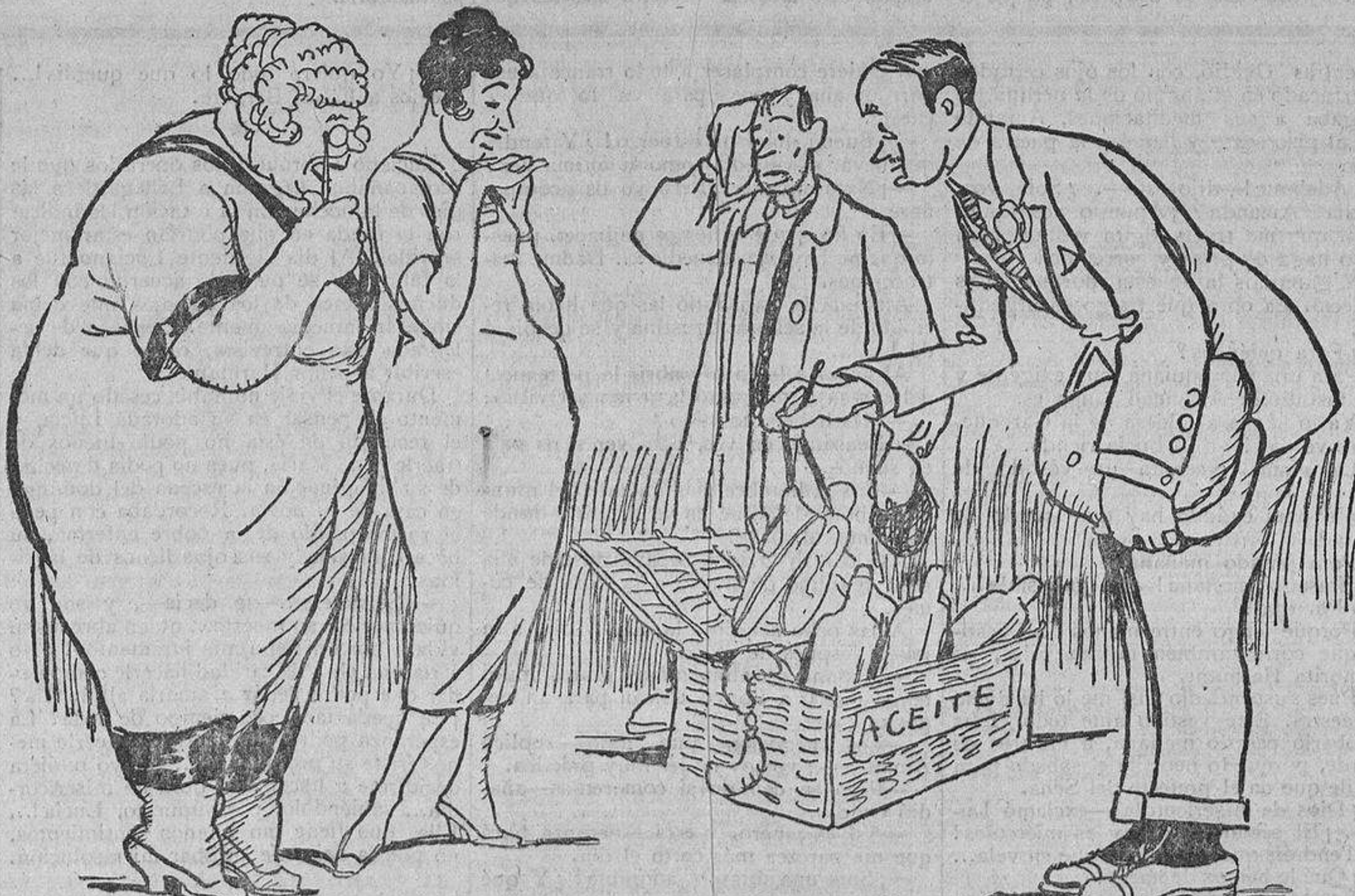
Se cruzaron valiosísimos regalos.

Después de la guerra todo cambió. Los Bancos dan a las cuentas corrientes un interés que llega en ocasiones al cinco por ciento; las casas han duplicado de valor; la tierra ha triplicado de producto; las industrias producen mucho más, y lo único que permaneció fijo, inmutable, fué el interés de los antiguos fondos públicos.