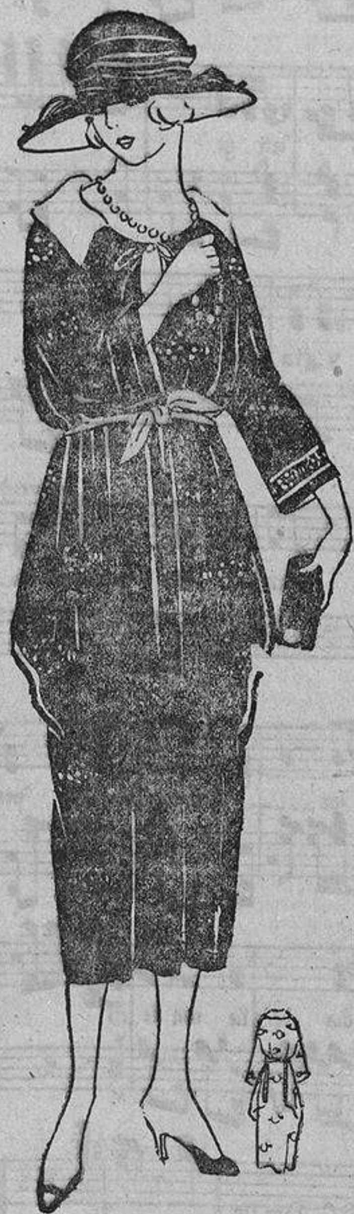
Los «paniers» de este vestido de seda azul marino, bordado con seda color ladrillo, nacen en los costados, detrás. El cuello es de organdi blanco; casi todos los modelos que nos llegan de París tienen cuellitos blancos.

La moda del estilo hace revivir modas que ya gozaron del éxito, pero convenientemente modernizadas. Tienen una garantía de triunfo que le falta a la moda de fantasía, que es una atrevida innovación. En estos últimos años hemos visto reaparecer todas las modas de estilo con una rapidez vertiginosa; en todas las colecciones de París figuran algunos de estos modelos, bien sea para calle o para bailes. Las bellezas así ataviadas consiguen tener un sello de clasicismo, majestad y buen gusto que no conseguirían con «toilettes» de fantasía. Pero al hablar de modas de estilo no hay que creer que con ellas se da la sensación de mujeres fugadas de una pinacoteca; las modistas saben modernizarlos con tanta sabiduría, que no desen-