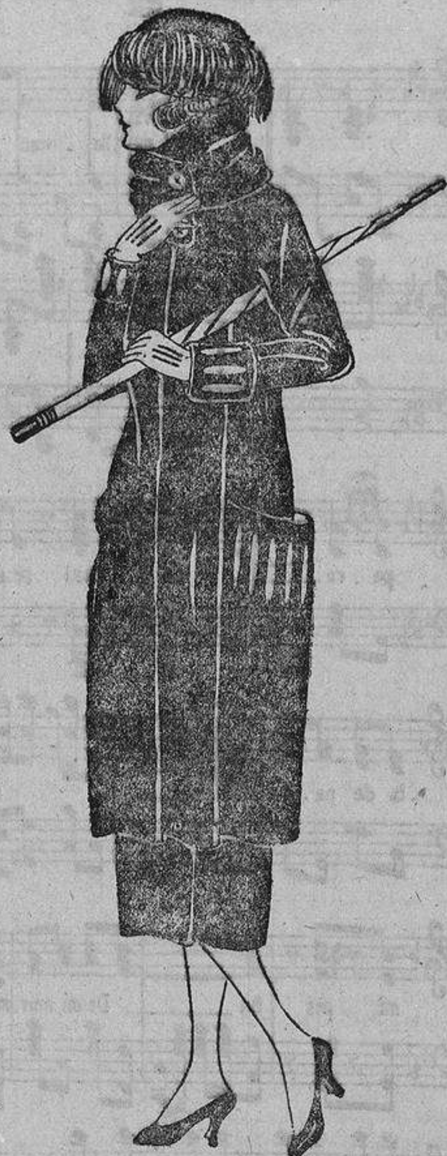
«En abril aguas mil»; por eso para afrontarlas apropiadamente nuestra figurina lleva un traje de gabardina azul marino, con gran cuello y unos ojales recortados sobre un fondo de piel de cabritilla roja.

tona con los demás modelos de fantasía por conservar el sello de los tiempos pasados.