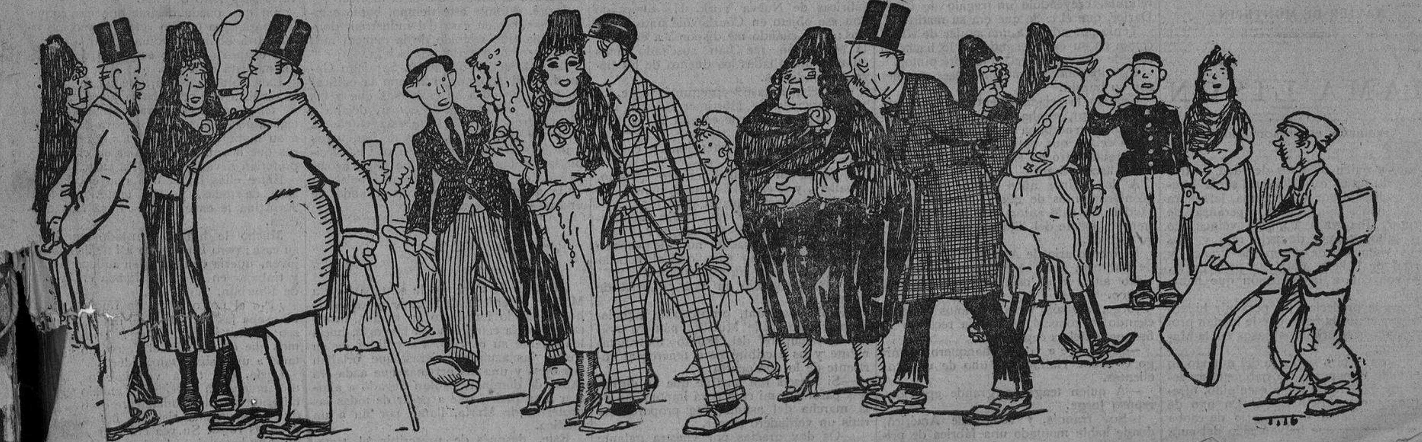
El inz marido, padre y futuro suegro:—¡Ya empezó Cristo a padecer!...