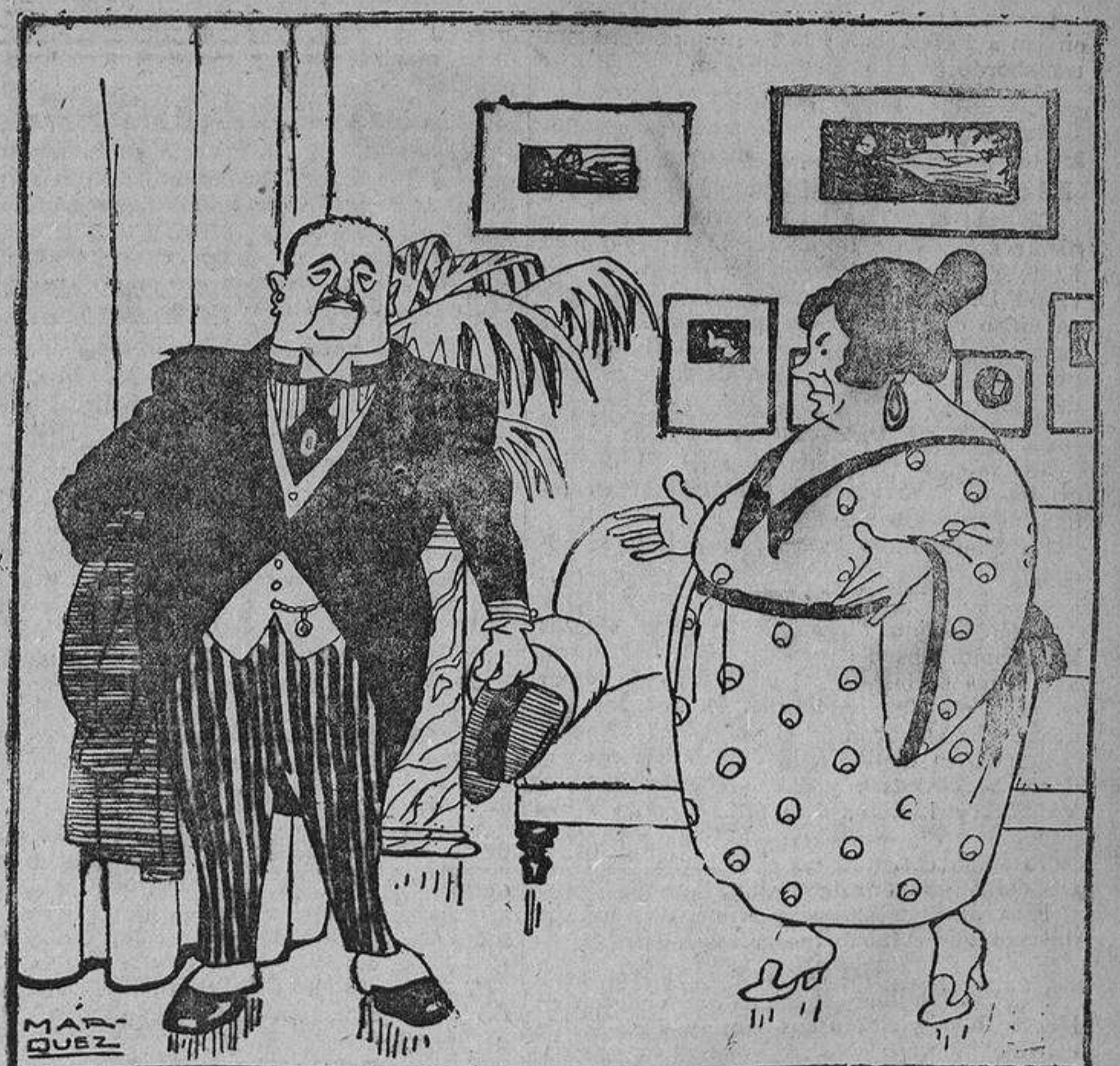
—Cada día te acicalas más, llevas más dinero y regresas más tarde a casa —Ten presente, vida mía, que presidio no sé cuántas Juntas benéficas y que organizo varias funciones patrióticas..