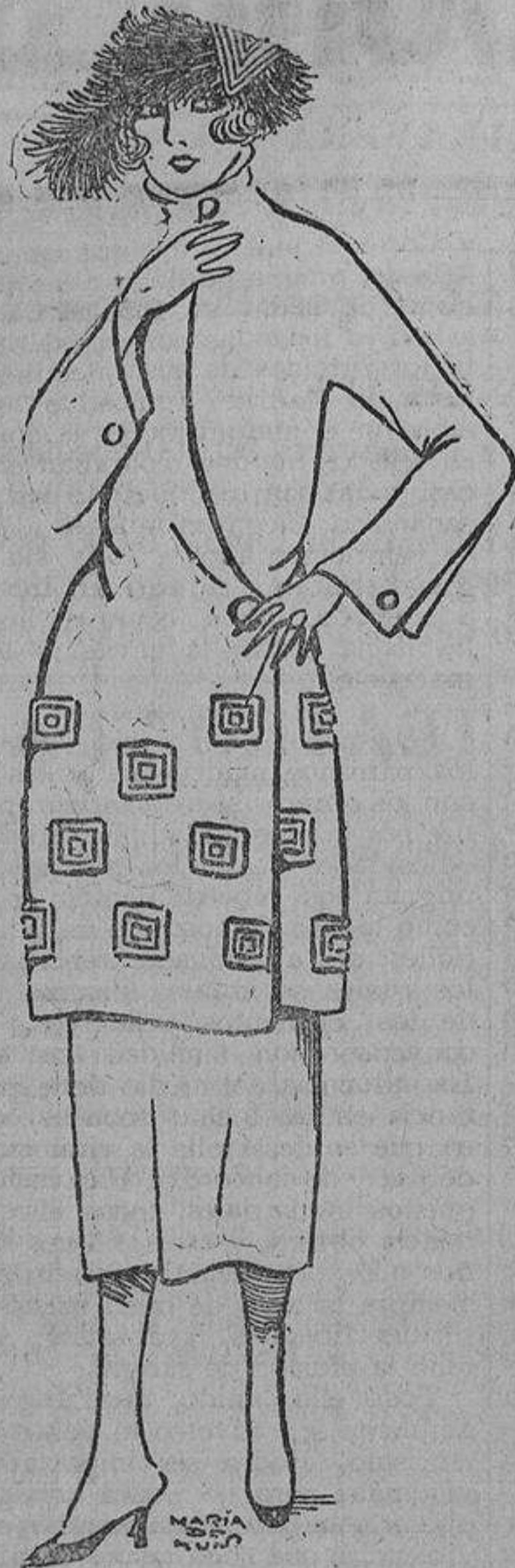
Muy elegante este traje de paño «beige» con cuadrados de la misma tela, de distintos tamaños, cortados y sobrepuestos. El cuello puede ir abierto.

Para las mujeres, porque nosotras somos las primeras en admirar a una mujer bien vestida, en comentar, alabando o criticando, todos los vestidos de nuestras amigas; y comprendemos que ellas harán lo mismo; además, nos proporciona una gran alegría ver las miradas de admiración o envidia de las demás mujeres. ¡Y qué caro nos cuesta esto! Hay vestidos acertados, que, por nosotras, los llevaríamos varias temporadas y ¡no puede ser! por «ellas»; los o dejarlos a un lado.