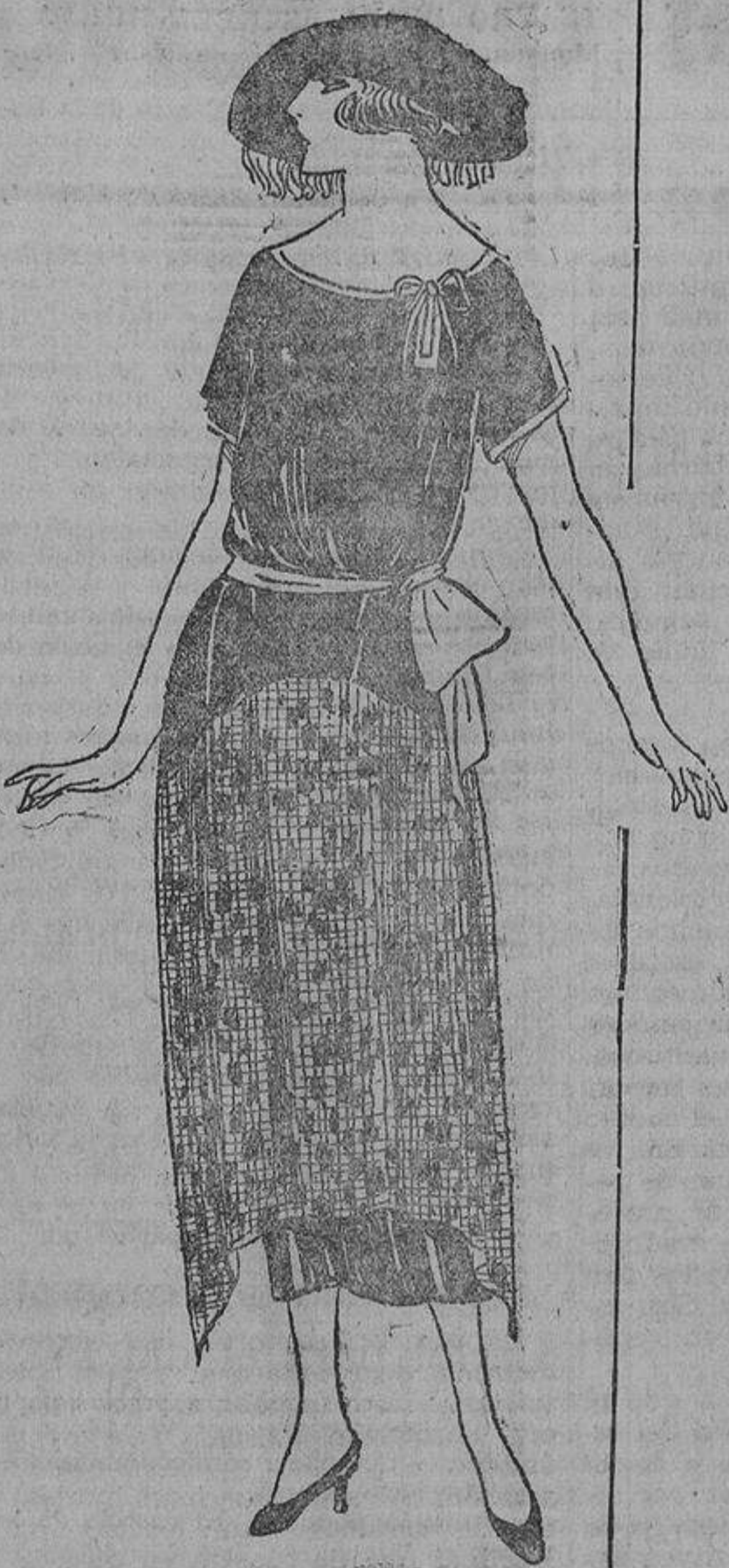
Para mucho vestir, este traje de «charmeuse» negro con tul negro, bordado en «nattlers» o de color, con encaje tejido en el mismo tono.