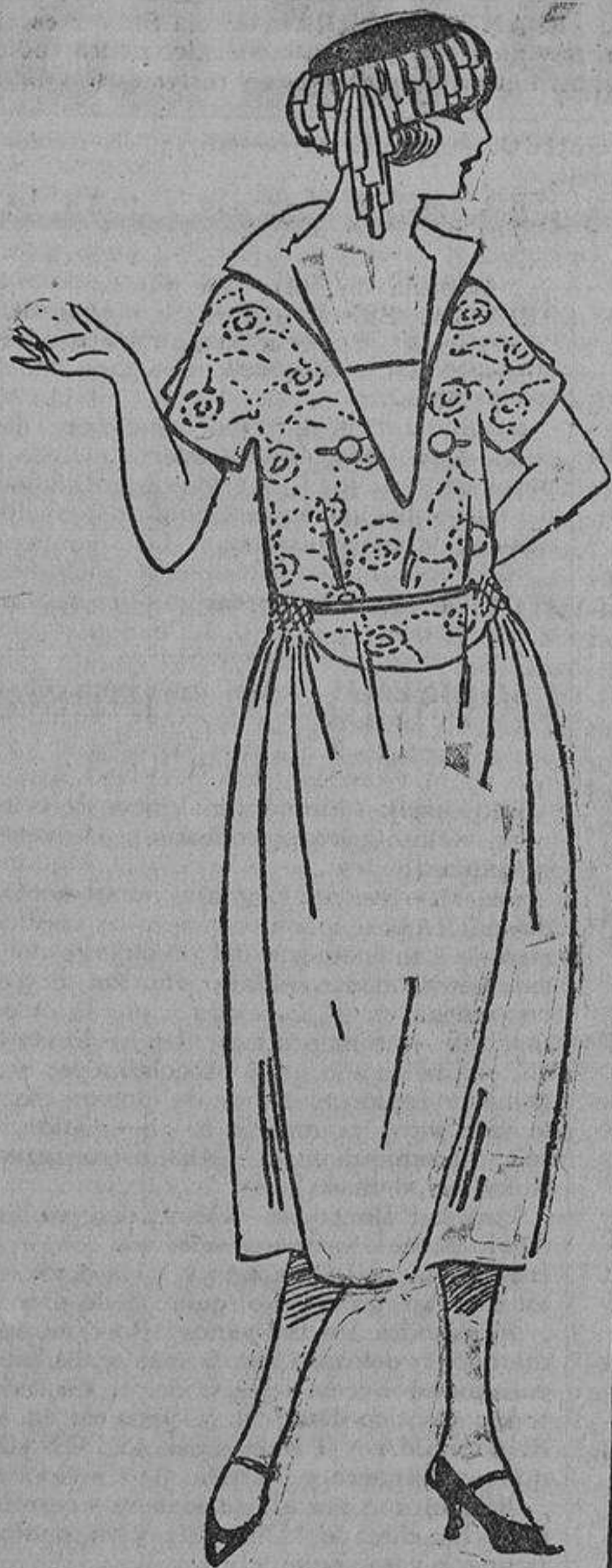
Sencillo y lindo vestido de crepón de China gris, bordado con seda lisa del mismo tono. Frunce nido de abejas a los lados.

Los hombres no se cansan de decirnos que lo que aman en nosotras es a nosotras mismas; pero no les hacemos caso. Queremos a todo trance gustarles, y para eso elegimos el medio que más nos gusta; ¡gran sacrificio!