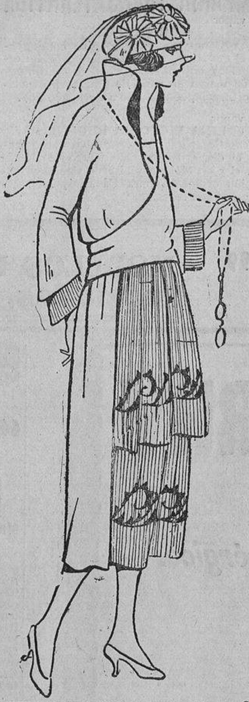
De «charmeuse» azul marino, con dos volantes de crespón «georgette» bordados en azul «nattier»; cuerpo cruzado que se anuda en la espalda.