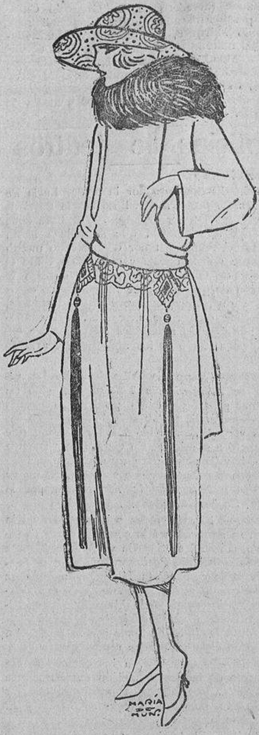
Una bonita idea de ese bordado negro, del cual caen delante y detrás unos larguísima borlones de fleco.

Apenas existe el término medio: o grandes o muy chicos, en forma de tocas, cubiertas de flores, veladas por un tul que rodea la forma y cae a un lado, formando un gracioso lazo. Estas formitas, con graciosa «caída», sea de cinta, de tul o de tela flexible, tendrán y tienen un éxito inmenso, porque favorecen a la mayoría, dando ese aire añorado, que con la ayuda y complicidad de las patillas rizadas, buscamos todas.