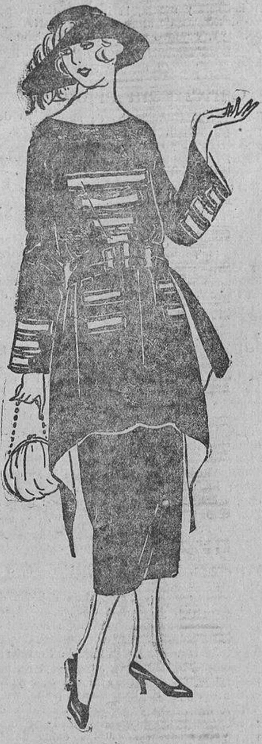
Sobre un vestido de «kasha» azul marino muy oscuro, unos galones de seda rojos con un filete verde cardenillo. La sobrefalda abierta detrás.