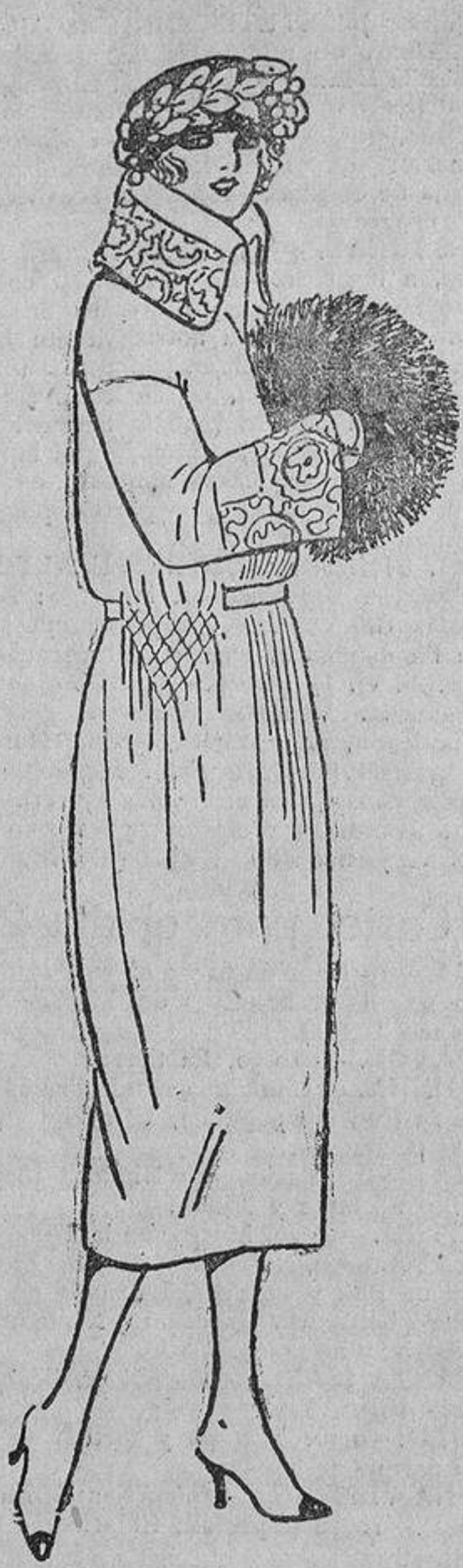
En los abrigos, los franceses «nido de abeja» se colocan a menudo en forma de triángulo, como en este abrigo de terciopelo de lana color arena.

En cuanto al capítulo de los sombreros, es de notar el incremento de las formas grandes, abandonadas desde hace algunos años.