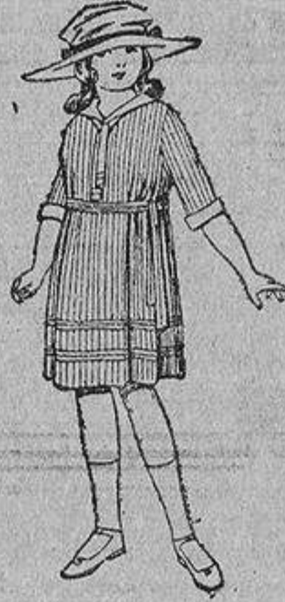
Vestidos de voile listado, adornos blancos, para niñas de cuatro á nueve años. De ptas. 22 á 32.