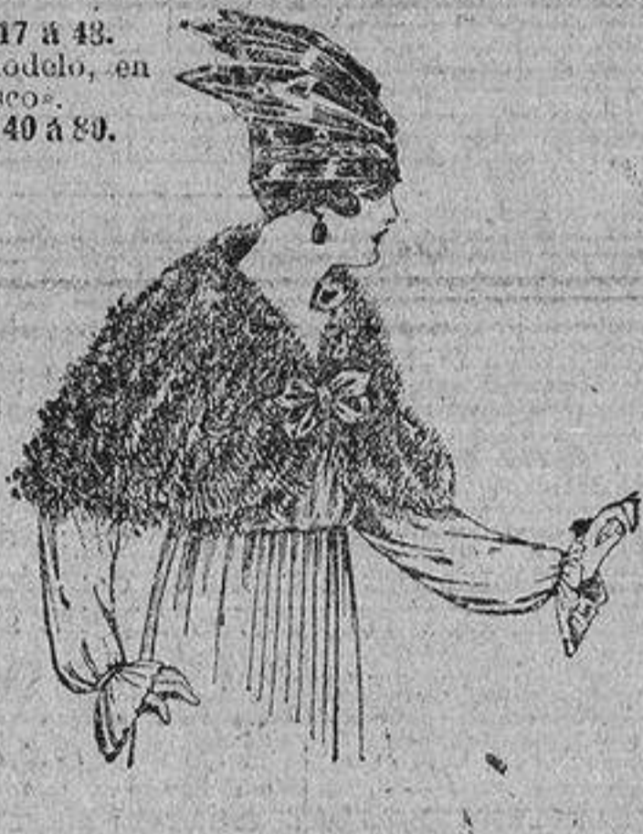
Capellna de marabú adornada, con cinta y forro seda. De ptas. 32 á 40.