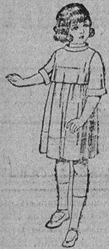
Vestidos de seda liberty, pougée, etc., para niñas de siete á doce años. De ptas. 30 á 38.

Ropas confeccionadas para Caballero, Señora, Niño y Niña