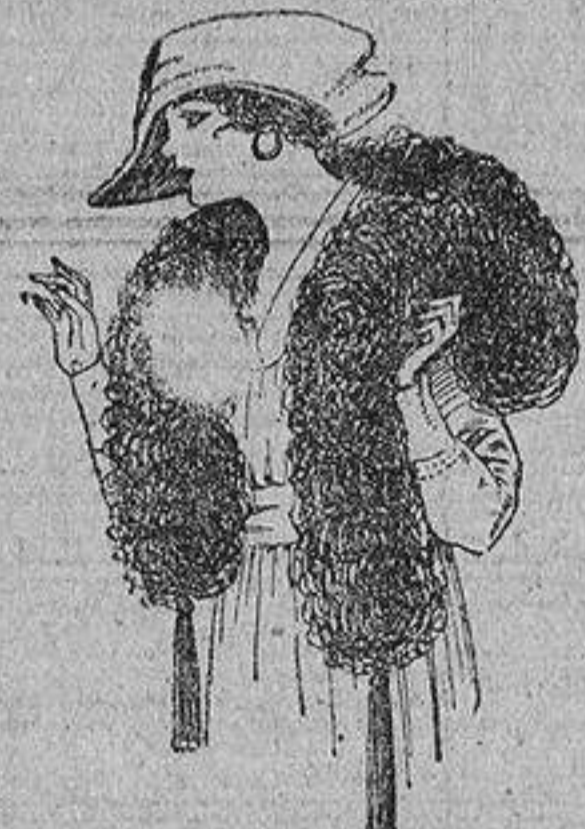
Boa de pluma avestruz en negro, blanco, café, gris, etc. De ptas. 32 á 70.

Peletería, Camisería, Géneros de punto, Corbatería, Guantería, Sombrerería, Zapatería, Paraguas, Bastones y Artículos de viaje