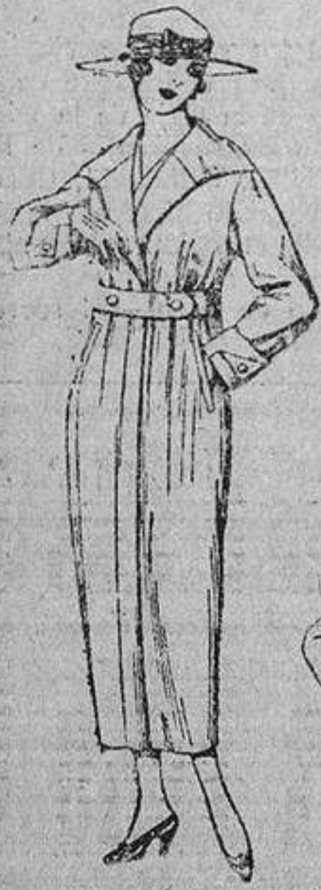
Guardapolvos de gabardina, dril y alpaca, colores beige, kaki, gris, etc. De ptas. 22 á 55.