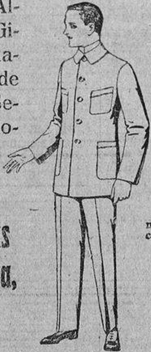
Trajes de sarga inglesa, laquilla, etc., en negro, azul y color. De ptas. 110 á 135.