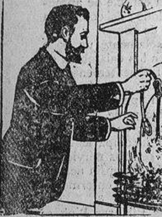
Cure su quebradura y eche el bragueros al fuego.

Se han hecho arreglos para que a todos los lectores de La Correspondencia de España que sufran de quebradura se les envíen completos detalles acerca de este invaluable descubrimiento, sin coste alguno, y se confía que todos los que lo necesitan se aprovechen de esta generosa oferta. Basta sólo llenar el adjunto cupón y enviarlo por correo a la dirección que se indica.