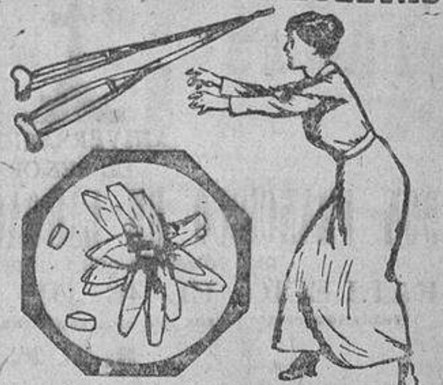
Cristales de ácido úrico tal como se ven bajo microscopio. Una prueba palpable de como el Uricure elimina del sistema el ácido úrico.