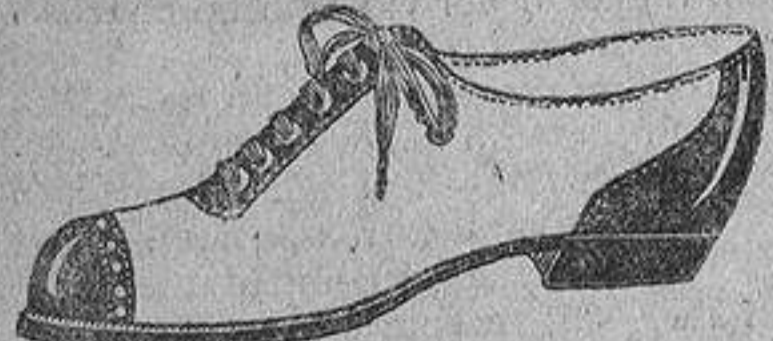
Zapatos de lona blanca, con adornos de charol, suela natural, de pesetas. 14 a 18,25 Los mismos en piel negra, color y charol, de pesetas. 13,50 a 25 Los mismos, con suela de cáñamo y adornos de piel negra y color, a pts. 9,50