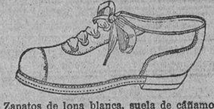
Zapatos de lona blanca, suela de cáñamo, canto tapado, de pesetas. 4,25 a 9 El mismo, para señora, de pts. 3,50 a 8 El mismo, para niños, de pts. 3,50 a 4,50