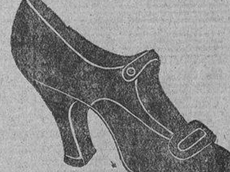
Zapatos d'óngola negra, de pts. 13 a 20 Los mismos, de charol, clase extra, a pesetas. 20 Los mismos, lona blanca, de pts. 8 a 13