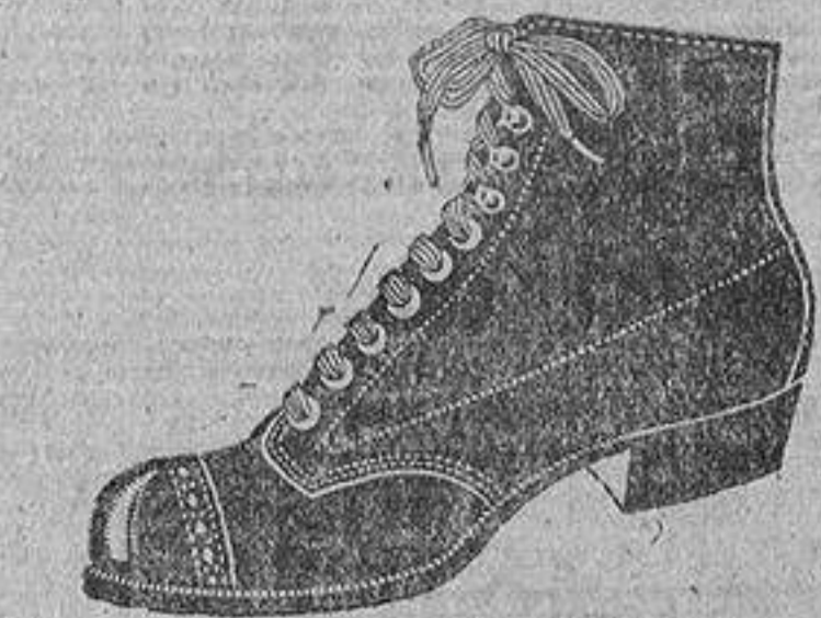
Borcigués de oscaría en color y negro, corto «Blucher», de pesetas. 16 a 25