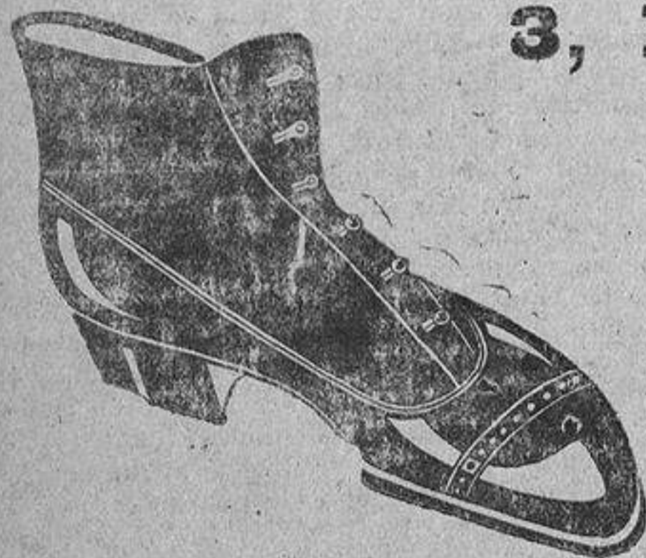
Polaco d'óngola negra, de pts. 16,50 a 25 El mismo, oscaría color, de pts. 17 a 25