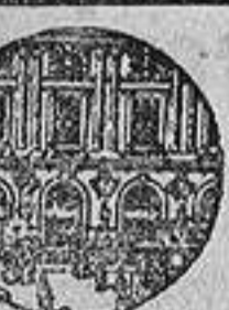
Campo de visión con el Gemelo de Campaña

Se ruega mandar el Bolefin de Compra á los Establecimientos QUILLET, Doctor Don. 13.-BARCELONA