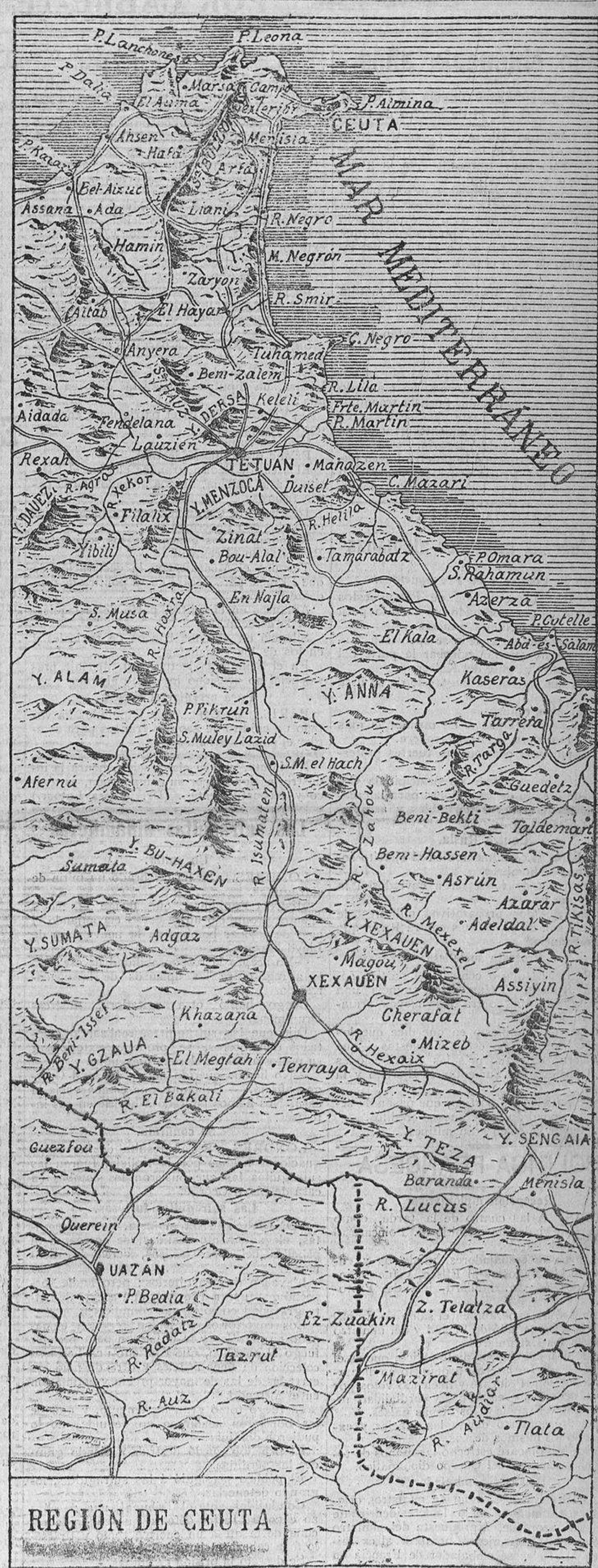
REGIÓN DE CEUTA Iniciada ya nuestra acción en Africa, comenzamos a publicar los mapas de la zona española, que dividimos en regiones para que sean más claras y cómodos. En días sucesivos publicaremos los correspondientes a las regiones de Alkazar, Peñón, Alhucemas y Melilla.