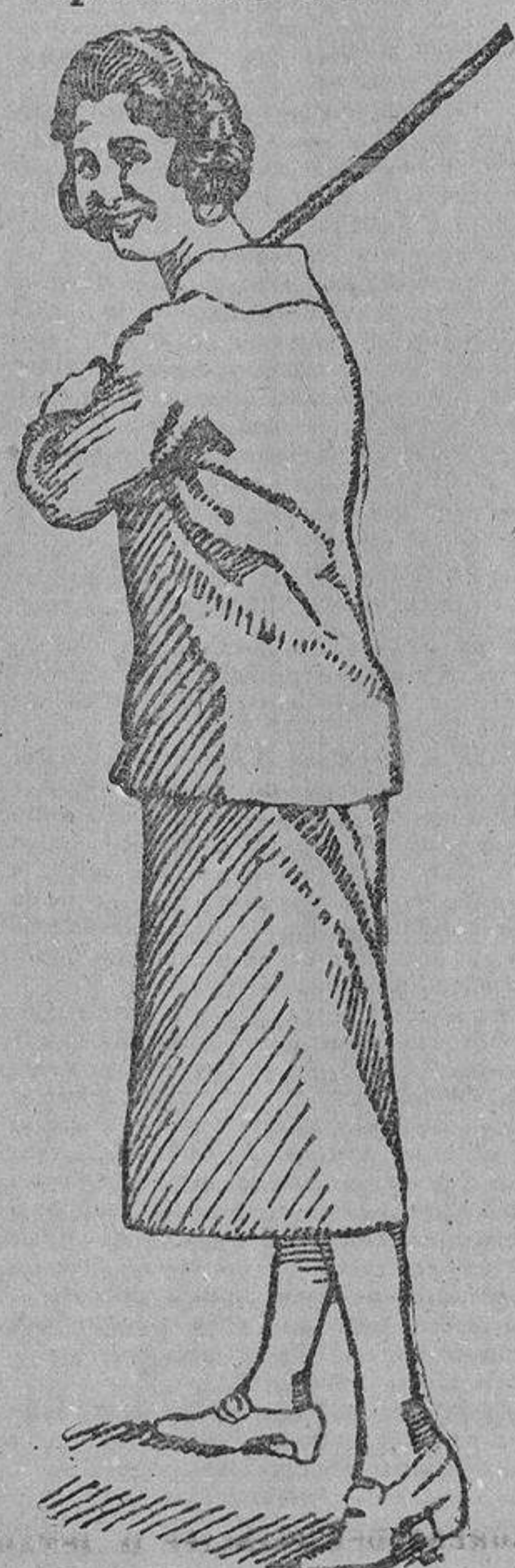
La marquesa de San Vicente del Barco, Cuestista de Alba, entusiasta jugadora de golf de aristocrático Puerto de Ilorrio.