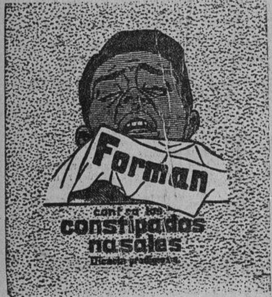
De venta en las Farmacias.—Caja, 75 céntimos.