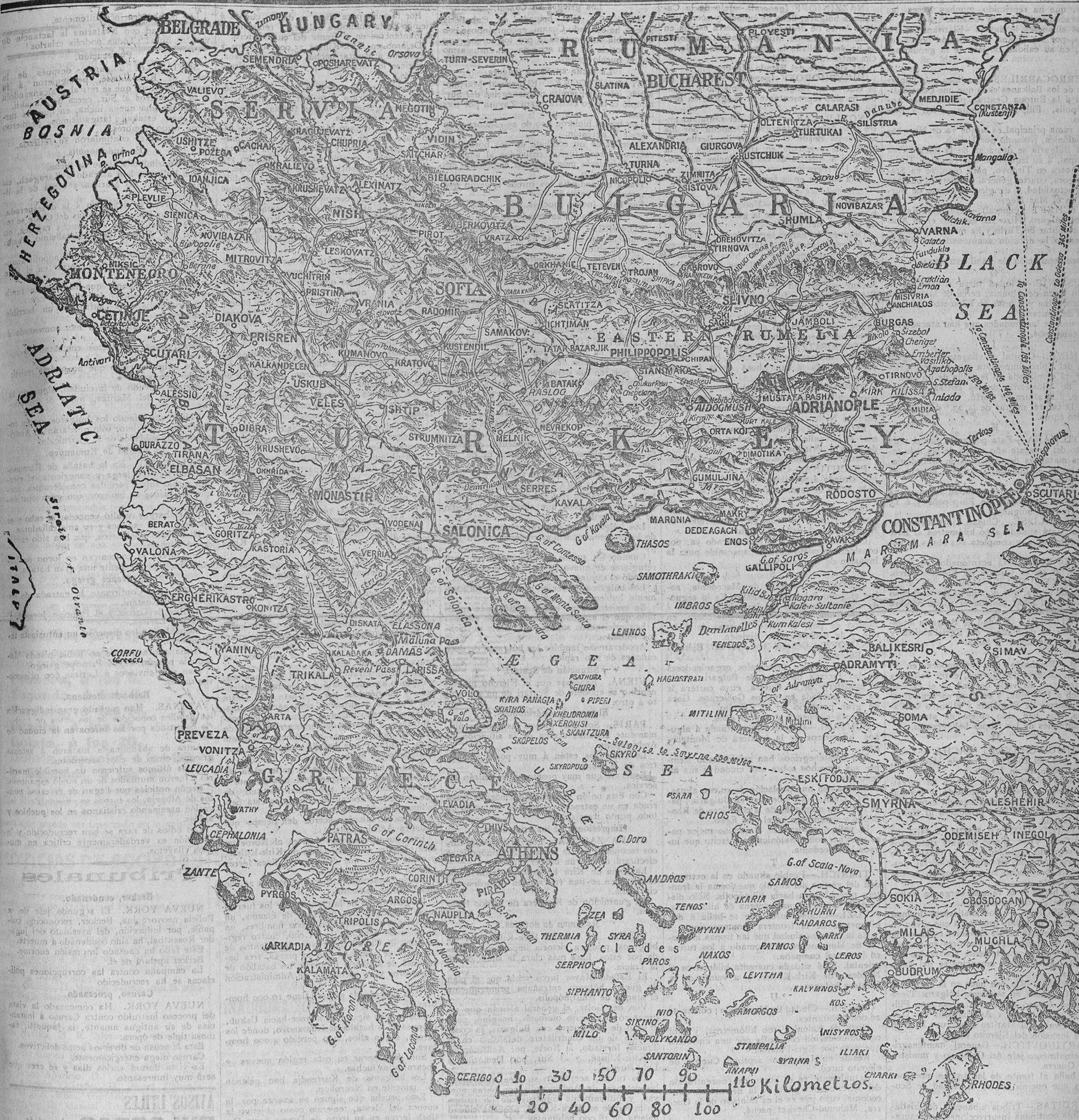
MAPA DE TODOS LOS ESTADOS BALKANICOS EDITADO POR "THE DAILY TELEGRAPH"