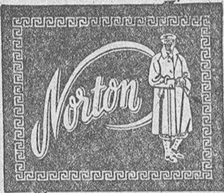
Sólidas - Garantizadas