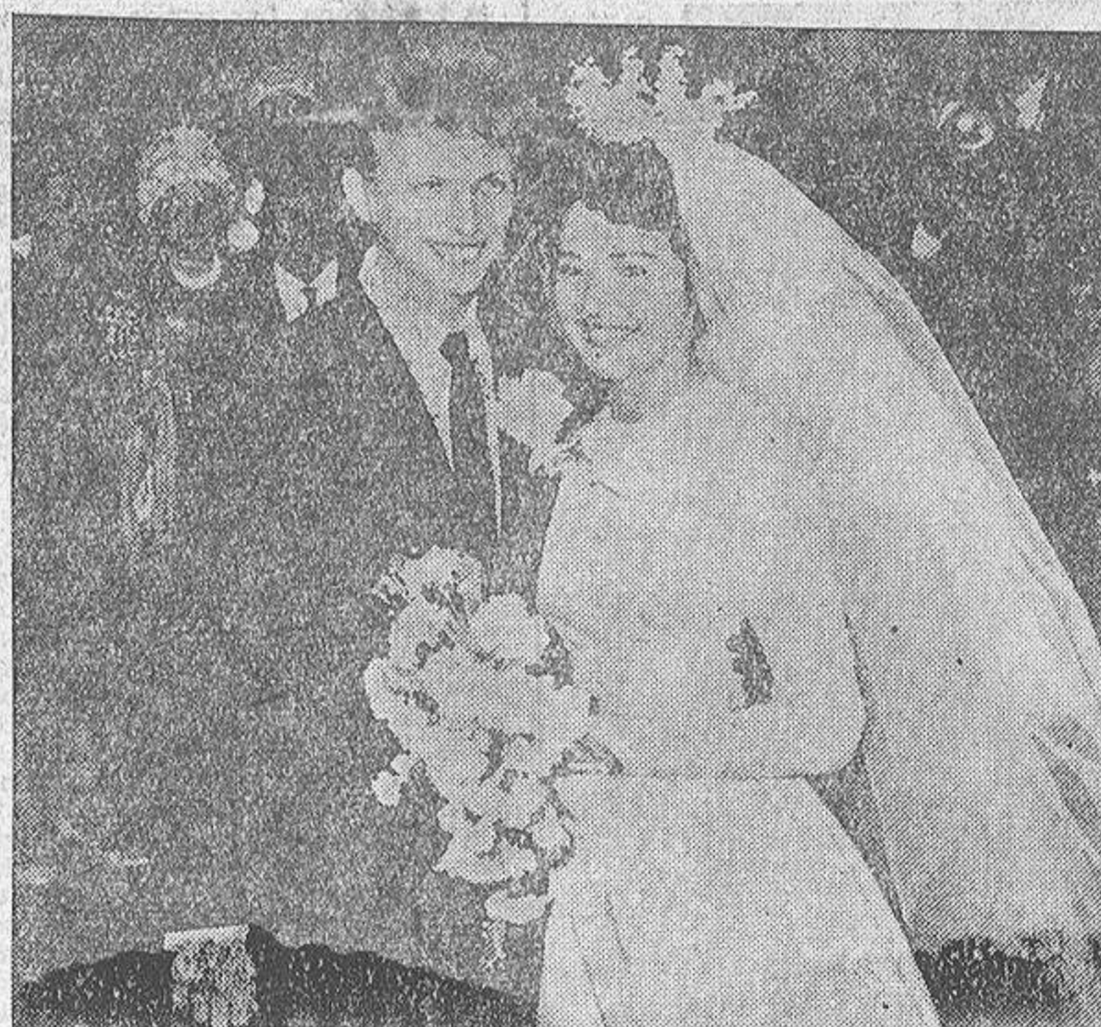
En Londres, se casó hace unos días el cantante de "Rock and roll" Tommy Steele. La novia es una muchacha de veintitrés años, nacida en el Soho y llamada Ann Donoghue. A la ceremonia concurrieron los más afamados actores británicos, y a la salida del templo la Policía tuvo que proteger a la pareja del entusiasmo de la multitud. Tommy, que está considerado como el "rey del rock", es el cantante mejor pagado de Europa.