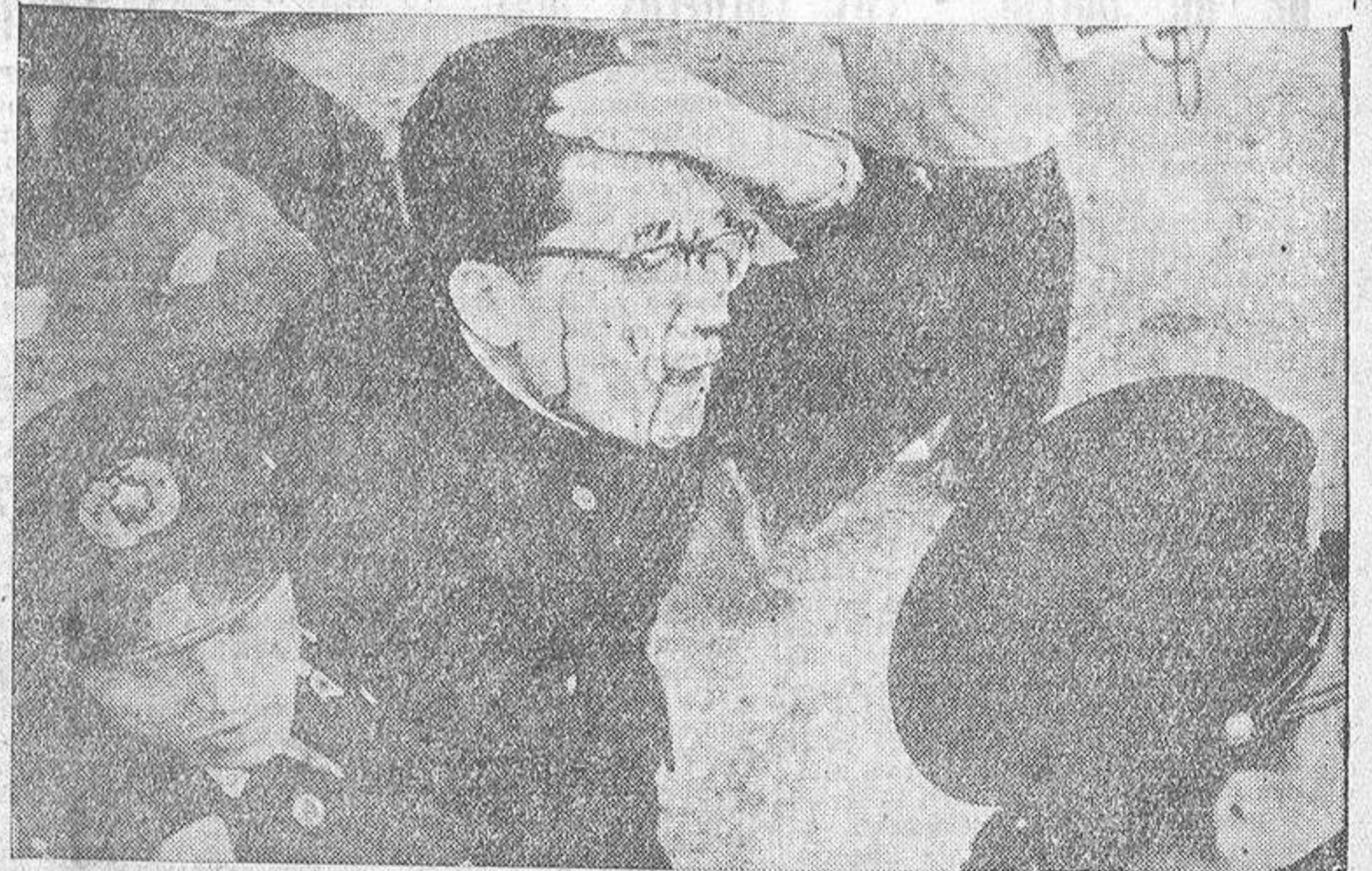
Las manifestaciones estudiantiles japonesas, que se vienen sucediendo desde el anuncio de la visita de Eisenhower a Tokio, han tenido momentos realmente dolorosos, como este que registra la foto, en que un policía con la cara ensangrentada es llevado por sus compañeros al puesto de socorro. A pesar de haberse ratificado el Tratado de Seguridad entre Japón y Estados Unidos, las protestas siguen a la orden del día. Huelgas, manifestaciones y toda clase de disturbios han venido a poner de manifiesto la intensa actividad de los comunistas en aquel país.