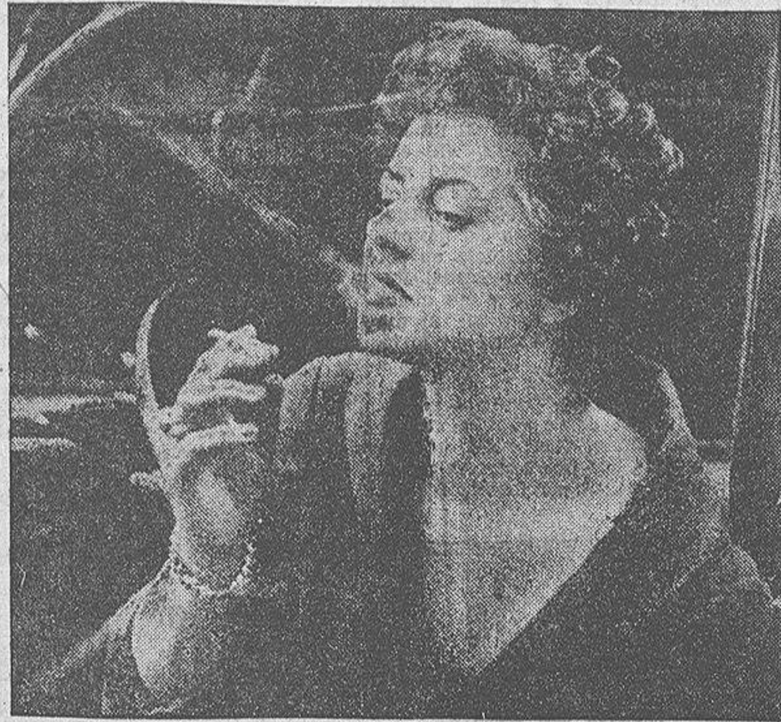
Rosemarie Nitribitt, fotografiada pocos días antes de su muerte. Nacida en Düsseldorf, en 1933, había tenido una infancia difícil. Rosemarie fue encontrada muerta en su apartamento de Francfort, el 2 de Noviembre de 1957. Los tribunales estudian ahora el caso.