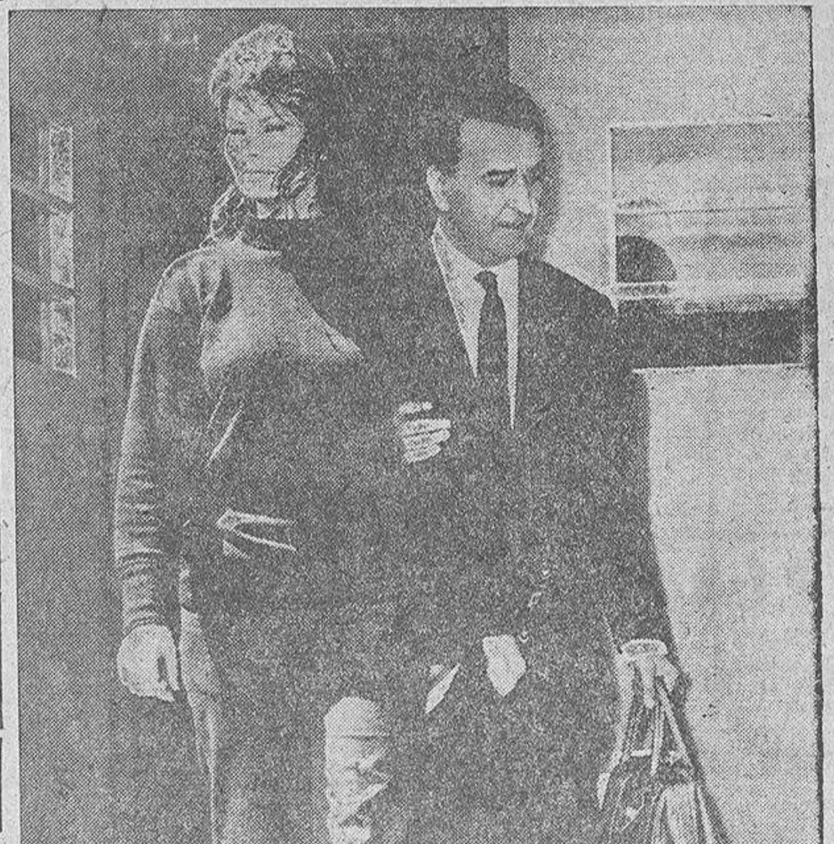
Sofía Loren, visiblemente abatida, entra en el estudio de Elstree, en Londres, con el productor Pierre Rove para rodar una escena de la película "La millonaria". La actriz ha ofrecido un premio de veinte mil libras esterlinas a quien consiga la recuperación de sus joyas robadas. Se observa, sin embargo, que según las costumbres de los bajos fondos londinenses, un ladrón no roba joyas de un valor tan elevado si no tiene ya preparada su venta.