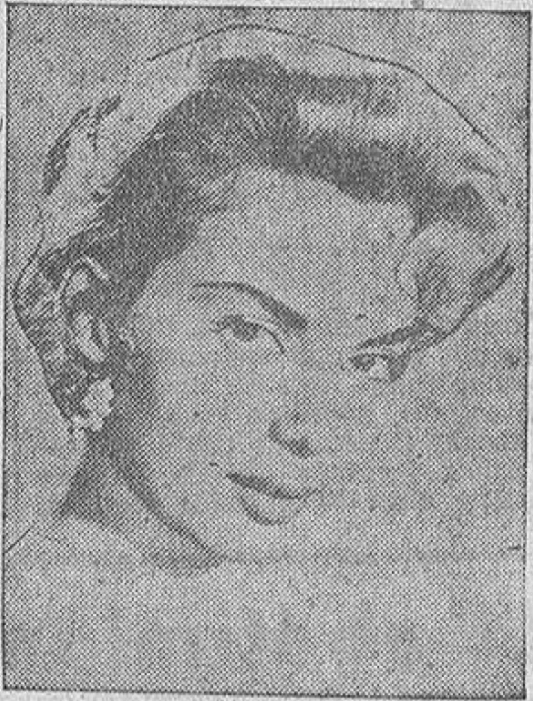
Abbe Lane, tan sugestiva y bella como floja actriz, es protagonista de dos de las películas estrenadas esta semana en las pantallas coruñesas

POR esta vez hay que reconocer que el cine norteamericano se ha salvado de la quema, pues lo peor del lote semanal corresponde a realizaciones europeas, entre las que fi-