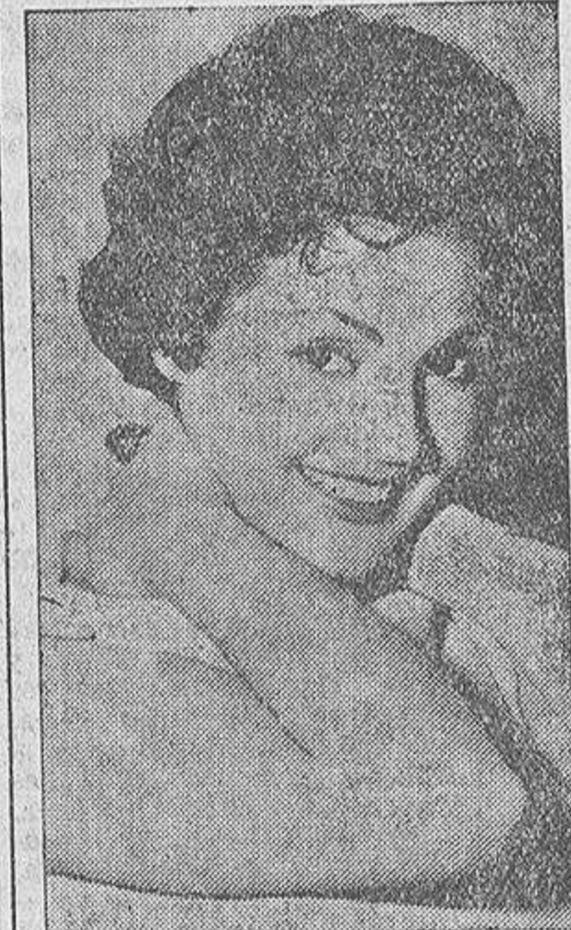
Carmencita Sevilla, la más internacional figura de nuestro cine y una de sus «guapas» más características, ha sido designada como Madrina de Honor de la señorita que resulte elegida en Madrid con el título de «Estrella de España» entre las candidatas regionales que opten allí al codiciado título. En «Triunfo», revista organizadora del certamen en España, Carmencita Sevilla ha puntualizado la importancia de este título nacional al que tendrá acceso la señorita que en nuestra Fiesta de Primavera sea proclamada «Guapa de La Coruña» 1960