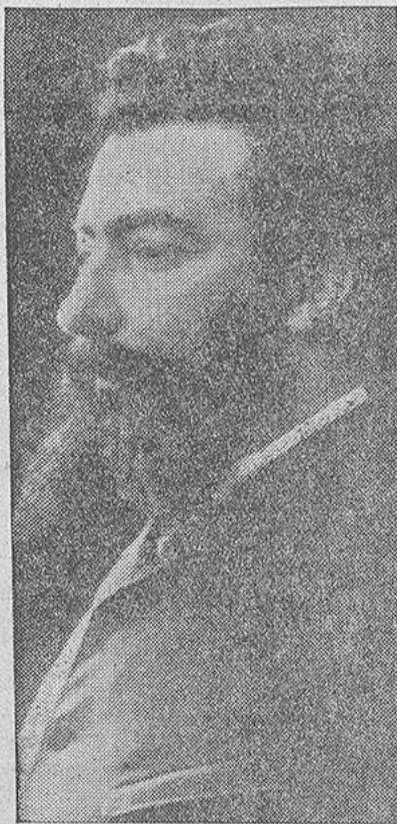
Manuel Barros, ilustre padronés, periodista en Cuba y Argentina, primer presidente del Centro Gallego de Buenos Aires, e impulsor del periódico bonaerense "La Nación Española", el más importante de América del Sur en su tiempo