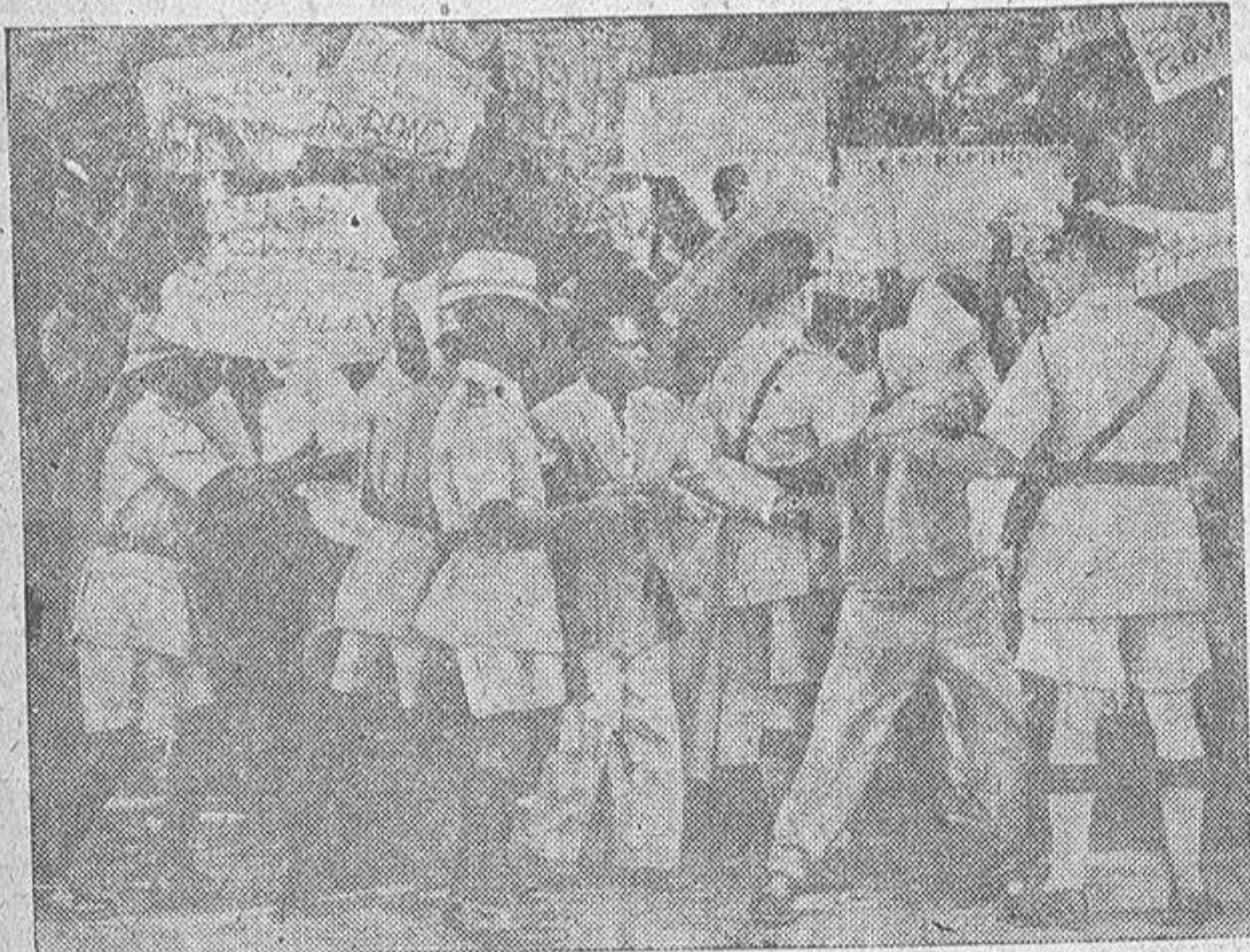
El viaje del Primer Ministro británico por los Estados sudfricanos no ha sido tan triunfal como indicaban las crónicas publicadas por los periódicos londinenses. En Rodesia del Sur y Nyasalandia, sobre todo, grupos de manifestantes acogieron al "Premier" con gritos y pancartas reclamando la independencia. Aquí vemos a la Policía de esta última región formando cordones para contener a los revoltosos