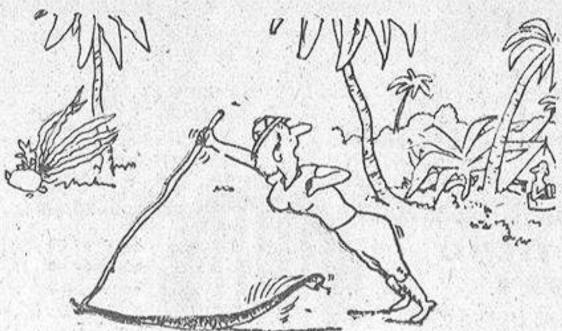
—¿Y, ahora, qué hago?