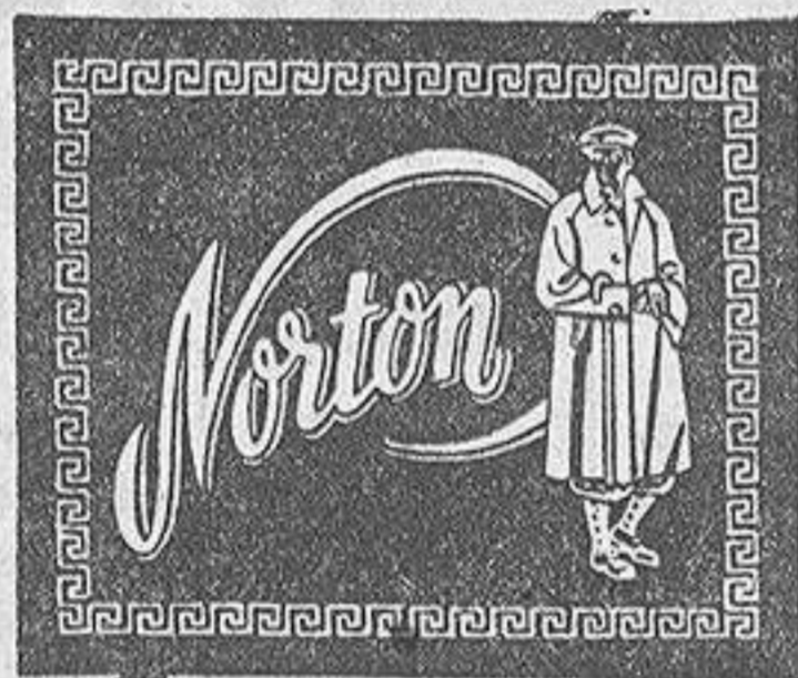
Sólidas — Garantizadas