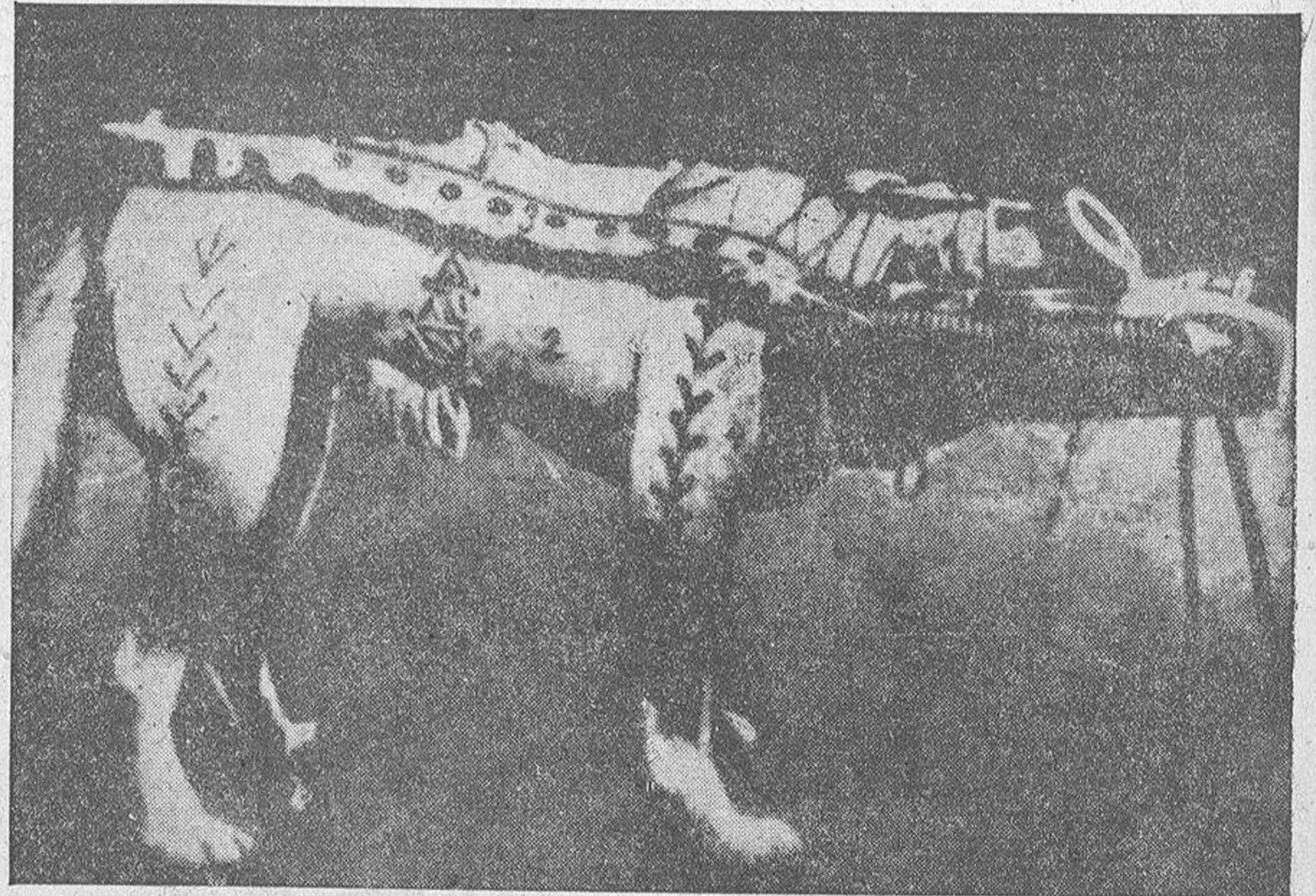
He aquí a la perrita "Laika", heroína de los espacios interplanetarios, completamente fajada para proteger sus arterias y con el biberón encargado de suministrarle oxígeno y alimentos. El envío del can soviético en el "Sputnik II" ha conmovido al mundo occidental. Después de ser recogidas sus reacciones en diversos centros científicos, "Laika" encontró la muerte al extinguirse el oxígeno que contenía el satélite