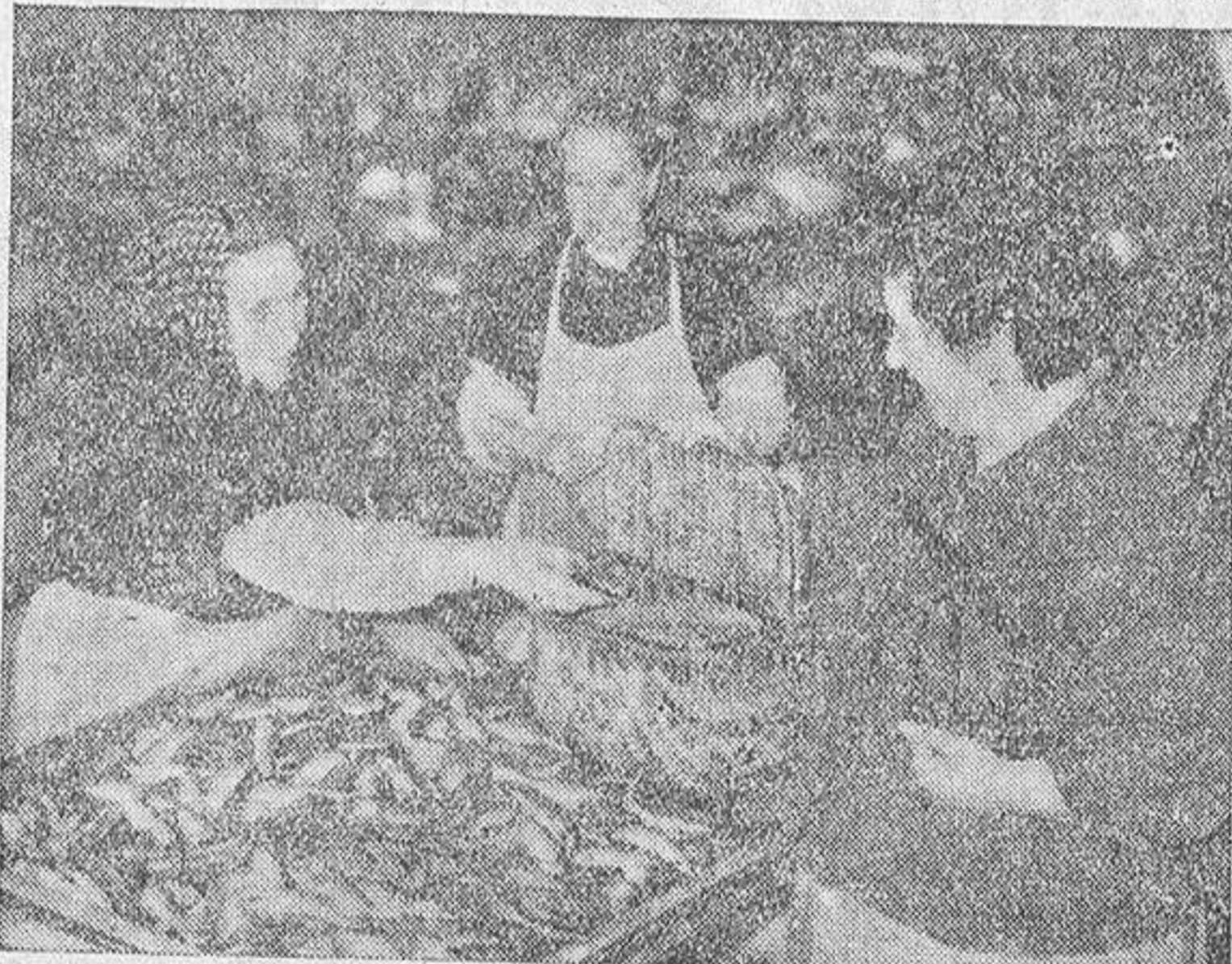
De la "patela" al cesto de la compra, un viaje propio de la sardina. Hace años esto se repetía constantemente. Ahora es más difícil, porque la sardina es artículo de lujo.

tata, cocida con la monda y comida sin ella. LA SARDINA COMO ELEMENTO HISTORICO Pero esa sardina cabezuda, lo mismo que la otra que tomamos en con-