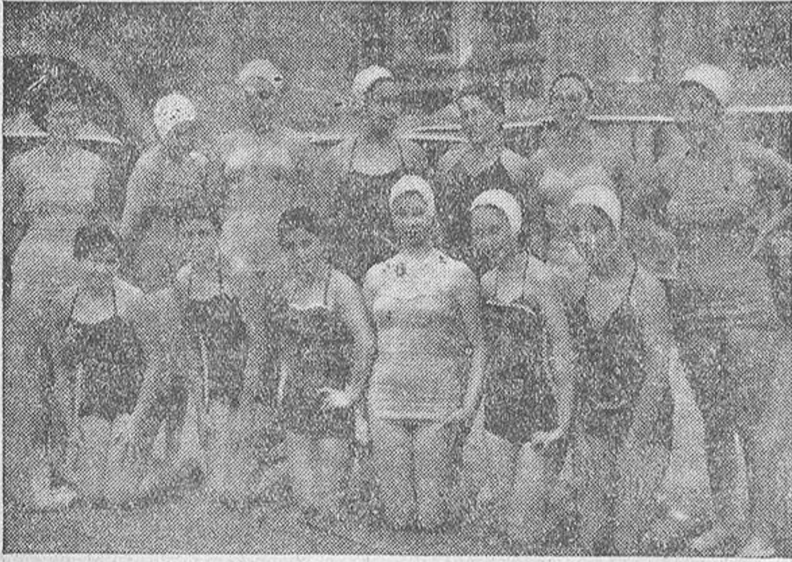
Estas son las jóvenes coruñesas que integran el primer «ballet» acuático de nuestra ciudad. Enhorabuena, rapazas!