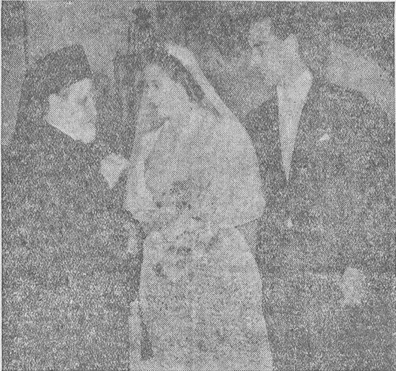
En el castiello de Salem, a quince kilómetros del lago de Constanza, se acaba de efectuar la boda de la Princesa Margarita, hija del Margrave Berthold de Baden, con el Príncipe Aomislav de Yugoslavia. La cere- se celebró con arreglo al rito ortodoxo, y a ella asistieron más de quinientos representantes de la realeza europea, entre los que figuraba el Príncipe Felipe de Edimburgo.