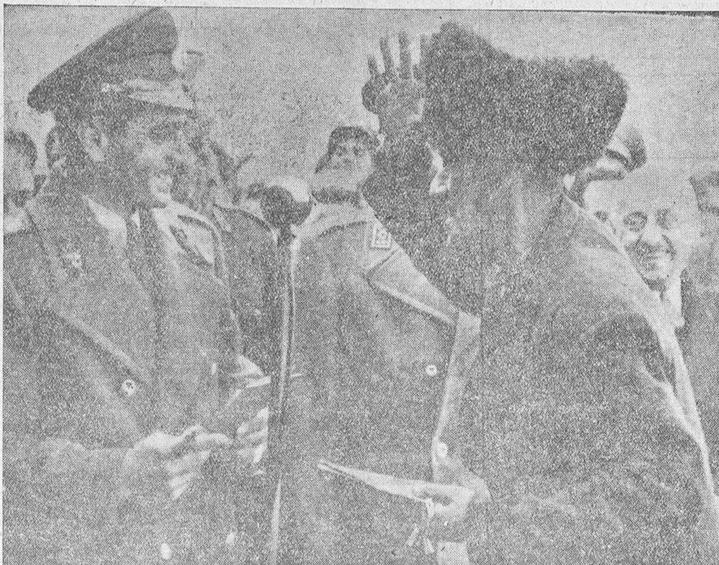
Desde el comienzo de su reinado, el Sha de Persia se dedica a repartir sus tierras entre los necesitados del país. Aquí aparece recibiendo las expresiones de gratitud de un campesino que figuró entre los últimos beneficiarios en la distribución de los bienes de la familia imperial.