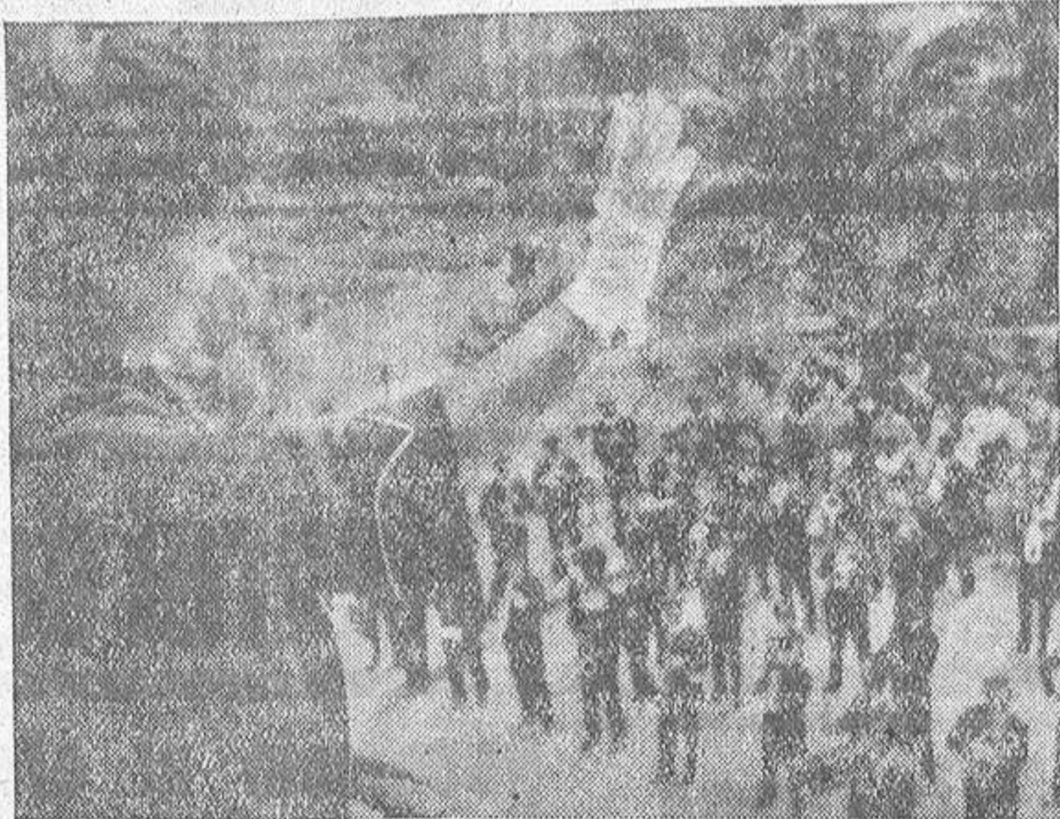
Gina Lollobrigida aguarda en la ensoñadora isla napolitana de Ischia su próxima maternidad, que probablemente ocurrirá en julio. Tan pronto suceda el feliz acontecimiento, reanudará su carrera artística con la interpretación del principal papel femenino de la película "Venus Imperial", en la que encará la figura turbulenta de Paulina Bonaparte. En la foto, la famosa actriz saluda desde la terraza de su hotel a los componentes de la fanfarria que acudieron a ofrecerle un concierto