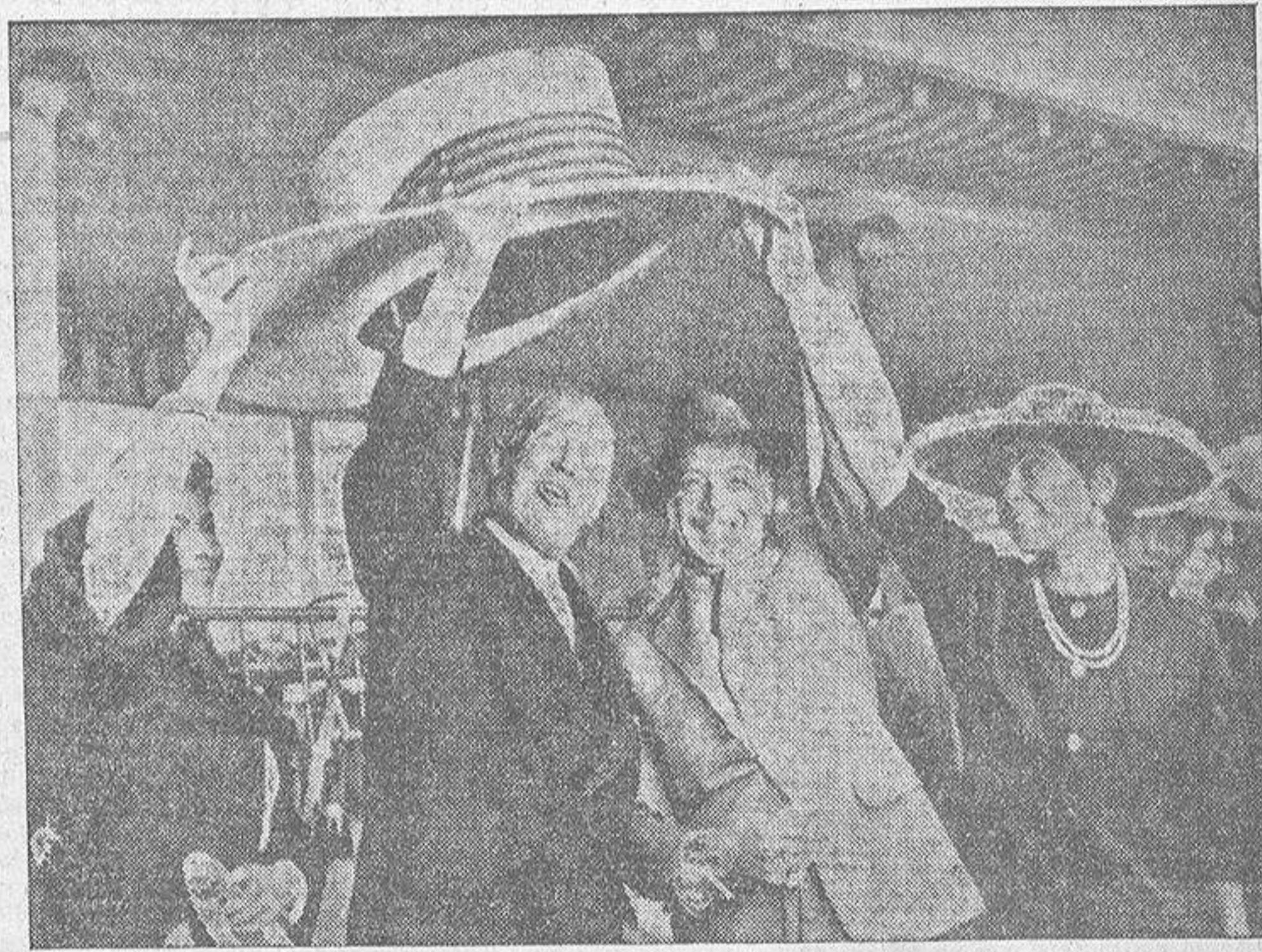
Maurice Chevalier y Fernand Gravey muestran el sombrero que los industriales franceses confeccionaron para exhibirlo al comienzo de una campaña que han iniciado en el país para la vuelta al uso del sombrero de paja. No sabemos si lograrán su objeto. Lo que sí podemos asegurar es que de ese tamaño venderán pocos.