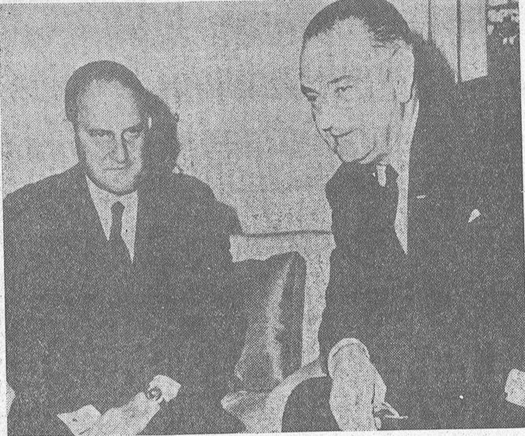
El ministro español de Asuntos Exteriores, Fernando Maria Castiella, durante su entrevista con el Presidente de Estados Unidos, Lyndon B. Johnson...