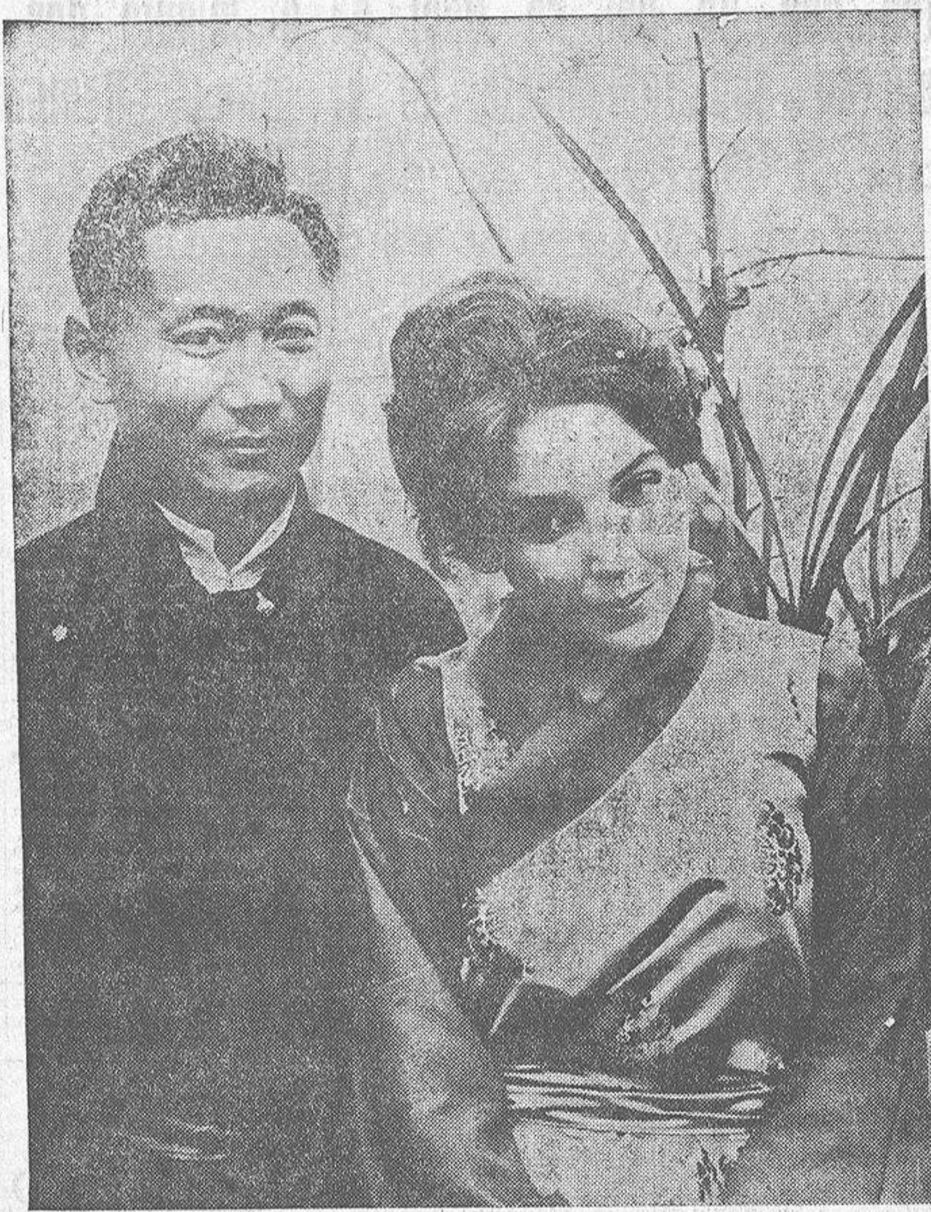
El Rey de Sikkin, "esposo de los dioses", Palden Tundup Mangial, y su bonita esposa, la estudiante americana Hope Cooke, con la que se casó hace tres años.

Desde aquellos ataques chinos a las fronteras de la India y el Tibet ocupado por los chinos, el Gobierno de Nueva Delhi ha hecho grandes inversiones en el re-