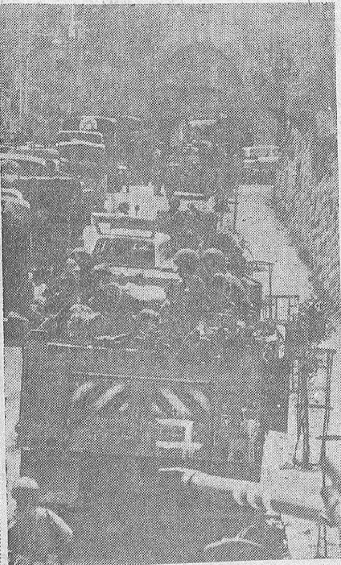
El Estado de Israel ha decidido anexionarse, con carácter definitivo, la parte vieja de Jerusalén. La decisión ha suscitado fuertes críticas y se considera que dificultan extraordinariamente un arreglo pacífico del problema de Oriente Medio. En la zona de Jerusalén que con anterioridad pertenecía a Jordania, los israelitas han concentrado ahora importantes contingentes de tropas