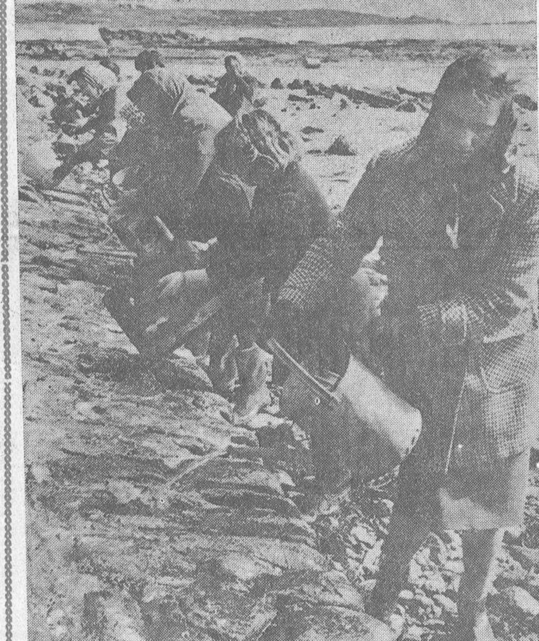
Después de varias semanas, la "marea negra" todavía inquieta a varios países ribereños. En el Consejo de Ministros celebrado el viernes pasado, el señor Fraga Iribarne subrayaba la perfecta colaboración hispano-francesa en lo que al asunto se refiere. En los últimos días se dijo que los vientos empujaban de nuevo la masa de combustible hacia las costas galas. Varios buques se aproximaron a ella para lanzar toneladas de productos destinados a fundirla. Con ello trataban de evitar escenas como las que recoge la foto, en la que vemos a un grupo de mujeres inglesas voluntarias arrojando materias disolventes en una playa invadida por los crudos procedentes del "Torrey Canyon". La alarma ha vuelto a cundir en los sectores costeros, y en los puertos se acumulan los productos químicos destinados a la acción destructiva contra el petróleo

Del mensaje de Pablo VI se subrayan los conceptos de paz para los pueblos y unidad para la Iglesia