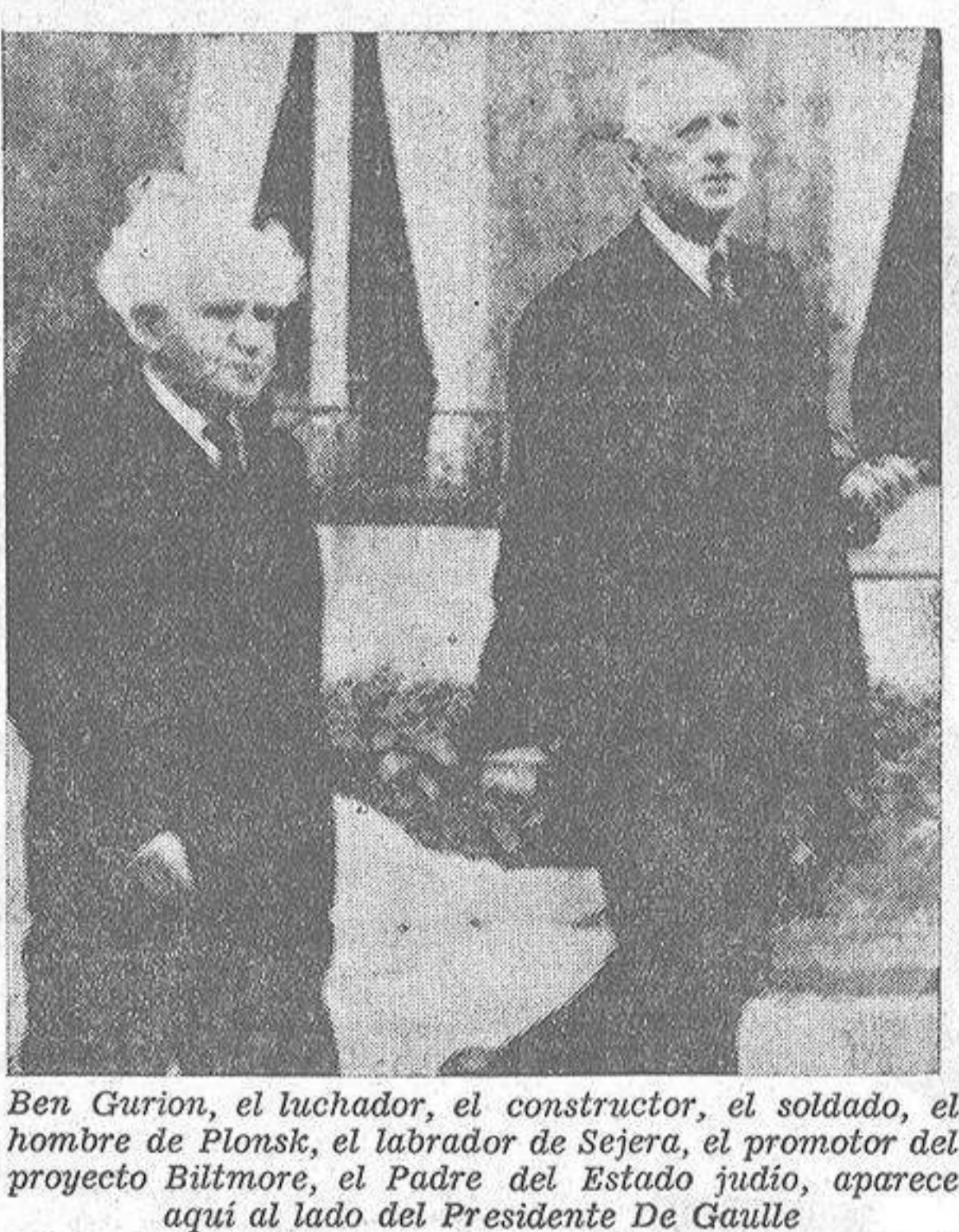
Ben Gurion, el luchador, el constructor, el soldado, el hombre de Pionik, el labrador de Sejera, el promotor del proyecto Biltmore, el Padre del Estado judío, aparece aquí al lado del Presidente De Gaulle