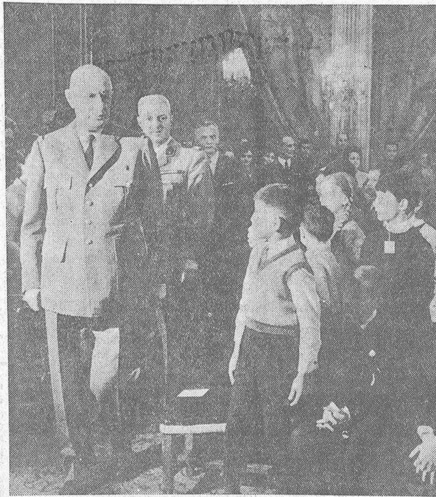
El Presidente De Gaulle y su esposa acaban de tener un bello gesto con cuatrocientos niños parisienses. En su honor montaron un gigantesco árbol de Navidad en uno de los grandes salones del Eliseo. Los niños asistentes al acto, muchos de ellos hijos de los empleados del Palacio y otros pertenecientes a varias escuelas parisienses, conocieron por primera vez personalmente al Presidente de la República y a su esposa. De Gaulle, casi siempre tan sereno, se emocionó en presencia de los pequeños, a los que repartió juguetes y golosinas. Puede asegurarse que estos cuatrocientos niños no olvidarán jamás la memorable jornada pasada al lado del Jeje del Estado, en el Palacio del Eliseo.