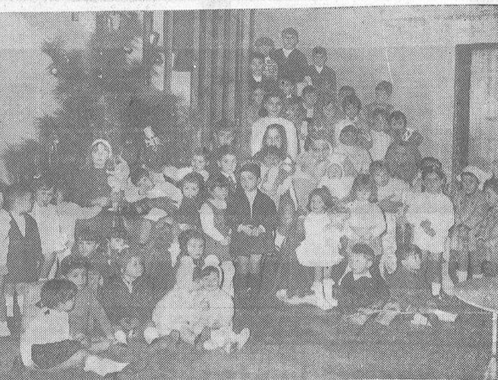
SS. MM. los Reyes Magos de Oriente, después de su recorrido nocturno por las casas coruñesas, el mismo día 6, por la mañana, estuvieron en diversos centros, en donde obsequiaron a numerosos niños. Y antes de regresar a su tierra, hicieron una parada en la fábrica de "Coca-Cola", de "Begano S. A.". Allí departieron durante largo rato con los hijos de todo el personal de la factoría, hicieron las delicias de la chillería, entre pasmada y emocionada, y entregaron a los pequeñuelos numerosos juguetes. En la fotografía Melchor, Gaspar y Baltasar posan con un grupo de niños, que gozaron de lo lindo con los obsequios recibidos.