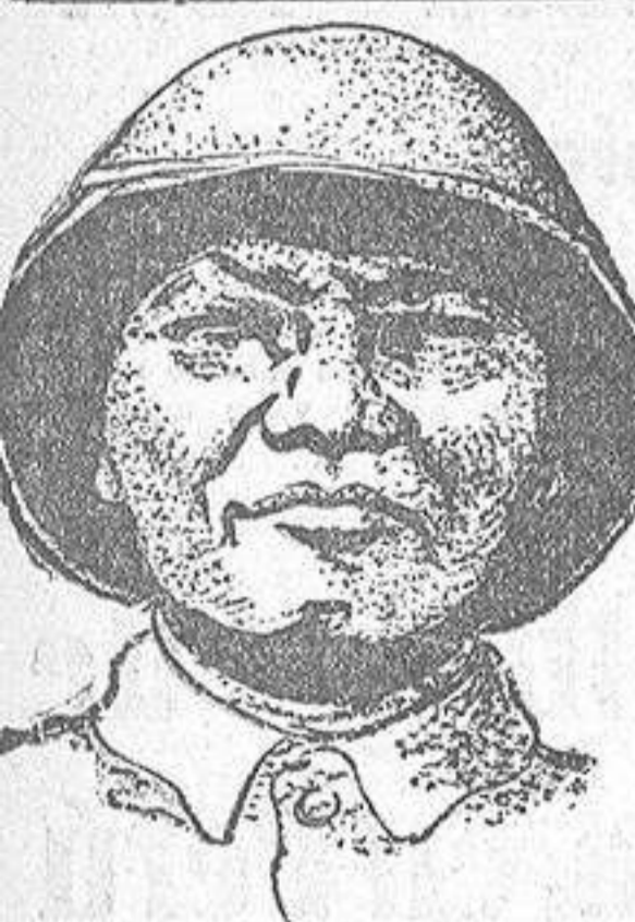
CHINA asiste en estos momentos a una profunda renovación política. Hasta ahora han sido depurados algunos de los antiguos colaboradores de Mao Tse Tung, y hace unos días el propio Presidente de la República, Liu Shao Chi, se retractaba públicamente de "sus errores". En su autoacusación dijo que no había concedido la importancia necesaria a la "Revolución Cultural" y que tampoco había movilizado convenientemente a la población para que se hiciera eco de ella. Se cree que esta confesión la hizo ante cien mil "guardias rojos", precisamente los encargados de llevar a cabo el programa revolucionario. La glorificación de Mao alcanza en estos momentos su fase culminante. Cualquier desviación de su doctrina es objeto de las más acérrimas censuras. Y el dirigente comunista — los que actúan en su nombre — se muestra de un nacionalismo exacerbado. Fiel a las consignas de Lin Biao, Ministro de Defensa y probable sucesor de Mao, las juventudes chinas vienen comiendo las mayores iras. Todo lo que suena a extranjero es borrado rápidamente de la población. Y la xenofobia llega a tales límites que sus salpicaduras alcanzan a figuras del arte clásico. El término de la "Revolución Cultural" trata de centrarse en el supuesto "aburguesamiento" existente en las Universidades. Los catedráticos parece que alejaban una formación humanística y que pretendían premiar a los alumnos aventajados. Querían prescindir de favoritismos políticos y esto es lo que ha irritado al Gobierno. Al mismo tiempo, algún sector del profesorado se permitió elogiar el progreso técnico conseguido por Norteamérica y por la Unión Soviética. Nada más ser conocidas sus manifestaciones encendieron la indignación de Lin Biao, que lanzó a los "guardias rojos" contra los centros universitarios y contra otros sectores que rechazaban una xenofobia indiscriminada. A partir de aquel momento, se sucedieron las destituciones de profesores — entre ellas, la del rector de la Universidad de Pekín — y los críticos de "Diario del Fuego" contra los "elementos burgueses" y contra la "camarilla del grupo anti-partido". Todo hace suponer, por otra parte, que nos encontramos en vísperas de una gran depuración política, de la que podrían resultar víctimas cuantos elementos no abrazan con verdadero entusiasmo los principios de la tan encarecida "Revolución Cultural".