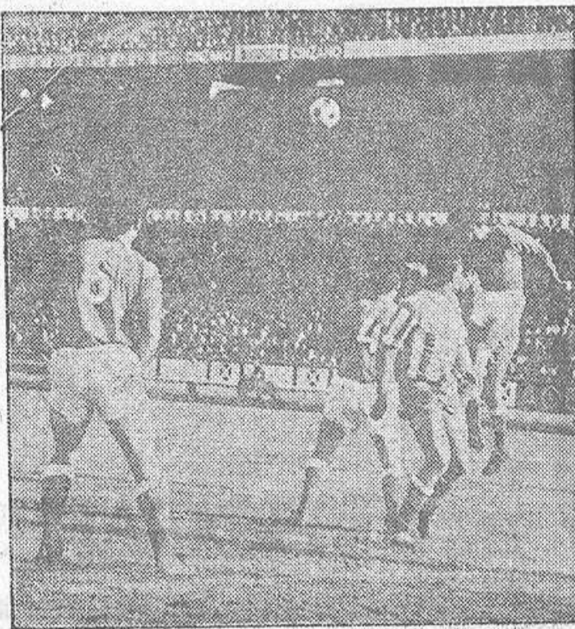
Las líneas ovietenses de cobertura se mostraron muy trabajadoras toda la tarde. Aquí vemos la decisiva intervención de los defensores asturianos.