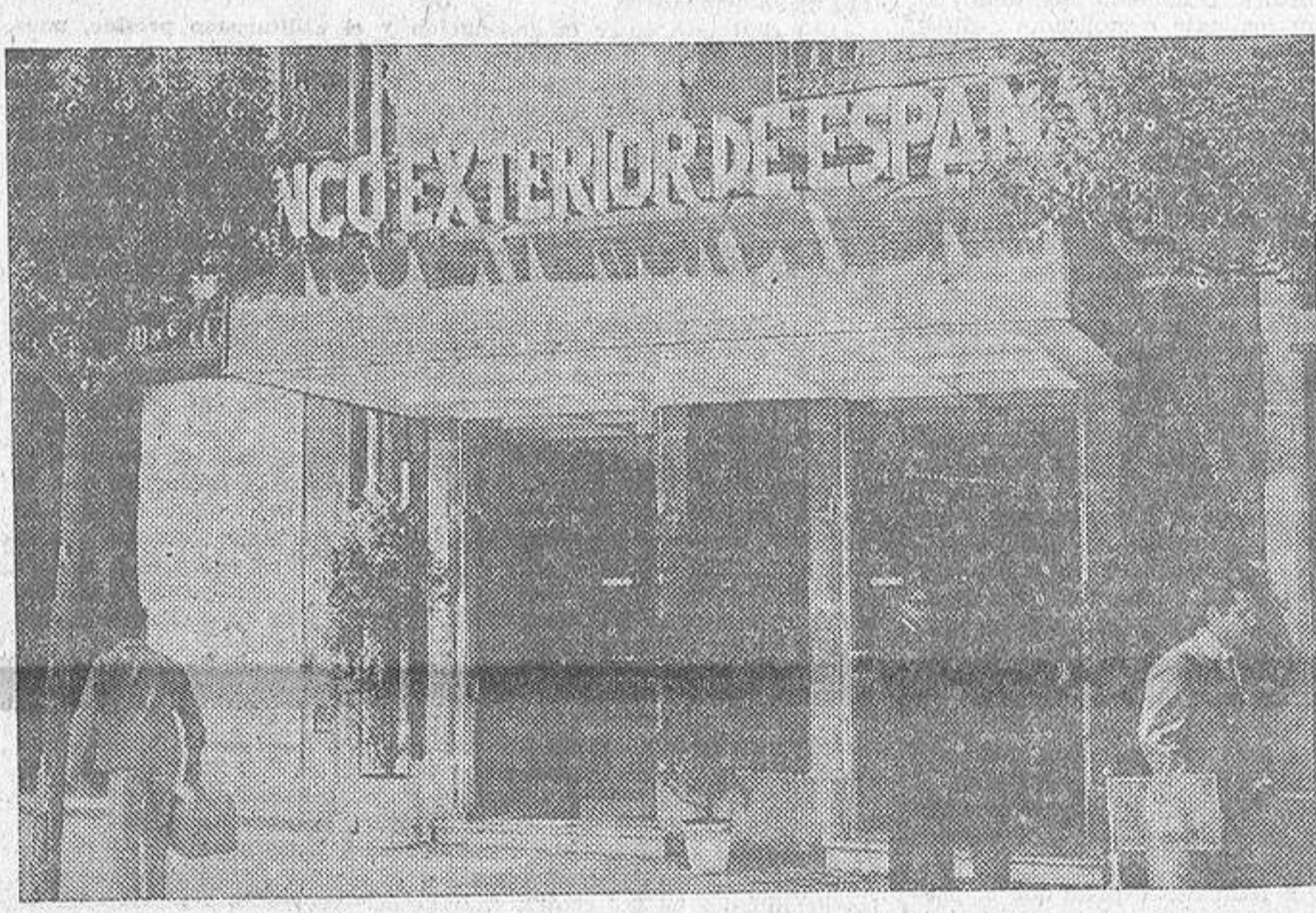
Aspecto exterior de la nueva sucursal del Banco Exterior de España en La Coruña

Desde el miércoles último, La Coruña cuenta con una entidad bancaria más, aunque, en realidad, sería más apropiado decir que dispone de una sucursal nueva de un organismo que, como el Banco Exterior de España tan intensamente, como fin primordial de todas sus actividades, y objetivo para el que fue creado se preocupa del impulso de nuestro comercio exterior, desarrollándolo y atendiendo minuciosamente a todos los complejos problemas que plantea cada día, especialmente en lo que al ramo de las exportaciones se refiere.