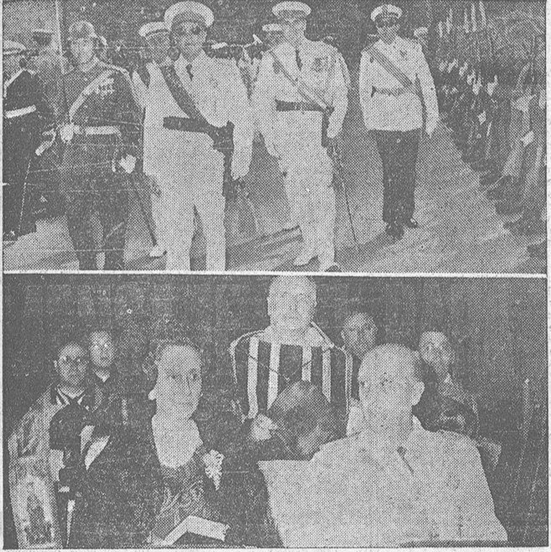
Arriba: Su Excelencia el Jefe del Estado, a su llegada a la Plaza de España de Santiago, para revista a la compañía que le rindió honores; abajo: el Caudillo y su ilustre esposa durante la ceremonia celebrada ayer en la Basílica compostelana.

Fué presentada por el Caudillo, que también leyó la invocación