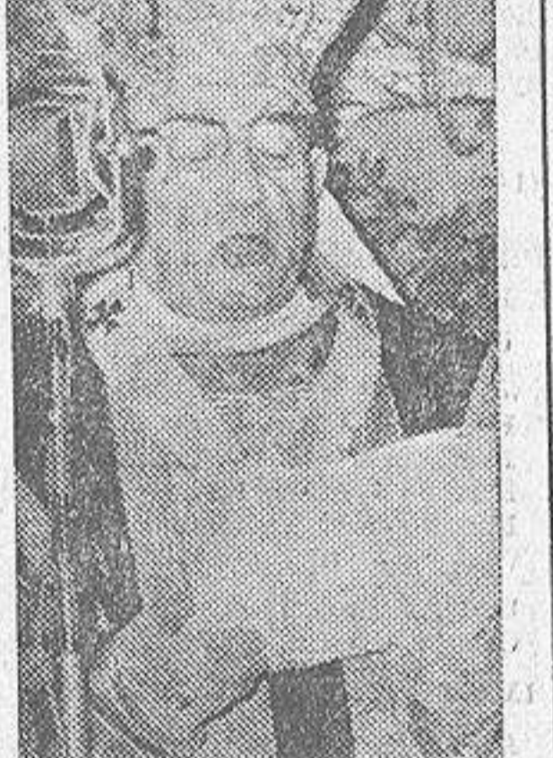
El cardenal Quiroga Palacios contesta a la invocación del Generalísimo.

SANTIAGO, 25.—En su contestación al ofertorio, el Cardenal Quiroga Palacios se expresó en los siguientes términos: «Excelencia: Cada uno de los días de este esplendoroso Año Santo trae consigo para los que tenemos la dicha de vivirlo tan de cerca un gozo nuevo.