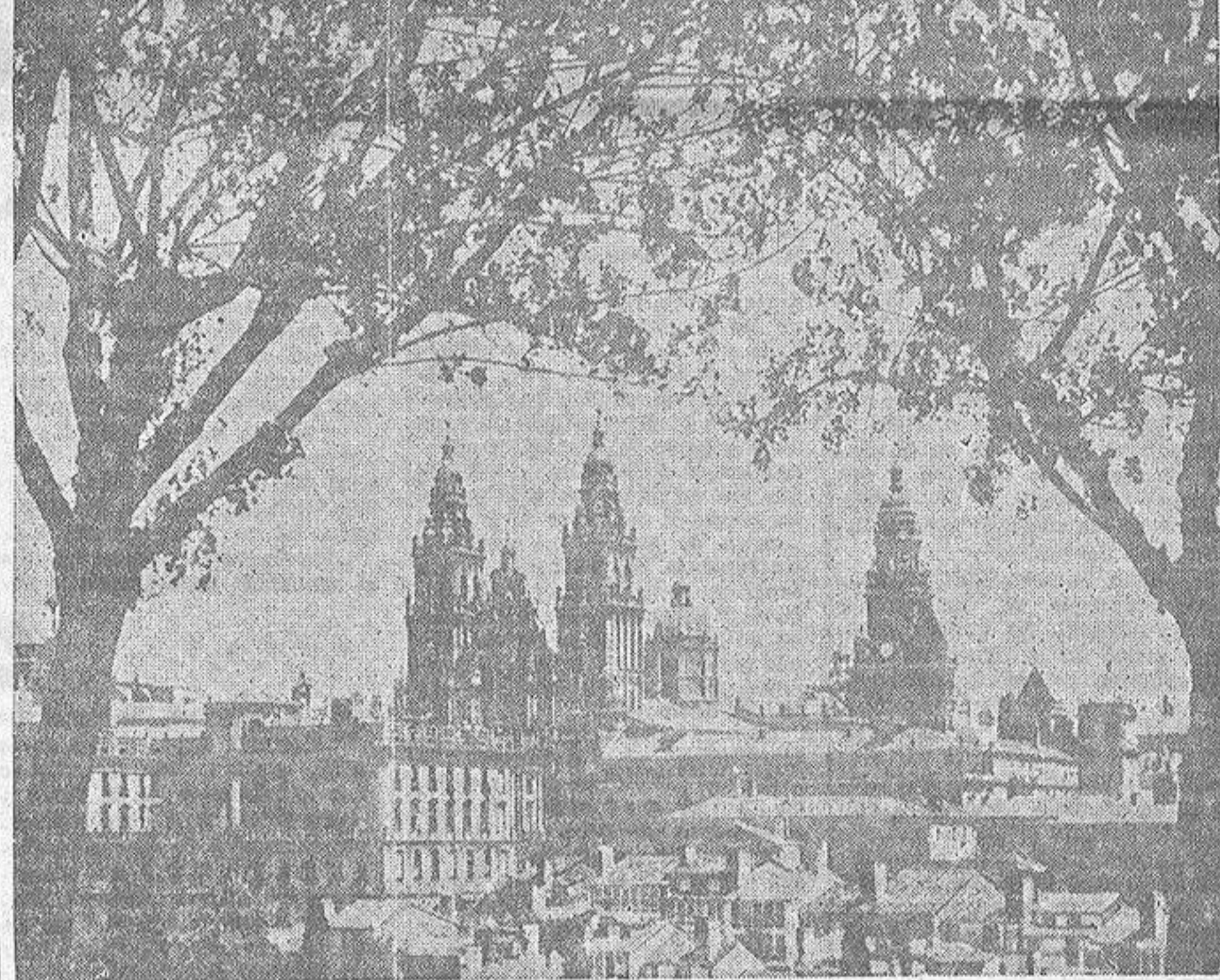
Vista panorámica de Santiago de Compostela, desde el Paseo de los Leones, en la Herradura.

Si la categoría se la imprimió la solemnidad del 25 de Julio, la anécdota queda a cargo de múltiples incidencias. Señalemos, sin ir más lejos, que durante todo el día de ayer, en el Pórtico de la Gloria, los peregrinos formaron fila y metieron sus dedos en las oquedades de la columna, para terminar con el tradicional "croque" sobre la pétrea testa del Maestro Mateo. Las naves y ábsides románicas quedaron impregnadas de olor a incienso cuando el "botafumeiro", en su movimiento pendular, atraía las miradas de los millares de fieles que aborrotaban la centenaria basílica y por las calles estrechas, era imposible dar un paso. A pesar de "haberse quedado sola Fonseca" y los demás centros universitarios, que descansan de pasados meses de trabajo y estudio, ningún rincón compostelano ha acusado la soledad y el sosiego. En San Martín Pinario, en la Alameda, a lo largo de las calles de Huérfanas, Calderería, Preguntoiro y Algalias, en el Torral y la Rúa del Villar, en la