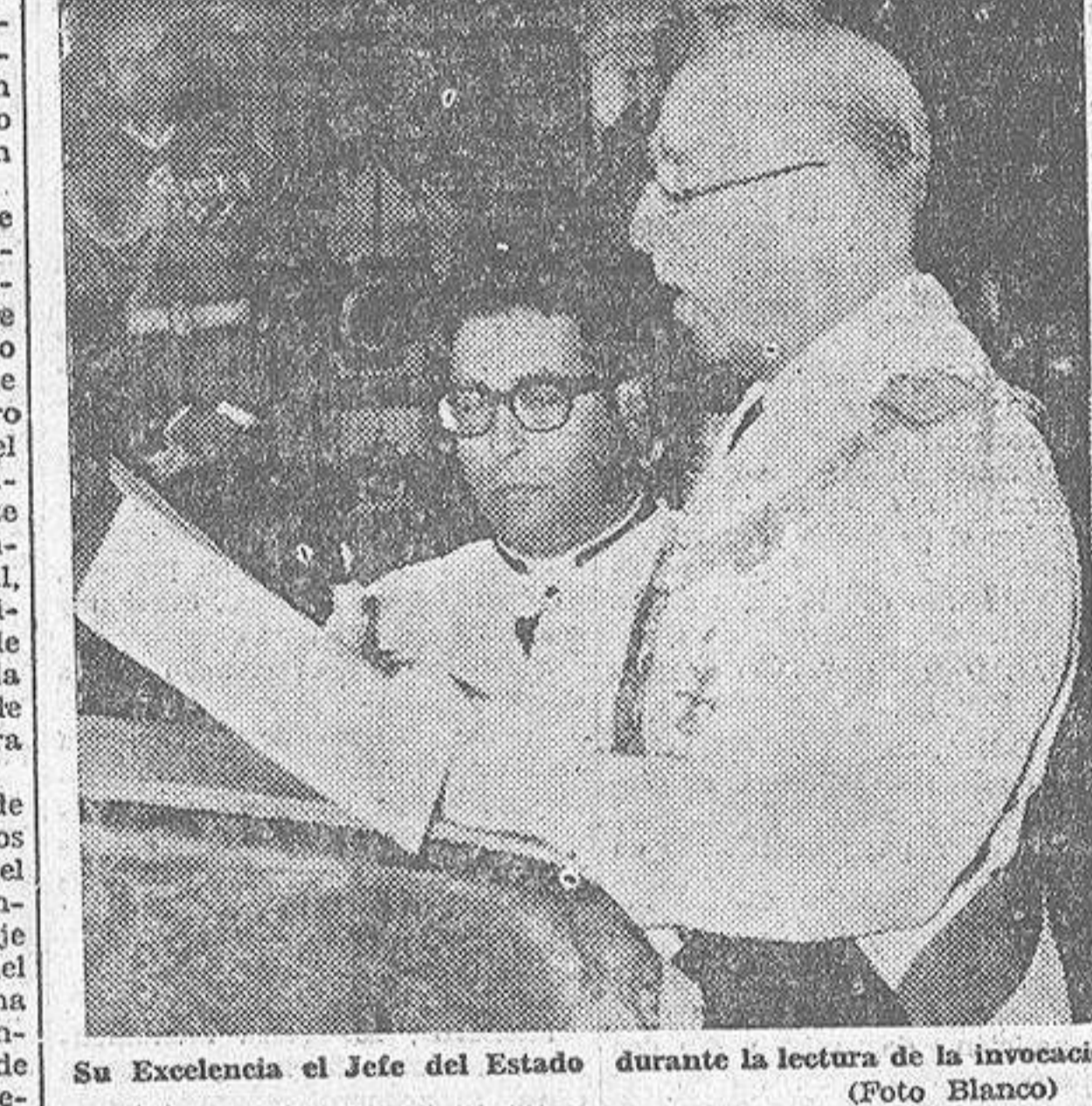
Su Excelencia el Jefe del Estado durante la lectura de la invocación

«QUE EL SEÑOR NOS CONCEDA LA CREACION EN NUESTRA PATRIA DE UN ORDEN DE CONVIVENCIA CADA DIA MAS JUSTO, EN PAZ Y EN TRABAJO»