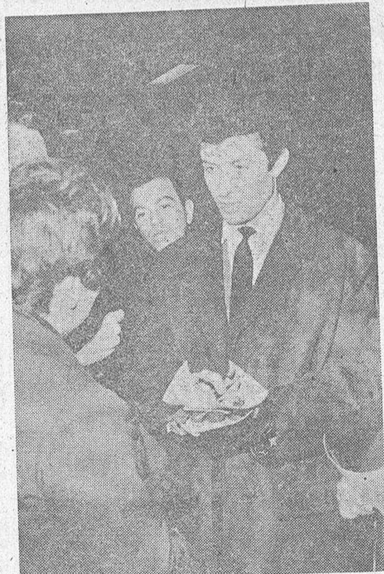
Georges Chakiris, el inigualable intérprete de "West Side Story", firmando autógrafos a su paso por Madrid.

En la Escuela de Cine de la Uni- versidad de California, he visto películas realizadas por jóvenes. Son interesantes y hasta apasio- nantes. Pero les es difícil encon- trar "hueco" --los que están ya situados, les cierran el paso. Hay ayudantes de dirección que tra- bajan en ese puesto desde hace quince años. Los productores qui- sieran reemplazarlos por los jóve- nes, pero se oponen los síndica- tos.