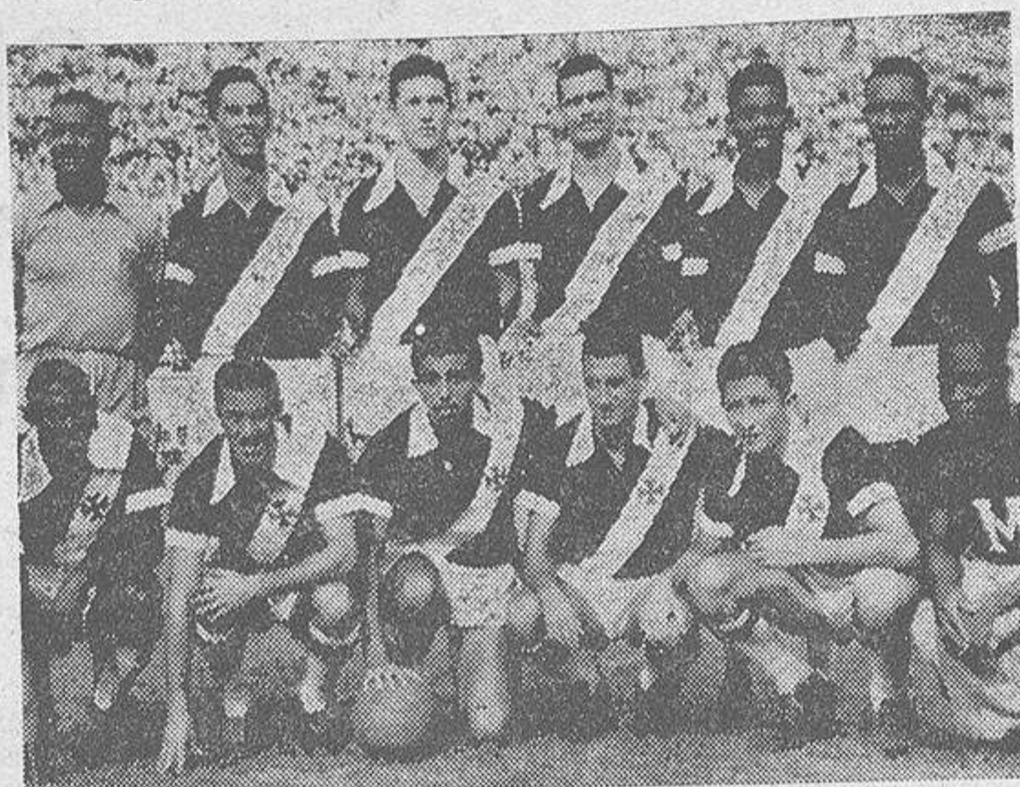
Siempre que se habla del "Teresa Herrera" hay que recordar al gran equipo del Vasco de Gama, que con sus actuaciones escribió bellas páginas del gran torneo futbolístico. Este año serán Real Madrid, Dukla, Fluminense y Feyenoord los clubs participantes. Cuatro extraordinarios representantes del mejor fútbol mundial del momento.

Los concejales señores Navarro, Estévez y Suevos, acompañados del secretario de la Agrupación Provincial de Periodistas De-