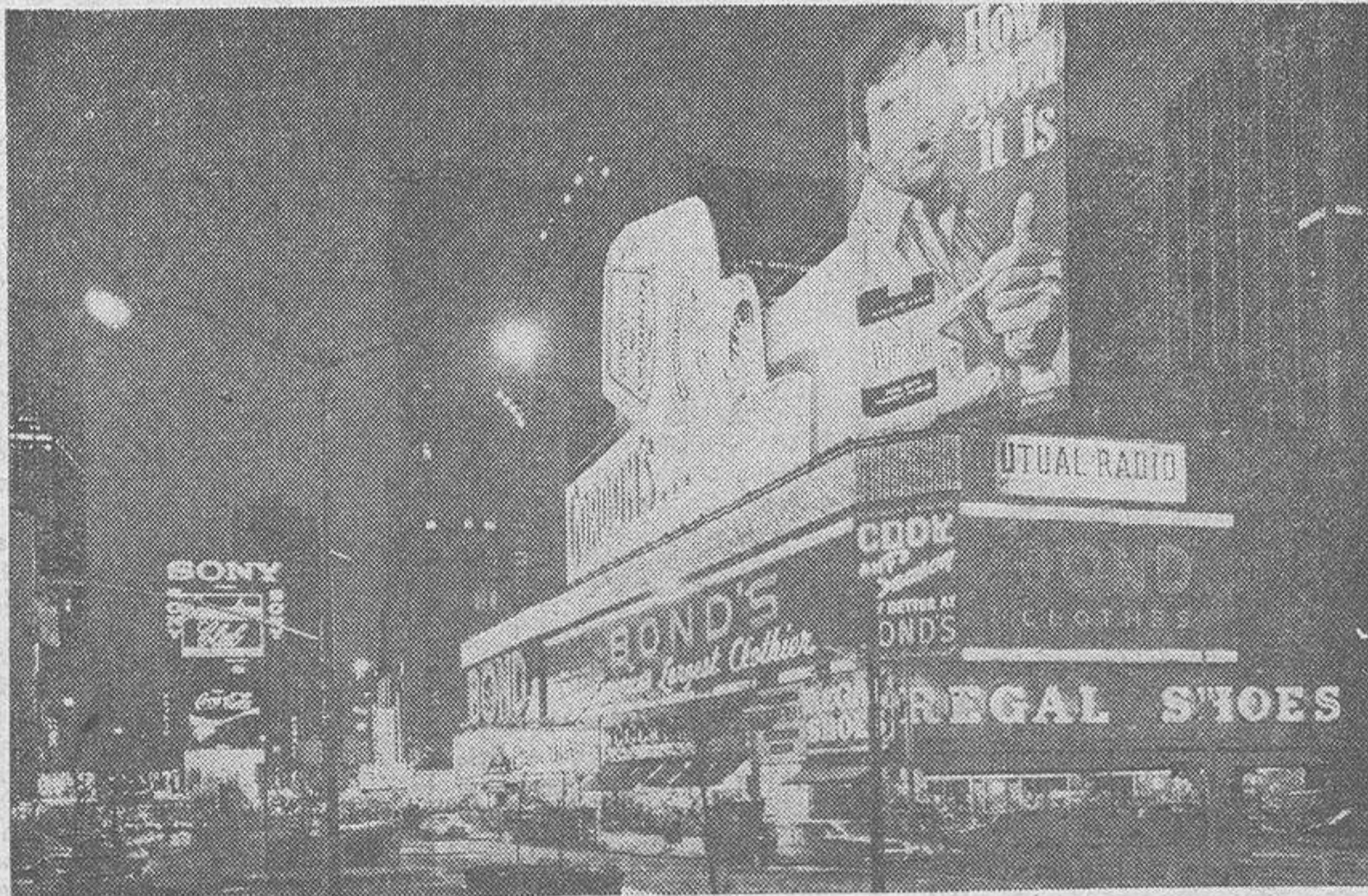
Perspectiva de "Times Square", corazón de Broadway, donde se exhiben los más famosos espectáculos del mundo. Le pasa algo semejante que a Pigalle: hay que visitarla de noche, cuando los letreros luminosos de sus cines, teatros y salas de fiesta presenta un aspecto fascinante

comen los neoyorquinos al cabo del día. A cualquier hora que se visite un "drugstore" —tienda mixta que contiene farmacia, estanco, venta de periódicos y restaurante— aparece gente sentada en torno de sus barras. Se trata de establecimientos que permanecen abiertos las veinticuatro horas de la