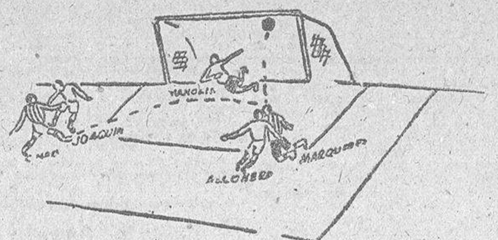
DEPORTIVO 1 -- SEVILLA 0