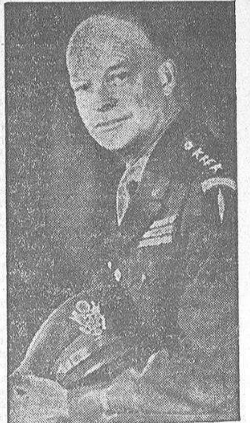
D. G. EISENHOWER

NUEVA YORK, 14.—El Presidente electo, Eisenhower, llegó a Nueva York a las ocho de la noche (hora española). Ha efectuado el viaje en avión. Con ello se da por terminado su viaje a Corea, que prometió en la última fase de su campaña electoral.—(EFE).