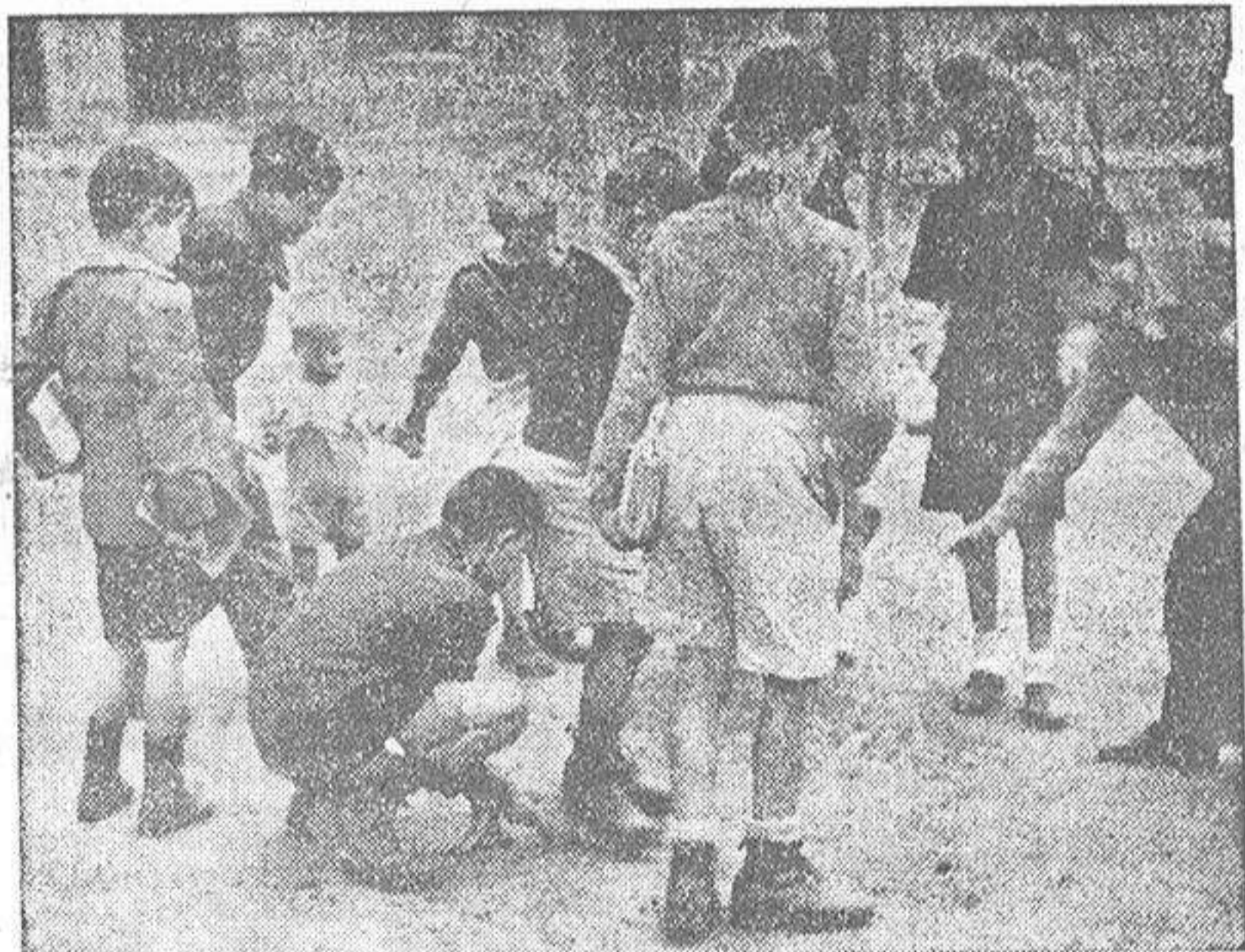
A los que les espera su casa, después de salir de clase, no les falta un rato de esparcimiento callejero. Y mientras unos juegan, otros miran; entre éstos, algunos de esos niños que han "latado", o algunos de esos otros que no van a la escuela.

Uno de los niños, pequeñito, inicia la escritura de su nombre. Apenas si puede coger la pluma. Y lo escribe empezando por la letra final, en dirección contraria a la normal. Gracioso; pero se corregirá. Otro nos dice, satisfecho, que "ya va en el 32 de dividir"; tiene cara de inteligente y de estudioso. Seis niñas, en un banco aparte, atienden más a los movimientos del fotógrafo que a su formalidad en clase. Son preciosas, tímidas, acaso el abecedario les dé quebraderos de cabeza... Pero no serán en el futuro, sin duda, como aquella novia suplicante del "Escribidme una carta, señor cura", de que nos habla el poema de (CONTINUA EN SEPTIMA PLANA)