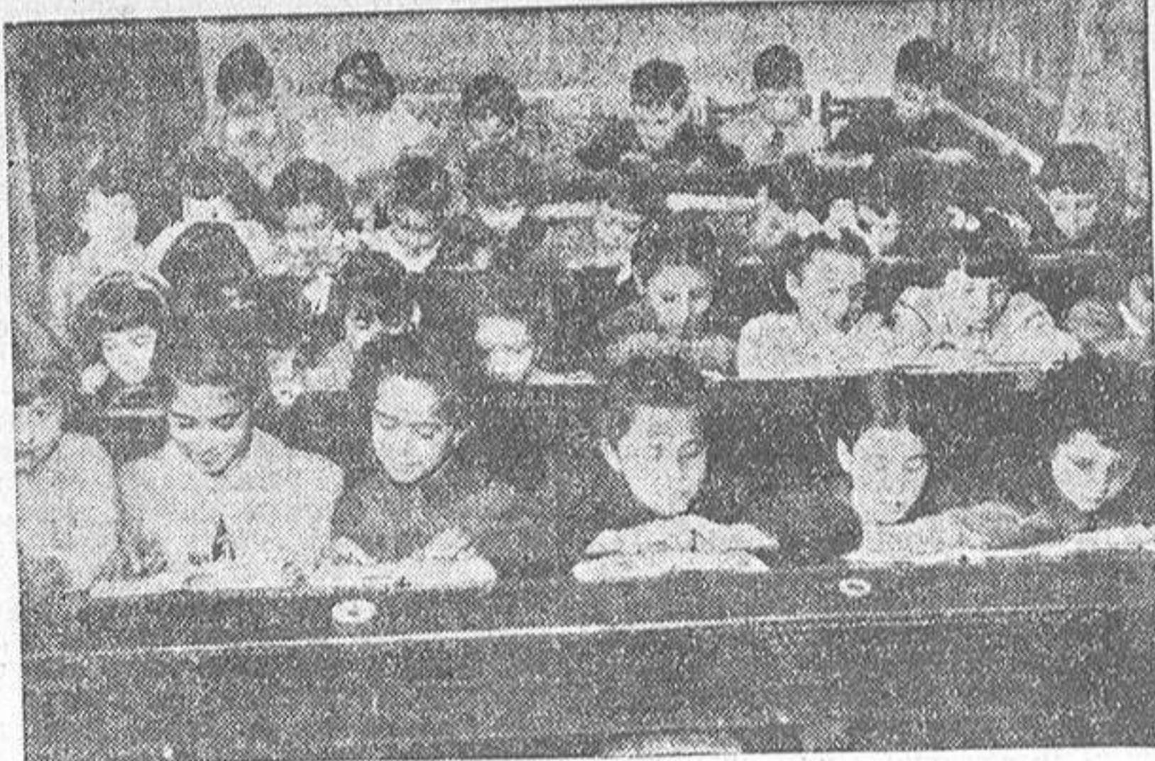
La hora de la clase. Estudiantes, afeitados en sus trabajos escolares, los niños coruñeses atesoran día a día esos principios culturales que les permitirán caminar más seguros por la vida. Aunque en algún que otro de estos rostros infantiles se percibe más la preocupación por salir bien en la fotografía que por atender, en este momento, a sus deberes...

de más de seis mil niños, pero es este un dato que en su día concretará el censo en elaboración.