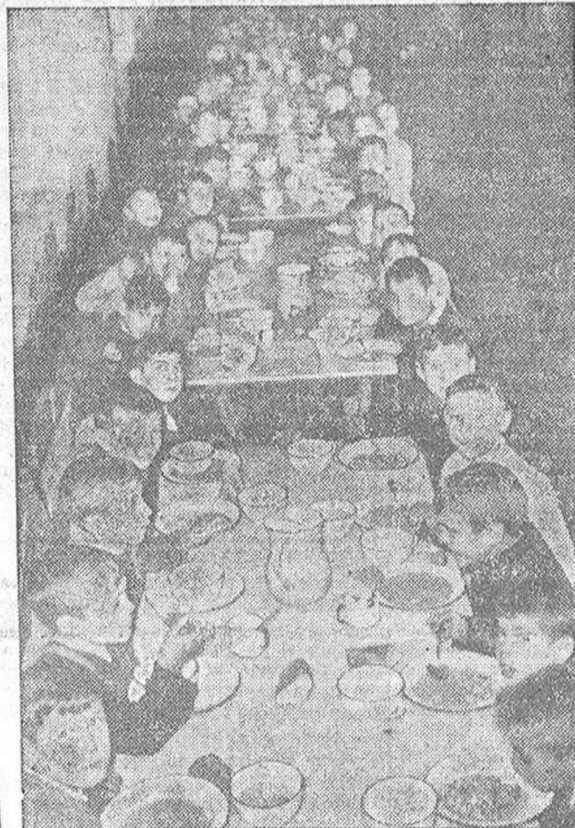
(Reportaje de Orestes Vara Calzada en octava plana)

La hora de la comida. Ha terminado la clase matinal: fuera abecedarios, multiplicaciones, sumas, divisiones, restas y dibujos. Hay que reponer energías; y los poetas toman la cosa con entusiasmo lógico y natural...