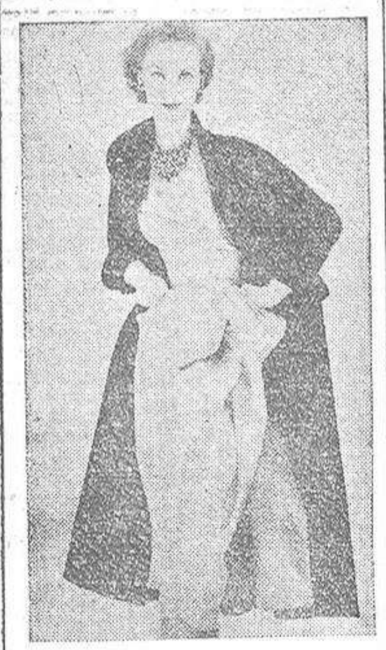
Modelo Chapman, última novedad en conjunto de abrigo y vestido, muy propio para tarde y noche, creación de gran fantasía.

Aconsejamos a nuestros clientes visiten diariamente las presentaciones que se hacen de 11 a 130 y de 4 a 6. Rogándoles que los encargos los aagan con un poco de amplitud, para la entrega de los que están señalados con anterioridad.