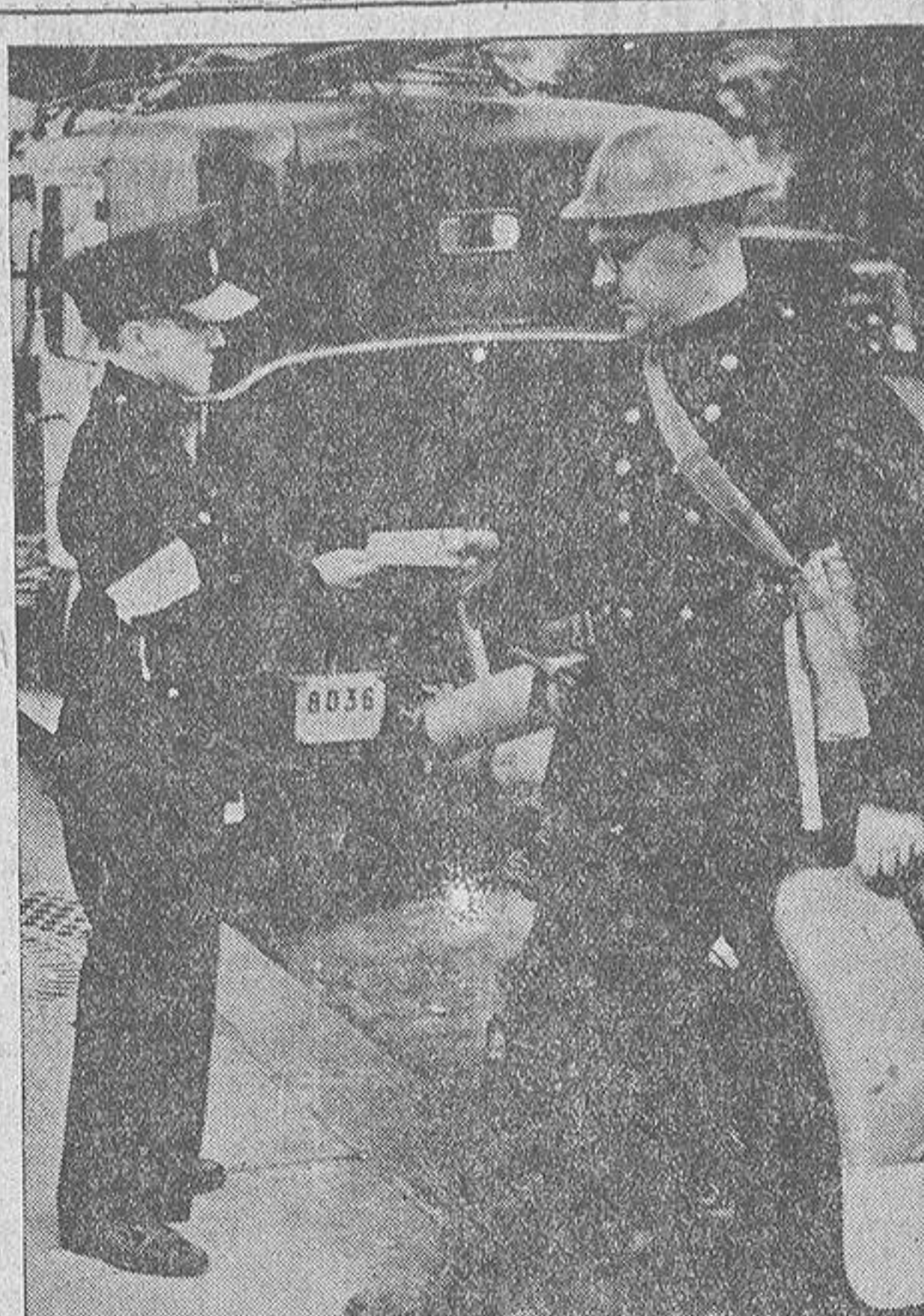
Con motivo del Conflicto bélico, se ha organizado en Inglaterra un servicio auxiliar contra incendios destinado a acudir a aquellos lugares en que puedan estallar bombas incendiarias. Dispone de pequeños coches de turismo dotados de los elementos indispensables para apagar los incendios de importancia reducida. He aquí uno de los miembros del servicio auxiliar de incendios de Londres, recibiendo el mensaje que uno de los jóvenes ordenanzas del Cuerpo le entrega

CONFIRMAN LA NOTICIA EN ANKARA Ankara, 1. — El ministro de Estado turco ha comenzado hoy las conversaciones con el Gobierno ruso, para llevar a cabo la misión que le ha sido encomendada. Se dice que el ministro, una vez terminada su misión, regresará directamente a Turquía, sin detenerse en Bucarest. LAS NEGOCIACIONES CAUSAN INTERES EN FRANCIA Ginebra, 1. — En los círculos políticos franceses se siguen con gran atención las negociaciones ruso-turcas. Se señala que en caso de lle-