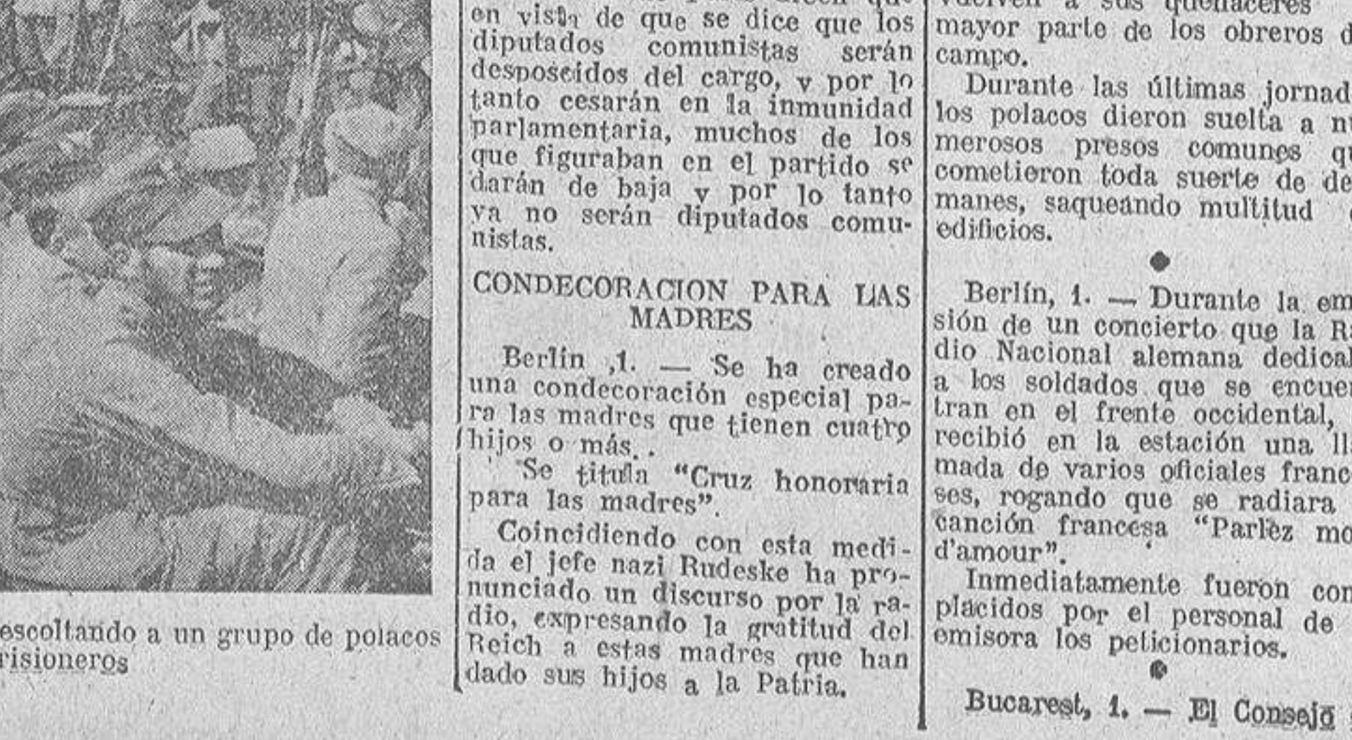
Soldados alemanes de Infantería escoltando a un grupo de polacos hechos prisioneros

COMPRE TODOS LOS LUNES LA "HOJA OFICIAL" DE