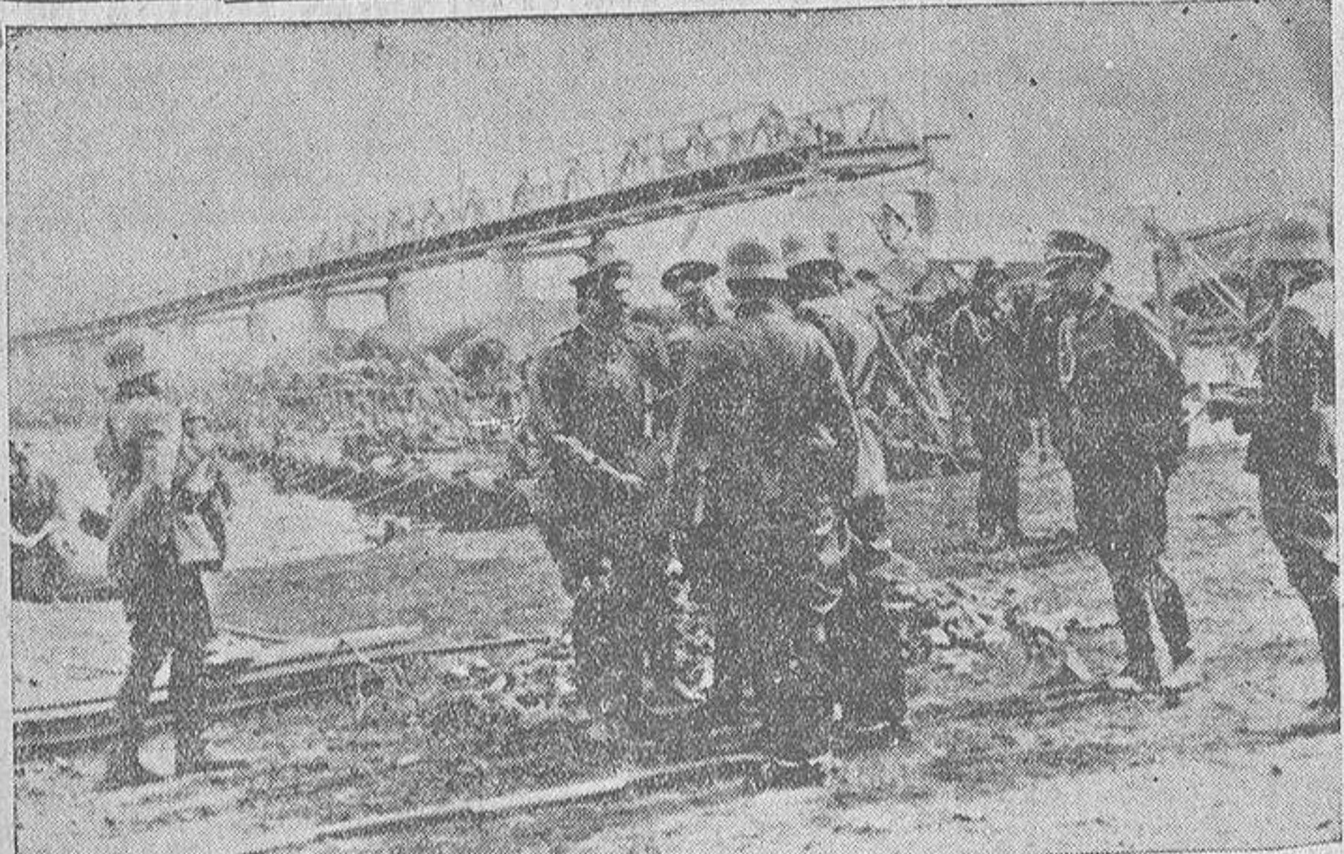
El Estado Mayor de una de las Divisiones alemanas que han operado sobre Polonia desde la Prusia Oriental dando órdenes para el avance de las tropas en la región del río Narw, que se ve en nuestra fotografía, con el puente de barcazas tendido por los pontoneros alemanes para sustituir al volado por los polacos

De este modo se da un paso adelante en la futura educación de las juventudes.