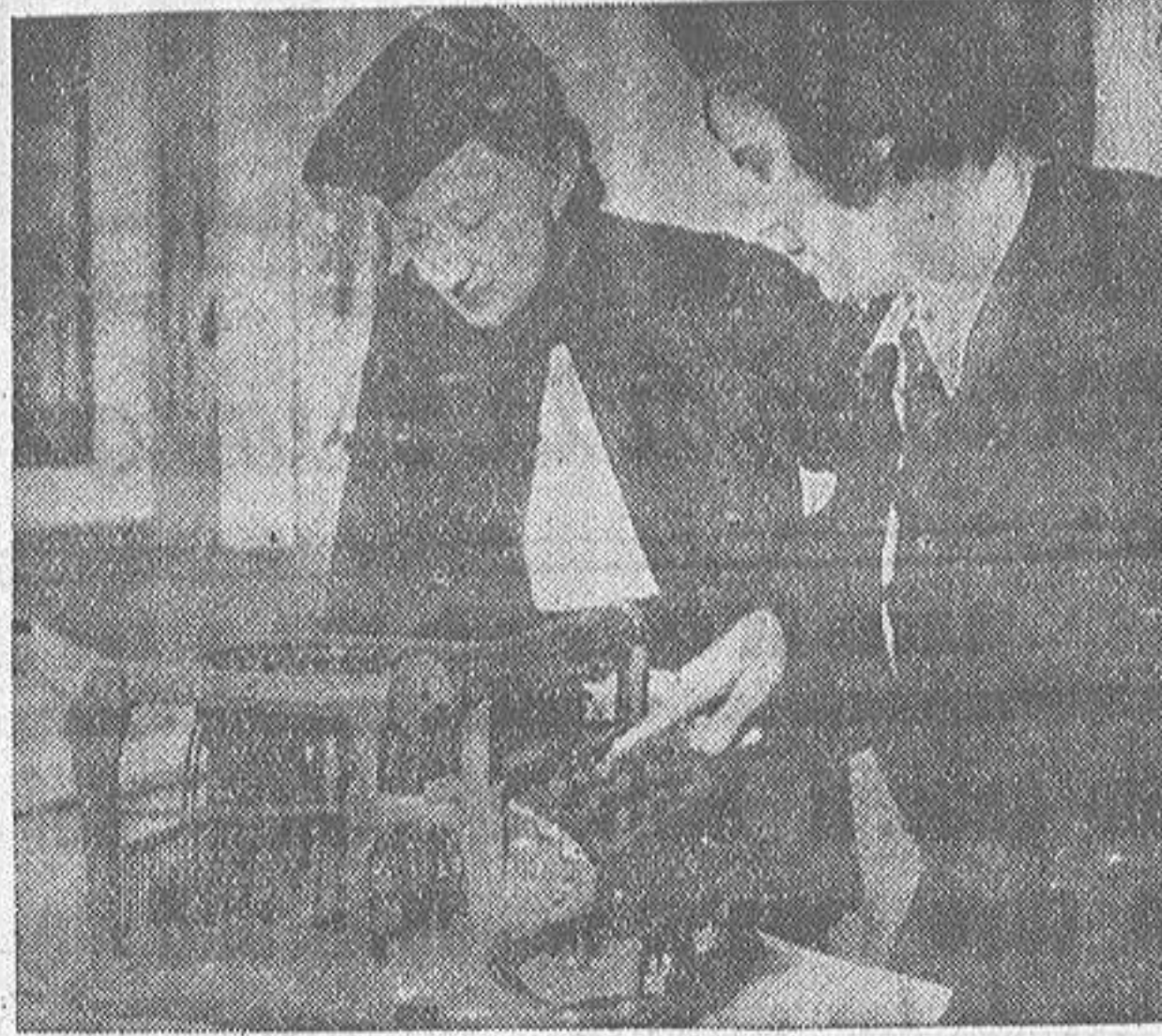
Máquina de escribir construída de madera en el año 1864 en Austria, que figura en la Exposición de las Montañas, recientemente inaugurada en Berlín

En Santa Bárbara La Octava Sacramental Celebróse ayer, domingo, en el convento de Santa Bárbara, la fiesta del Santísimo Sacramento. Hubo misa solemne, a las once de la mañana, y seguidamente se expuso S. D. M., que quedó a la pública adoración hasta los ejercicios de la tarde. Dieron comienzo éstos a las seis y media con asistencia de muchos fieles. El sermón estuvo a cargo de un reverendo padre dominico, y al final hubo procesión por el interior del templo, con el Santísimo.