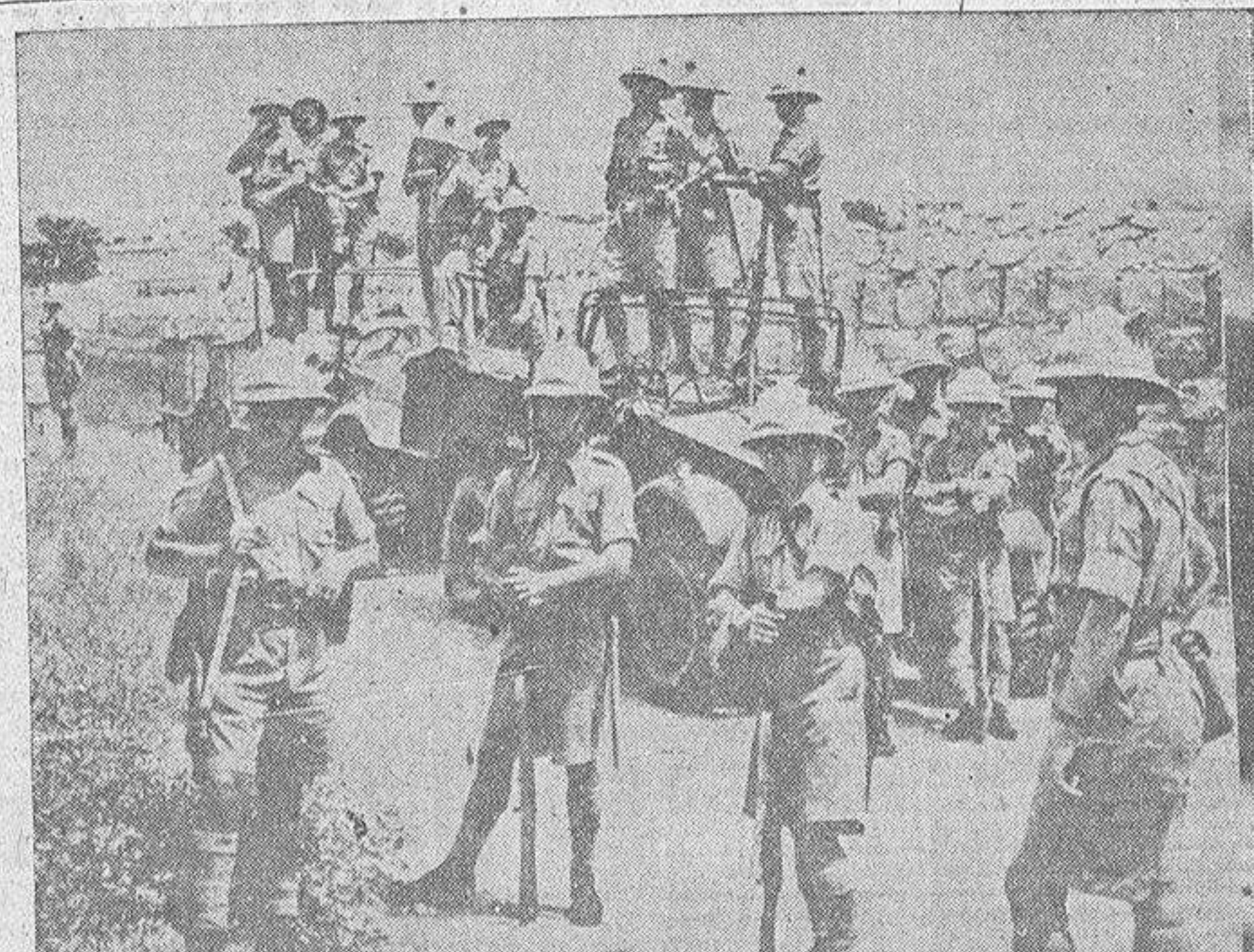
Los atentados se han recrudecido, con extraña violencia, resultando numerosas víctimas, tanto judías como árabes. Como consecuencia de ello, las tropas inglesas vigilan los alrededores de las ciudades, registrando a cuantos transeuntes discurren por las carreteras