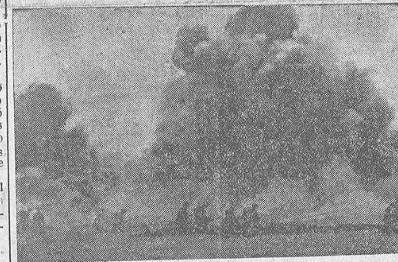
Maniobras militares que realizan los soldados polacos en las cercanías de la frontera con Alemania. Ejercicios con aparatos lanzas - llamas

Paris, 23. — La conferencia anglo-japonesa se celebrará mañana a las nueve. Será estudiado, detenidamente el memorándum aprobado el sábado.