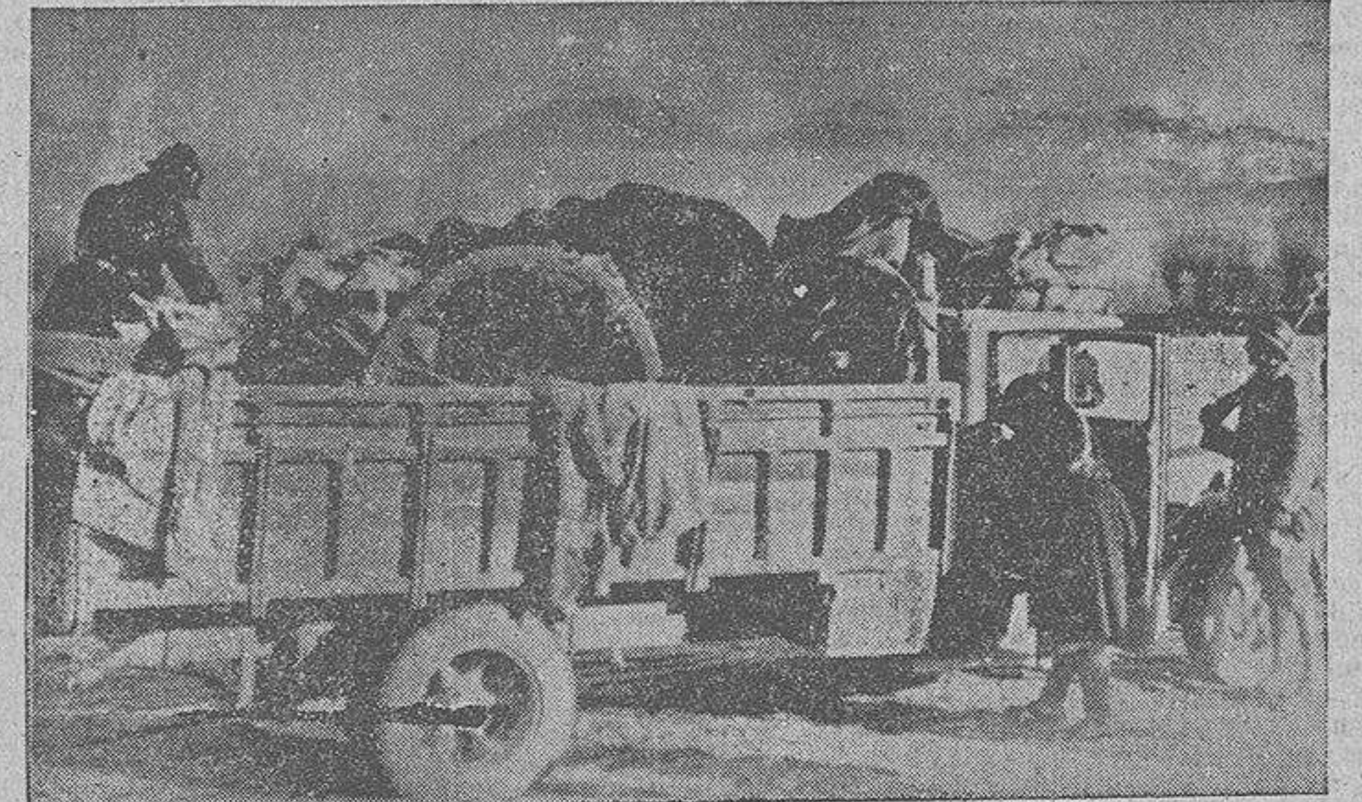
Guardias móviles y soldados franceses registran, en el campo de Saillagouse, el contenido de uno de los innumerables camiones del ejército rojo que, cargados de material de guerra han atravesado la frontera de los Pirineos.