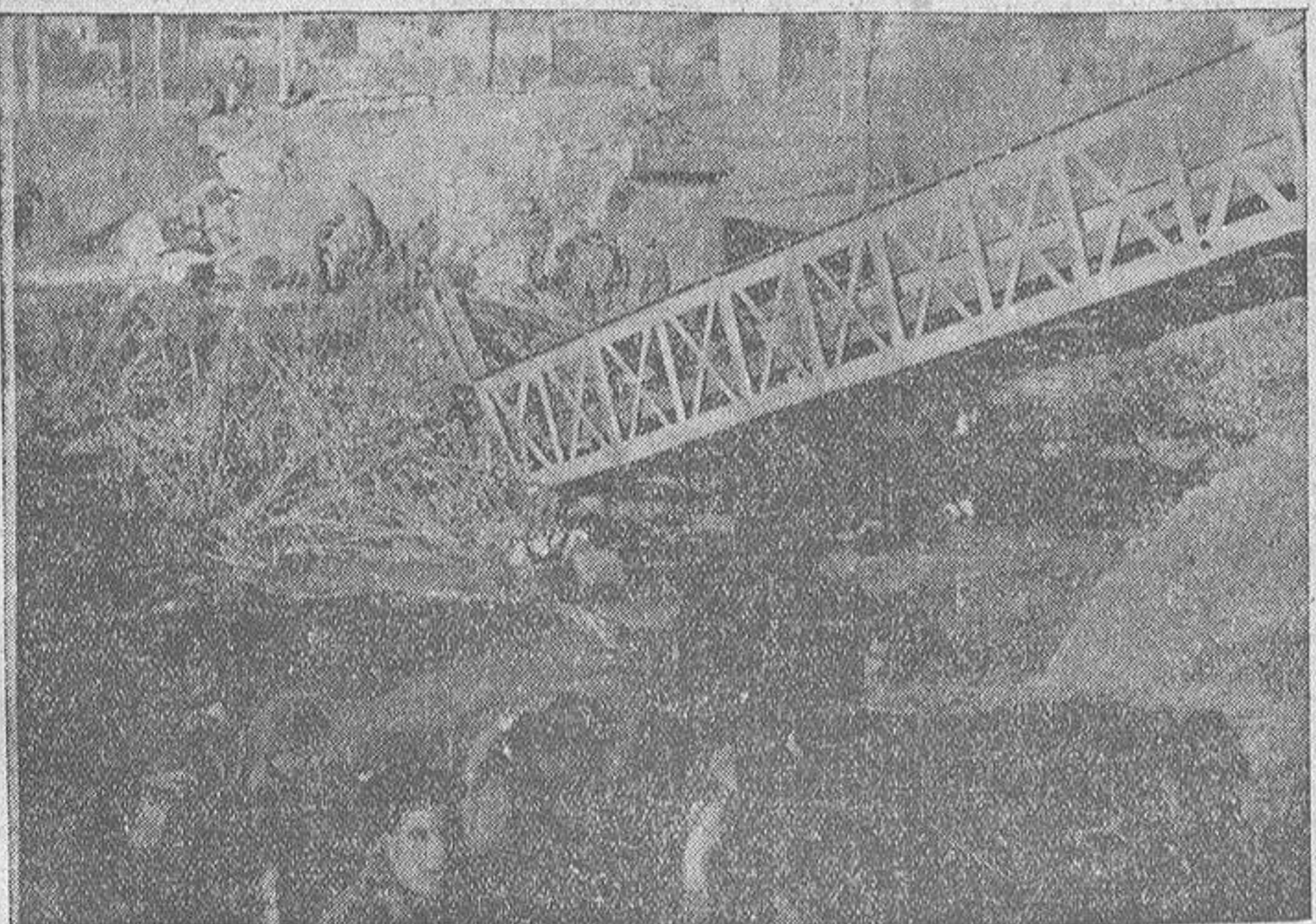
Los servicios de Ingenieros del Ejército nacional repara provisionalmente uno de los cién- to y pico de puentes destruidos por las hordas de Negrin en retirada vertiginosa y des- ordenada hacia la frontera francesa.

Paris tiene, además de M. Lebrun, tres presidentes de República: Azaña, Aguirre y Companys, presidentes de las repúblicas de España, Euzkadi y Cataluña. Cuenta también la capital francesa desde hace tiempo entre sus habitantes al presidente de la primera — primera de la segunda — República española, D. Nizeto Acedá Zamora. El chocolatero y el abogado de los pistoleros de la FAI se instalaron en París, incluso con sus caricaturas de gobierno. Y Azaña ocupa la Embajada de España en París; cobarde, con su anomalía monstruosa de su espíritu, se niega a volver a la zona roja, pero firma decretos fechados en París, en los que recomienda el retorno de sus ministros a la zona que él no quiere volver a pisar. Este hecho, tan repugnante como canallésco, es suficiente para dar una idea clara de la catadura de este sujeto.