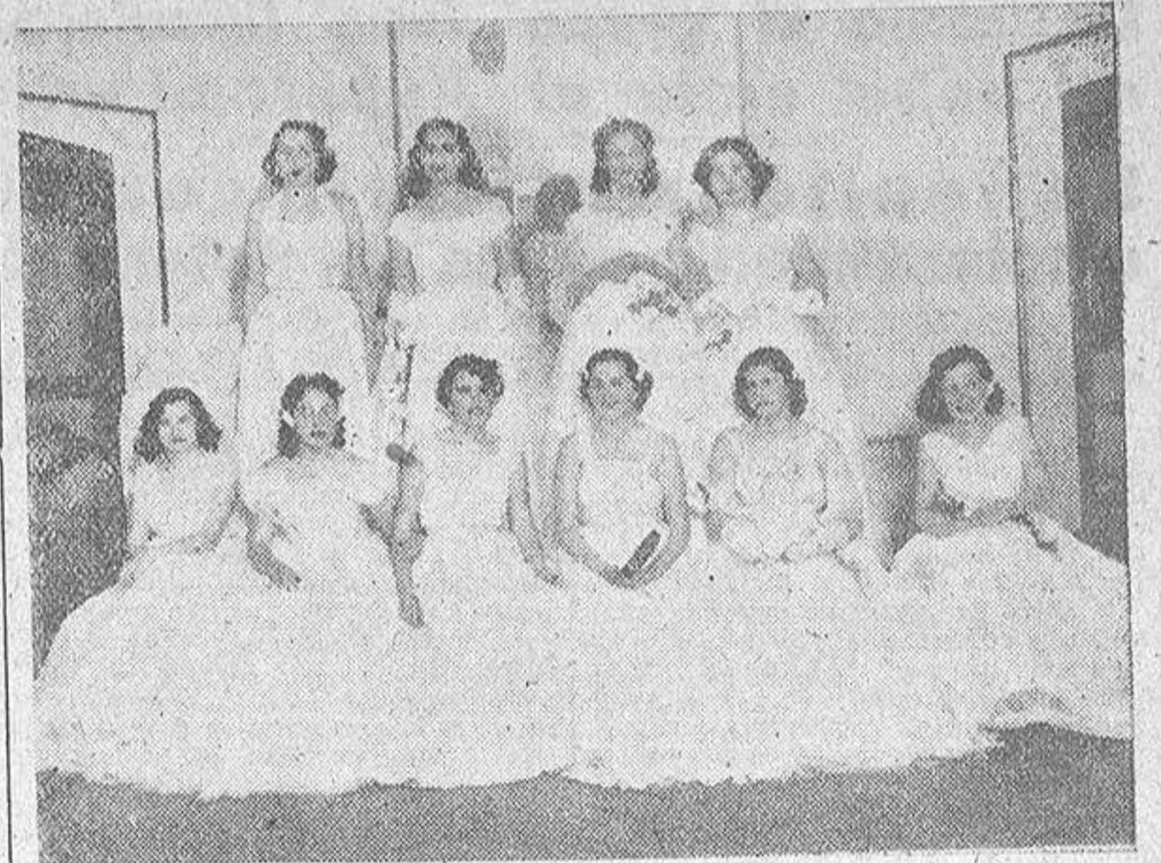
Grupo de distinguidas señoritas coruñesas, que el sábado último hicieron su presentación en sociedad, en la fiesta de gala organizada por el Casino de La Coruña.—(FOTO BLANCO).