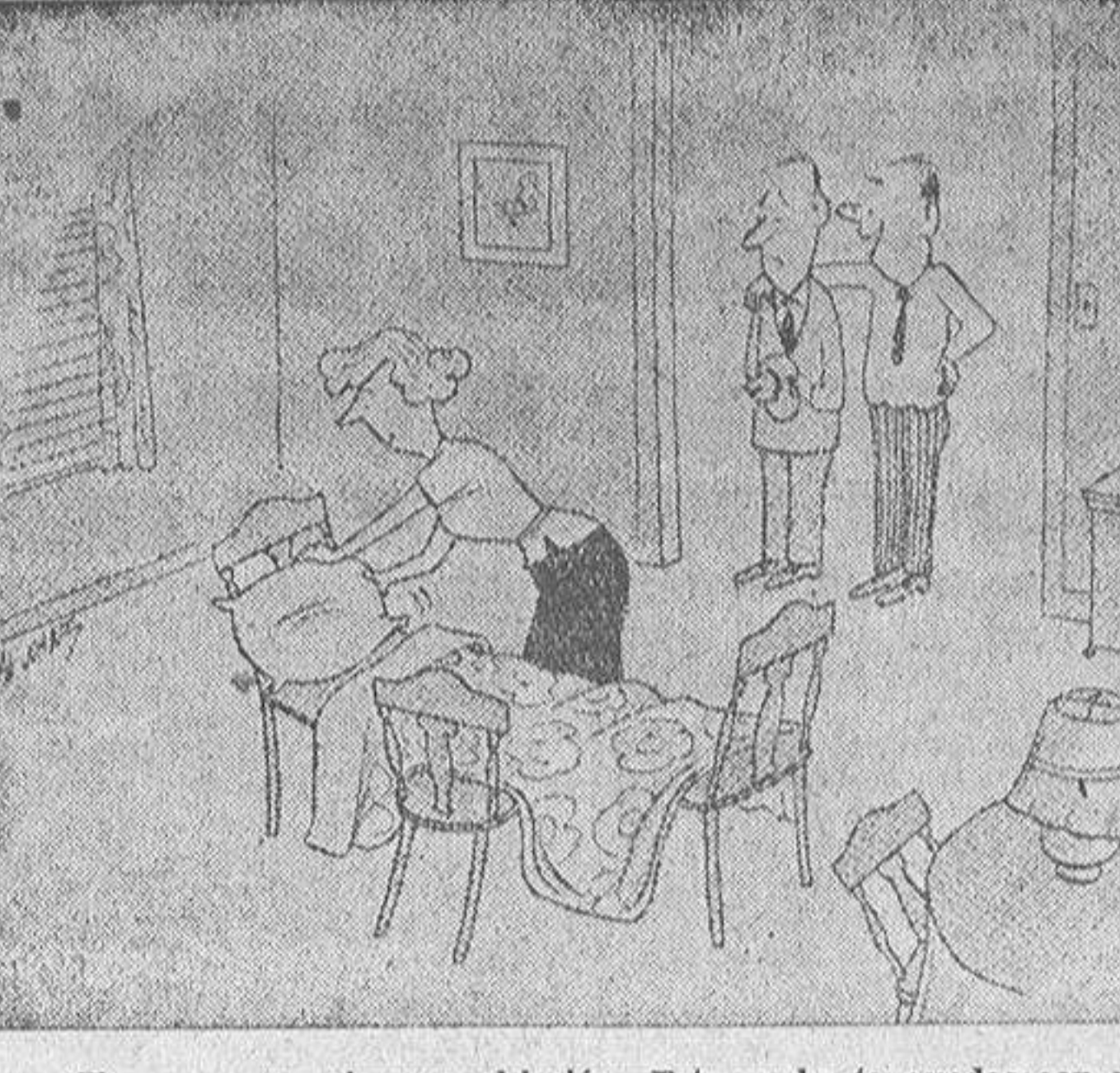
—Y no pongas ninguna objeción. Esta noche te quedas con nosotros...