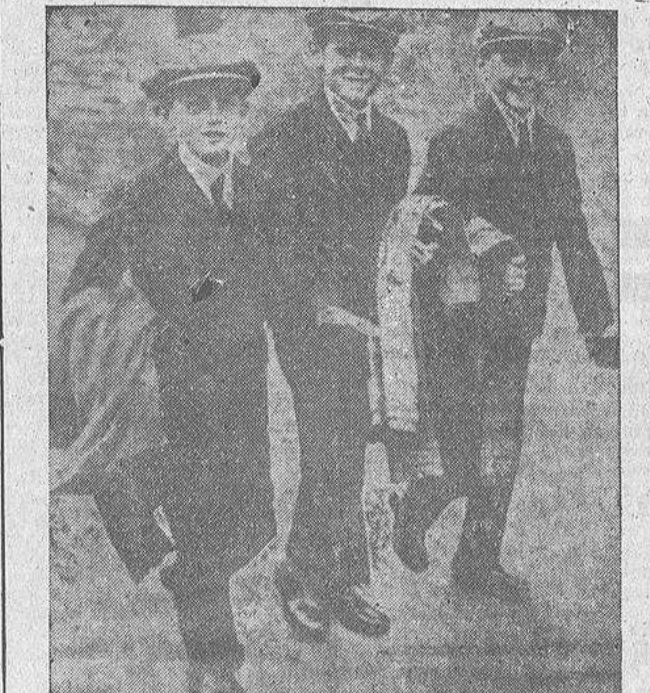
Se celebra estos días en Yugoslavia el quince aniversario del nacimiento del Rey Pedro. Grandes desfiles y fiestas conmemorativas han tenido lugar en todo el país. En la fotografía, aparece el rey Pedro, con otros miembros de la corte, cuando era es-

Lea usted todos los lunes la HOJA OFICIAL de La Coruña