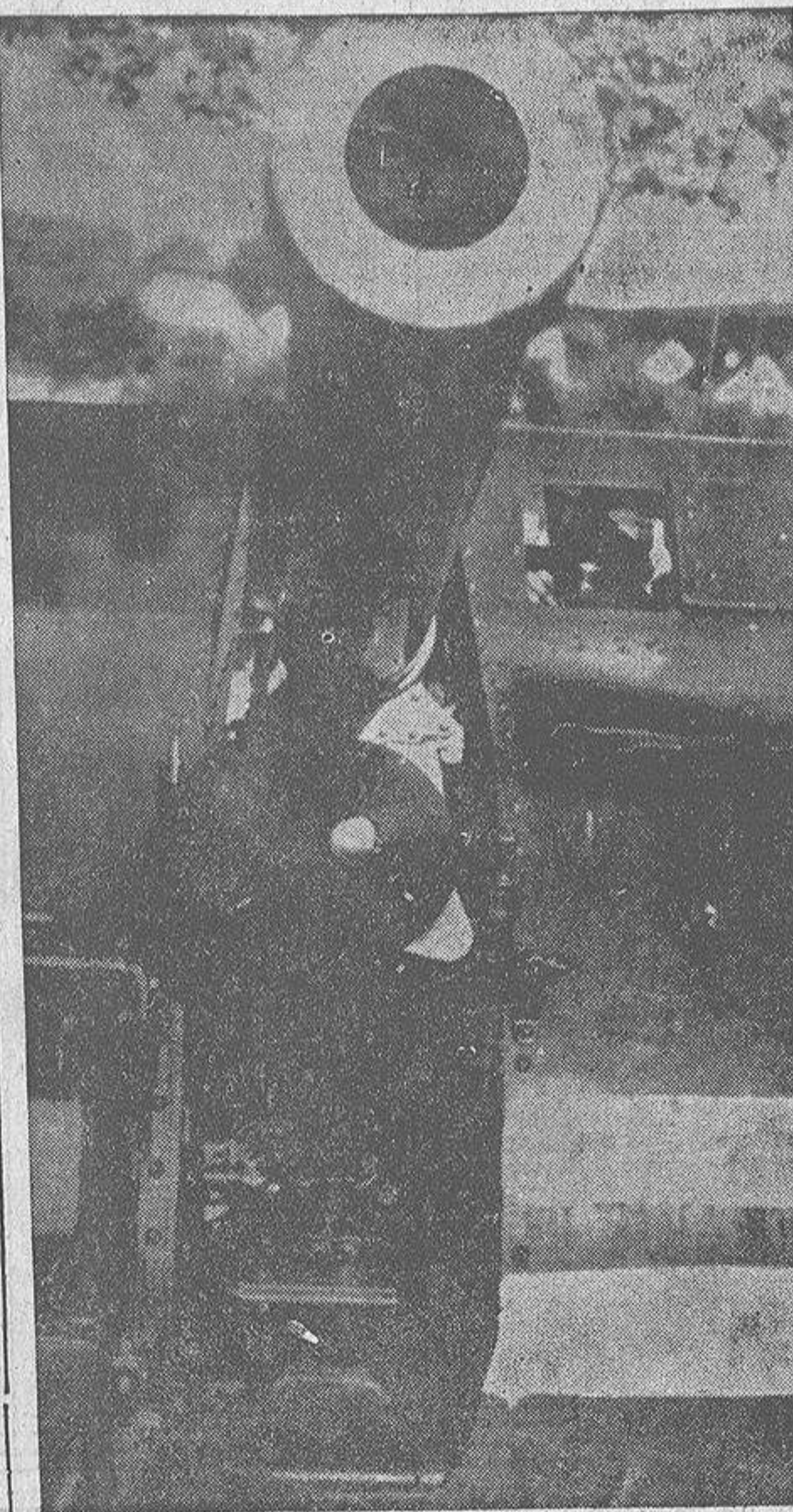
Mientras en las Cancillerías se negocia activamente la solución pacífica de los graves problemas europeos, estos cañones de grueso calibre están preparados en las fronteras para, en caso necesario, decir la última palabra