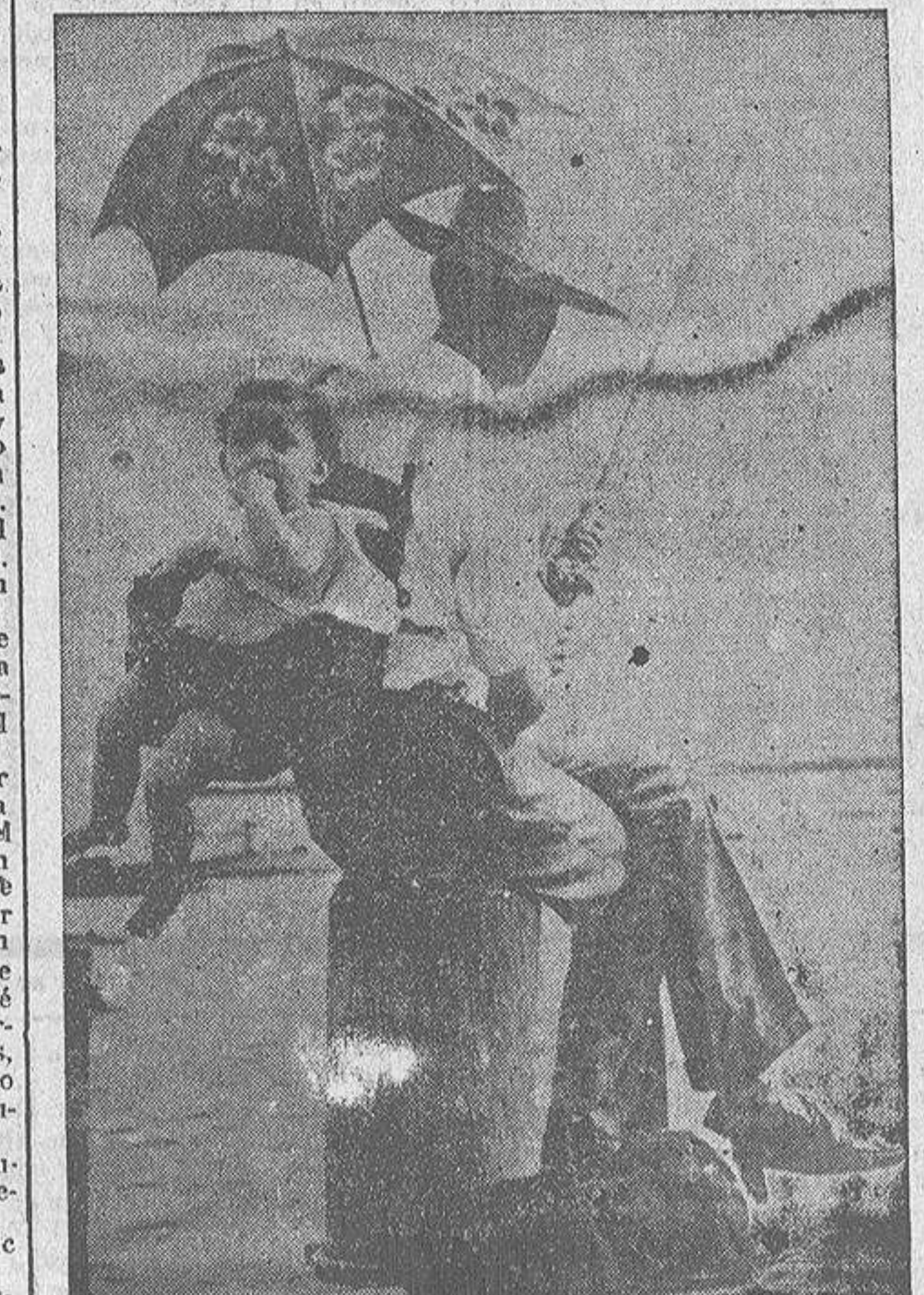
Mientras la esposa va de visita o de compras, este admirable y paciente señor se ceba el hijo a la espalda y la vez al pican!