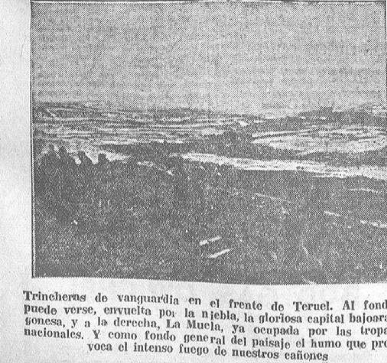
Trincheras de vanguardia en el frente de Teruel. Al fondo puede verse, envuelta por la niebla, la gloriosa capital balearonesa, y a la derecha, La Muela, ya ocupada por las tropas nacionales. Y como fondo general del paisaje el humo que provoca el intenso fuego de nuestros cañones

Continúa abierta en esta capital la suscripción para recaudar fondos con destino al grandioso Monumento Nacional que por iniciativa del Ayuntamiento de Burgos ha de erigirse a la memoria de los gloriosos Caídos en defensa de la Patria, y a cuya obra no dejarán sin duda alguna, de contribuir, todos los buenos coruñeses. Los donativos se reciben durante las horas de nueve a catorce y de dieciséis a diecinueve, en las oficinas de la Sección Central del Ayuntamiento.