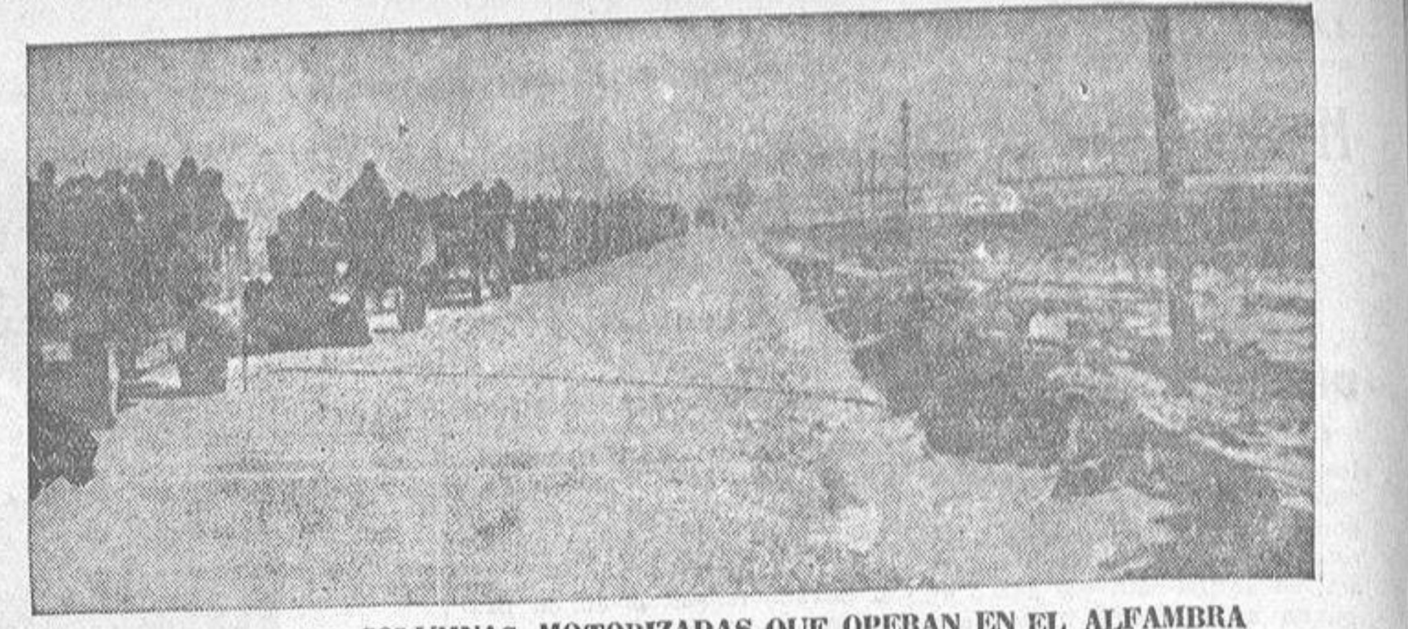
UNA DE LAS COLUMNAS MOTORIZADAS QUE OPERAN EN EL ALFAMBRA