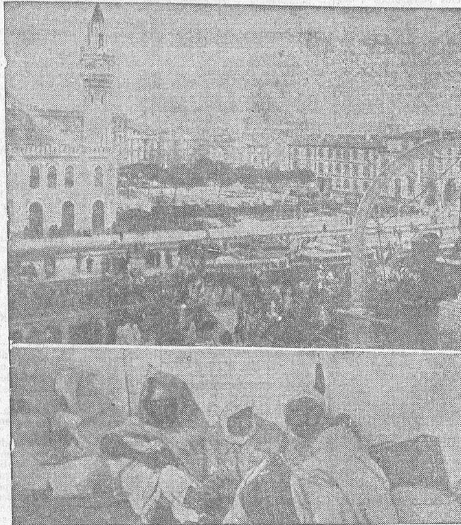
La peregrinación a la meca. — Dos estampas del camino. — Antes de embarcar y en viaje