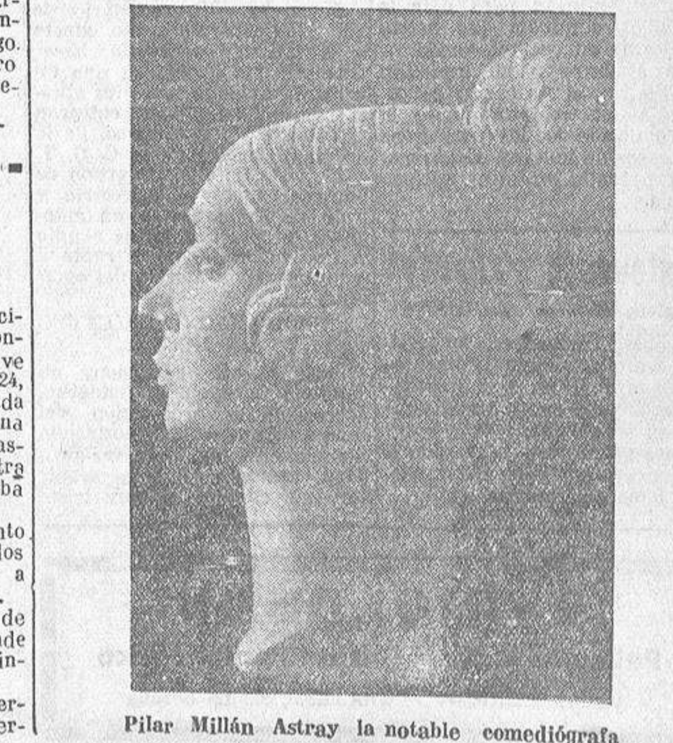
Pilar Millán Astray la notable comediógrafa