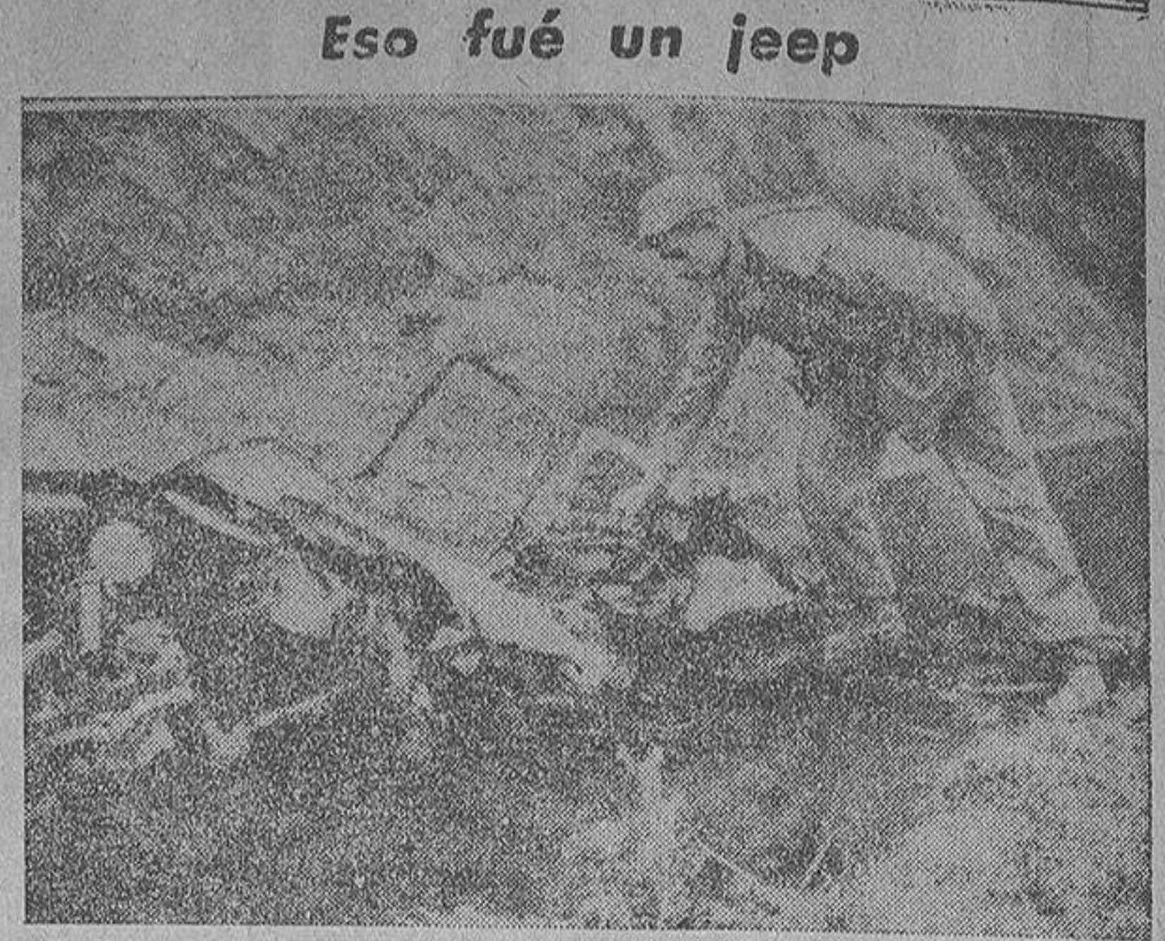
En el frente de Corea, un jeep de las fuerzas norteamericanas hizo estallar una mina, que destruyó el vehículo, mató a su conductor e hirió a varios soldados