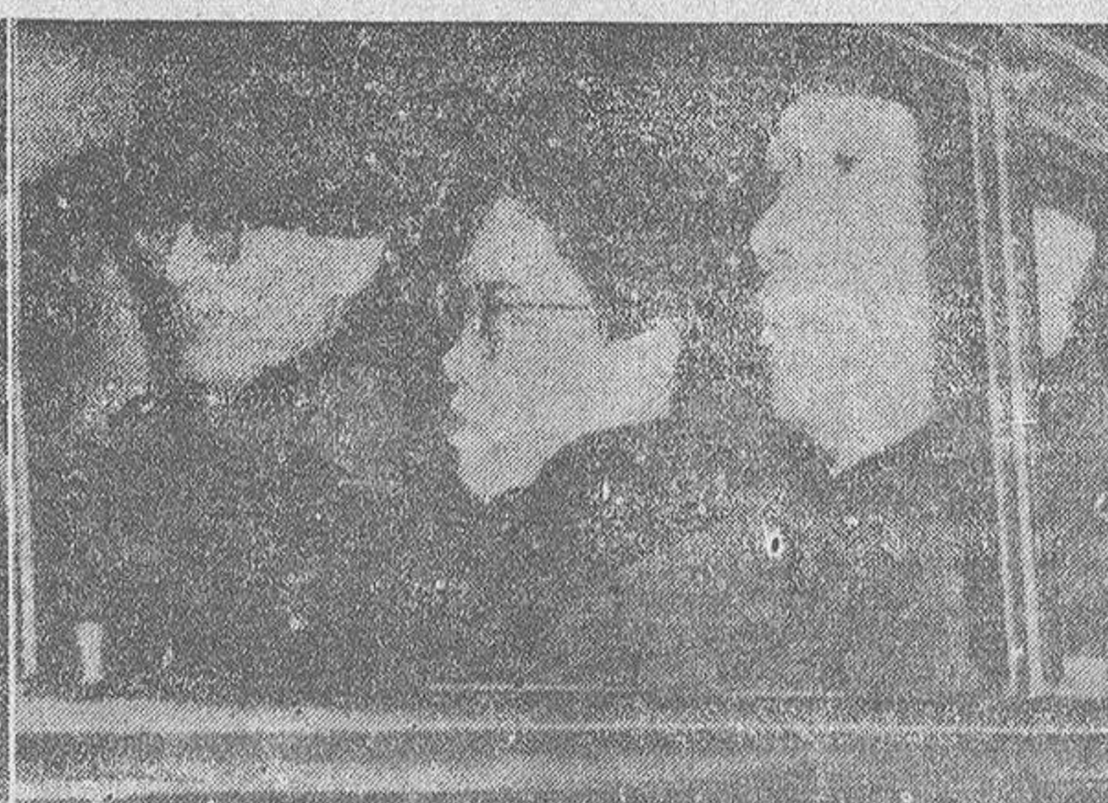
Mientras el general Mac Arthur se enfrenta en Corea con una abierta guerra de la China comunista, no provocada, los tres delegados de este país, rostros inexpresivos y voluntades hipotecadas, se dirigen a la O. N. U., para "reclamar sus derechos".