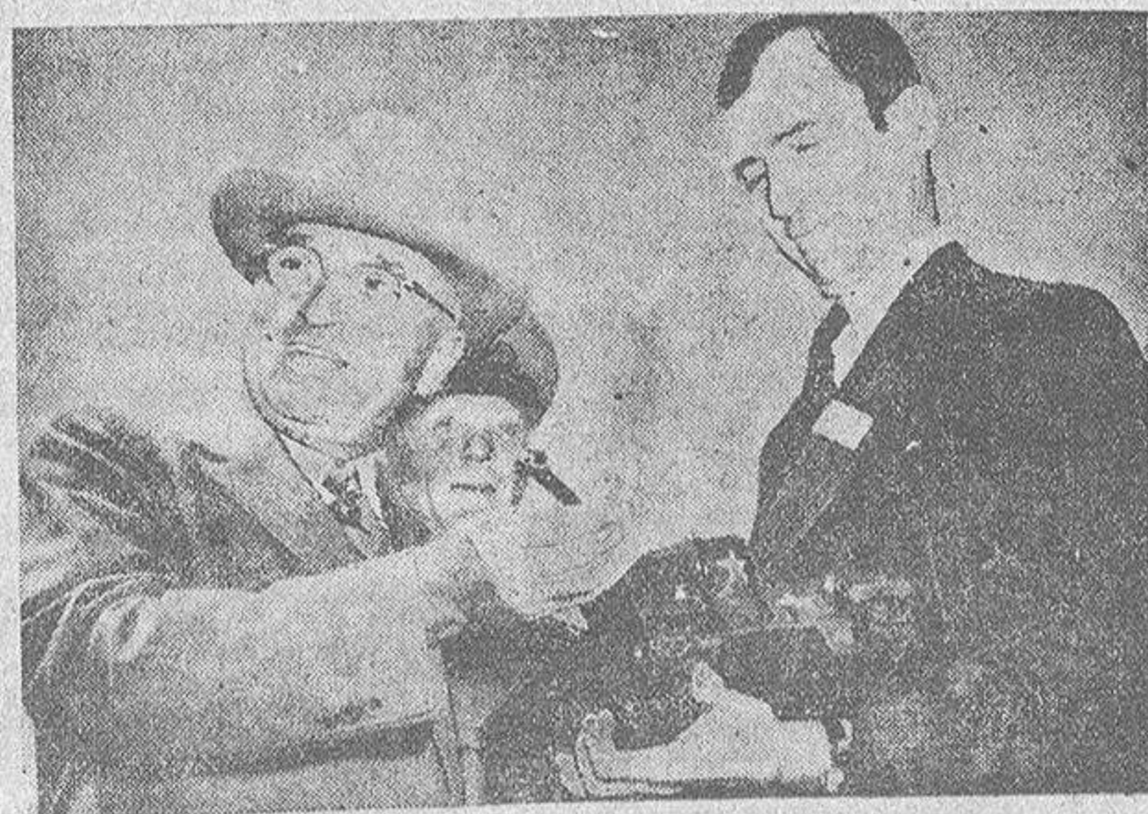
El Presidente Truman examina un modelo nuevo de tanque, en el que se confía para hacer frente a la grave situación de las fuerzas de las Naciones Unidas en Corea